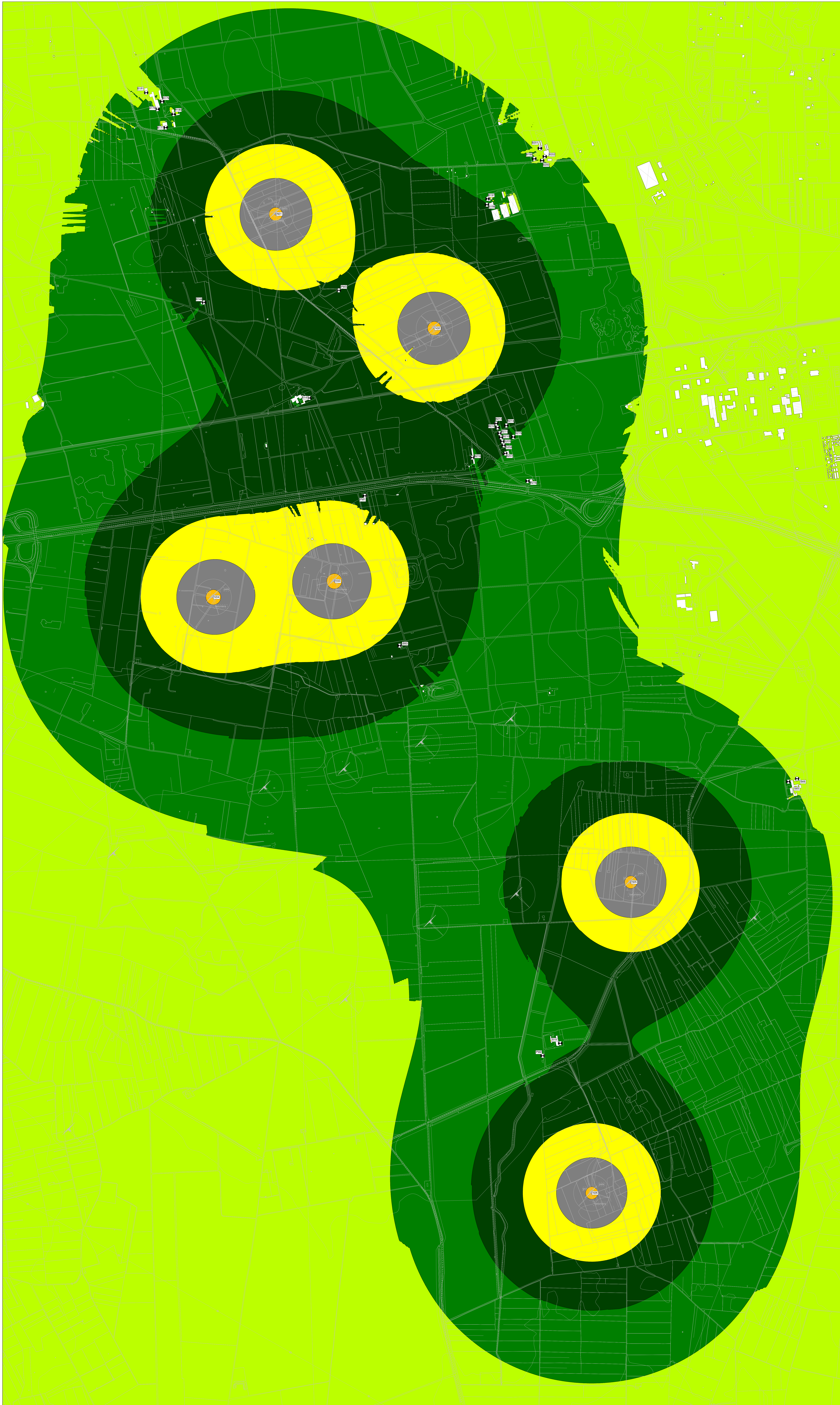
MAPPA A COLORI CON ISOFONICHE - LIVELLI DI EMISSIONE DIURNI E NOTTURNI - FASE DI ESERCIZIO