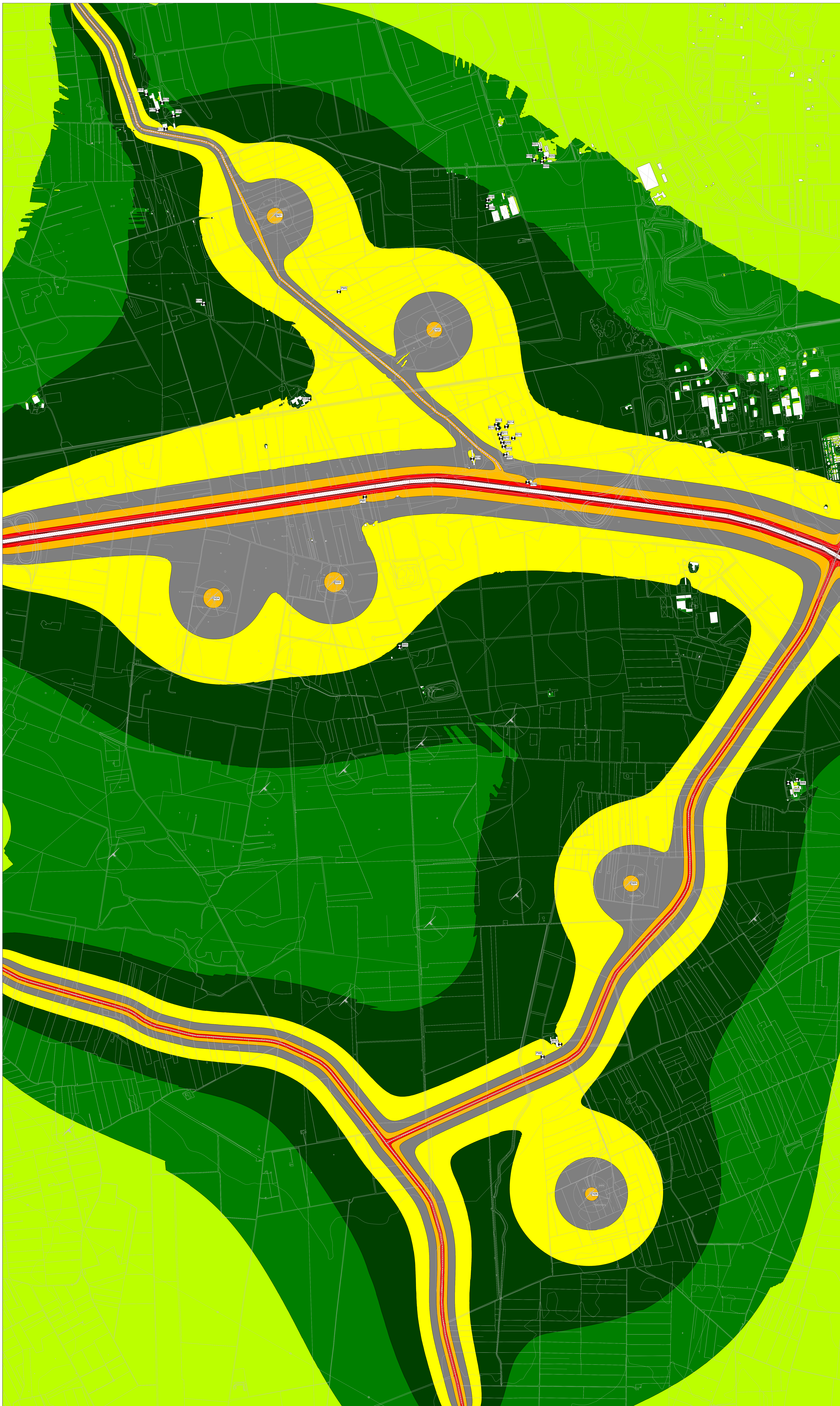
MAPPA A COLORI CON ISOFONICHE - LIVELLI DI IMMISSIONE DIURNI - FASE DI ESERCIZIO