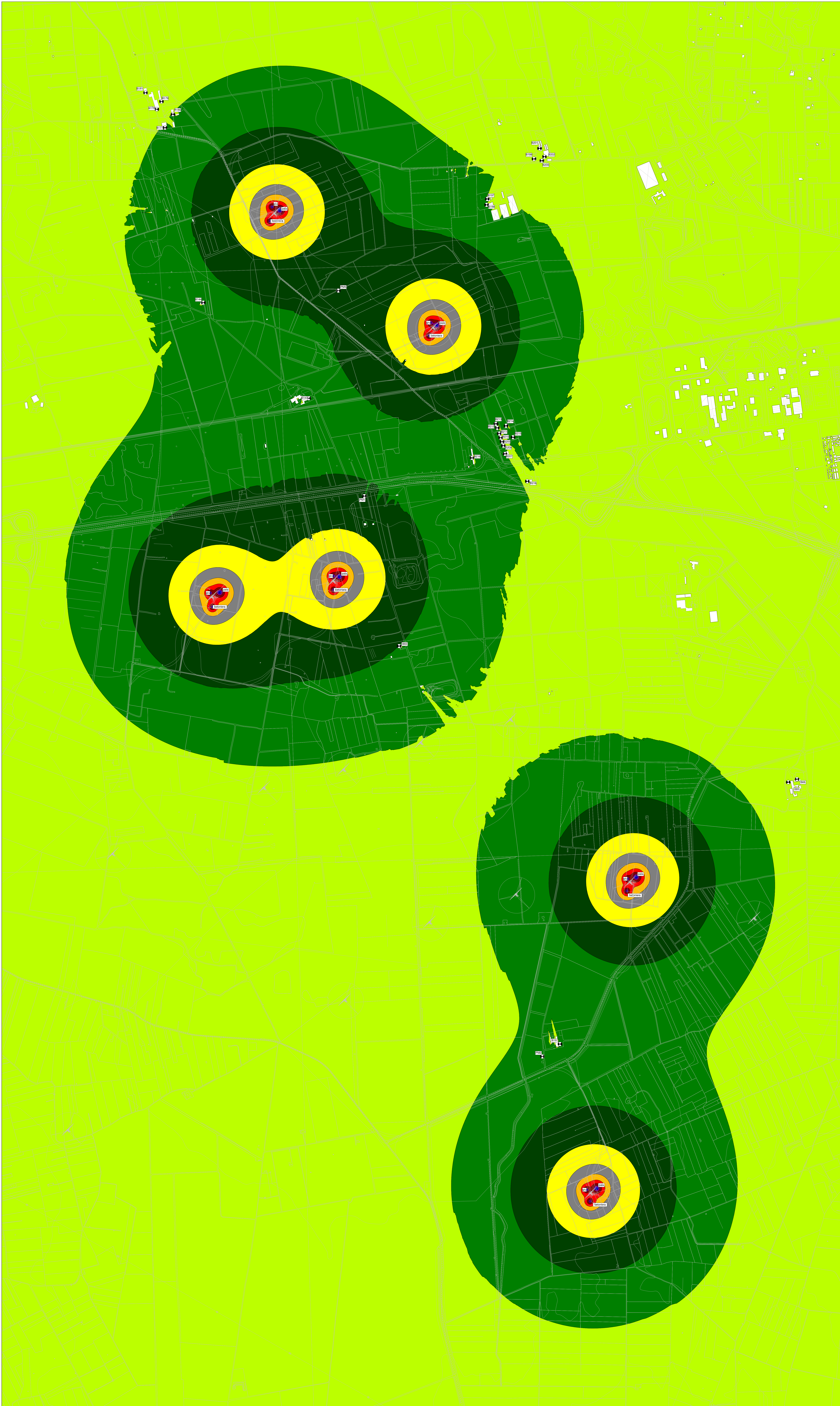
MAPPA A COLORI CON ISOFONICHE - LIVELLI DI EMISSIONE DIURNI - FASE DI CANTIERE