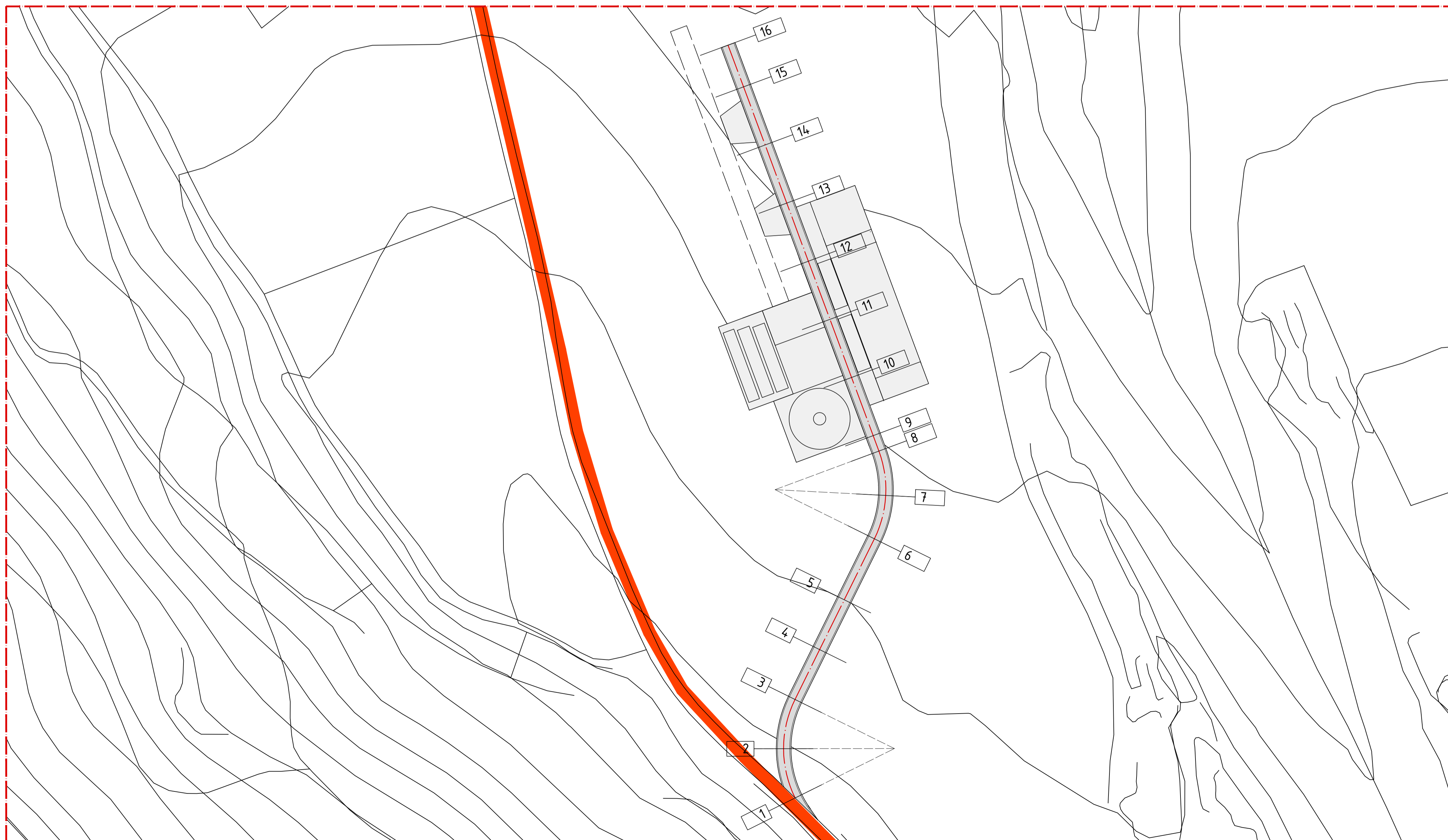
Planimetria WTG-H Scala 1:1.000