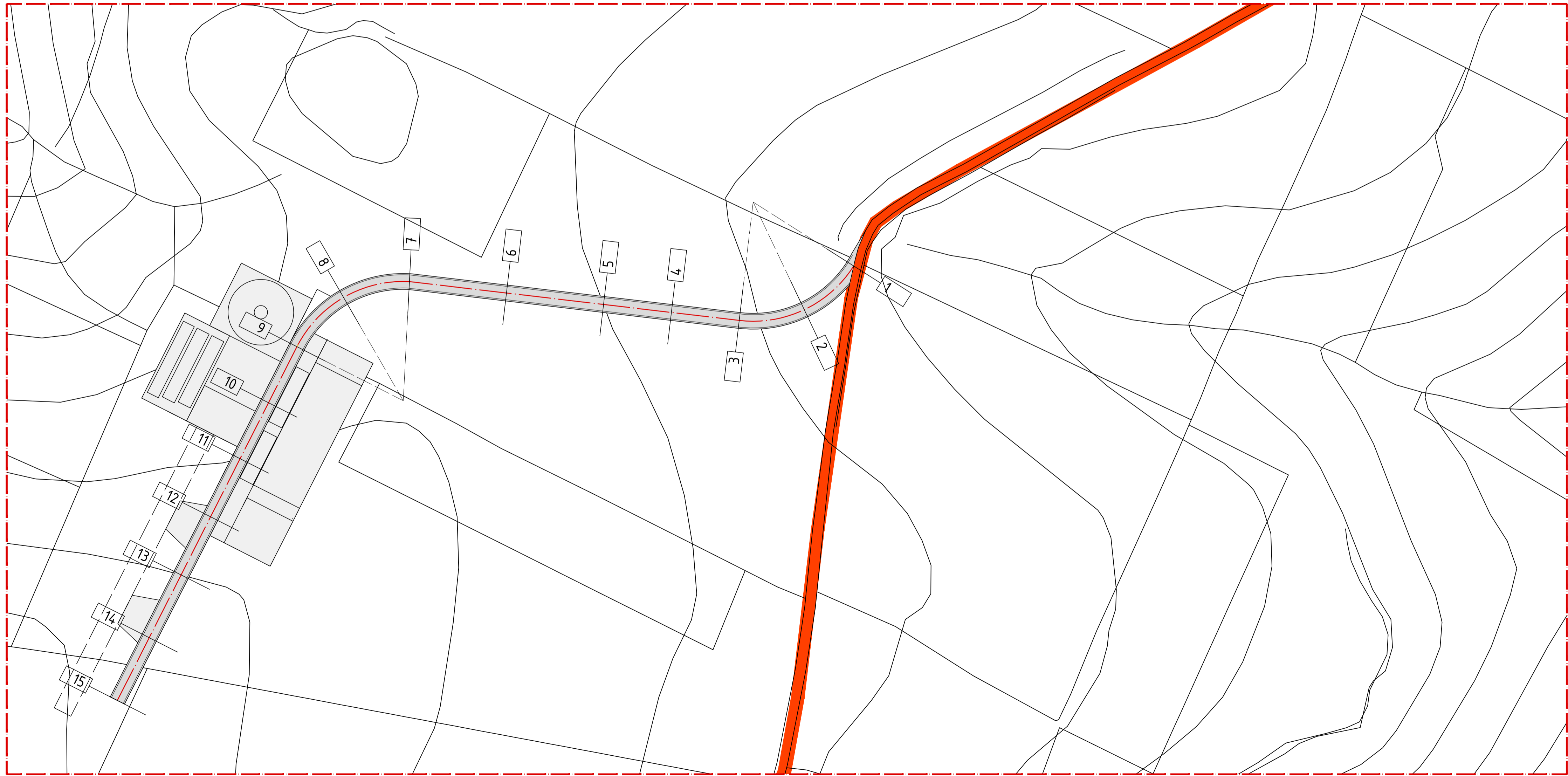
Planimetria WTG-M Scala 1:1.000