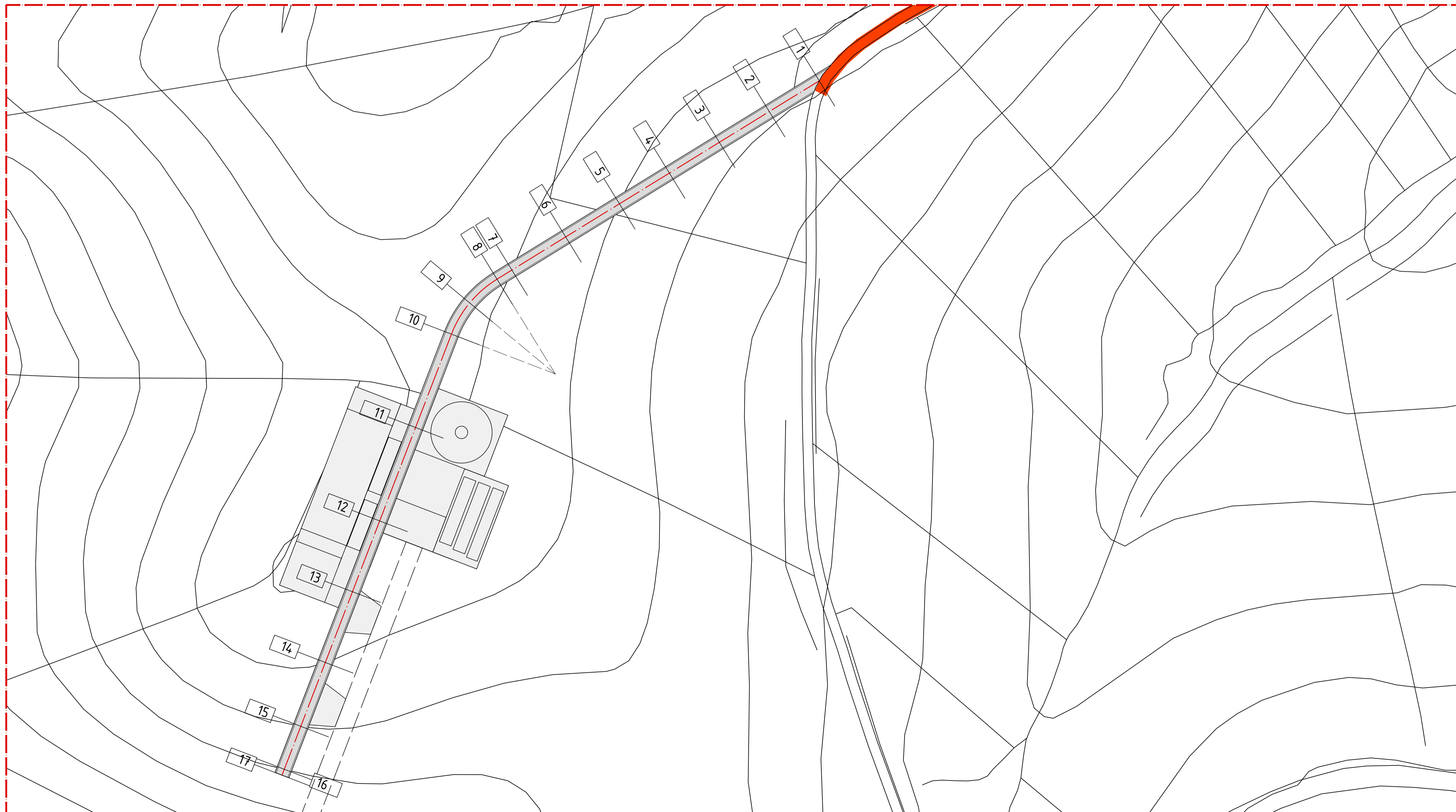
Planimetria WTG-P Scala 1:1.000