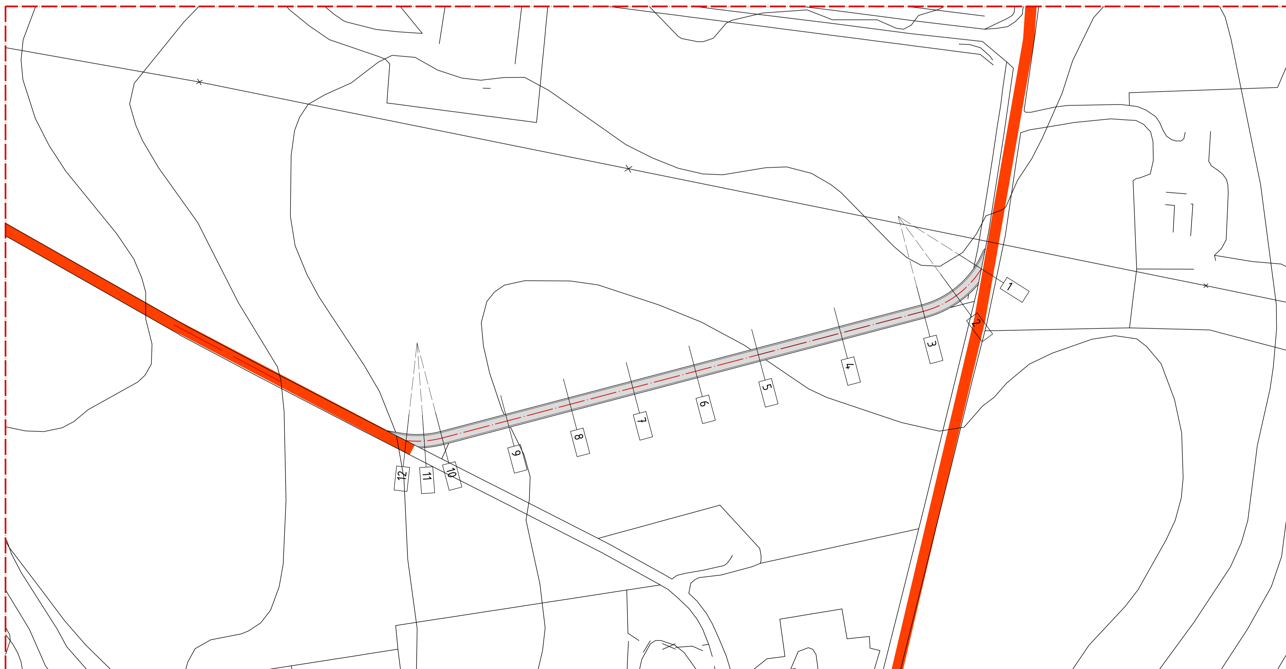
Planimetria Tratto-B Scala 1:1.000