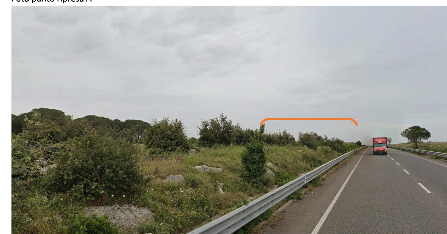
In arancio è riportata l'area d'ingombro (non visibile dal punto di ripresa) dei siti di impianto.