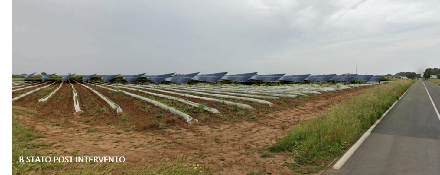
B STATO POST INTERVENTO