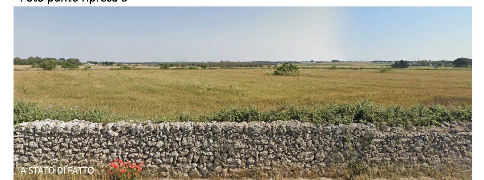
A STATO DI FATTO