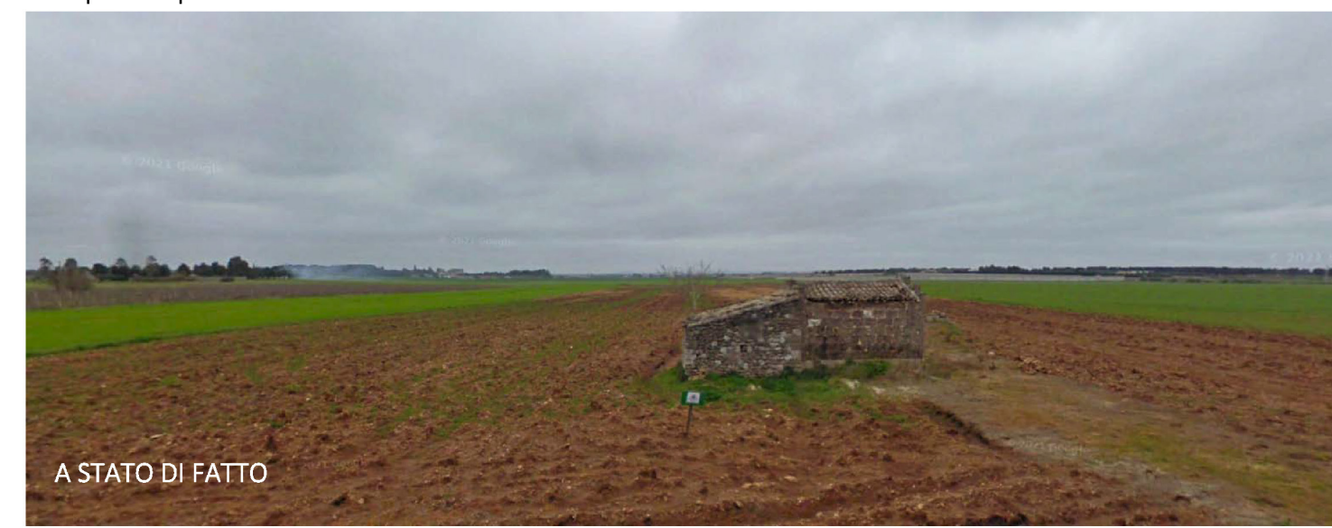
A STATO DI FATTO