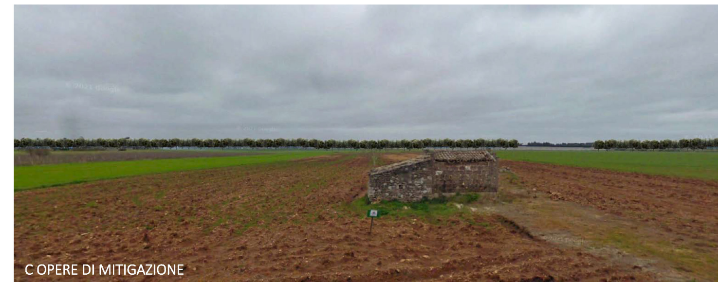
C OPERE DI MITIGAZIONE