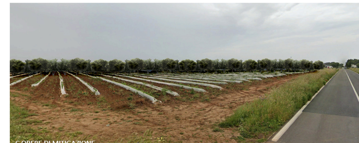
C OPERE DI MITIGAZIONE