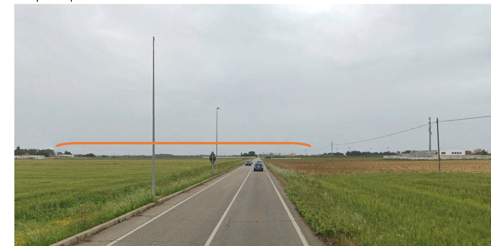
In arancio è riportata l'area d'ingombro (non visibile dal punto di ripresa) dei siti di impianto.