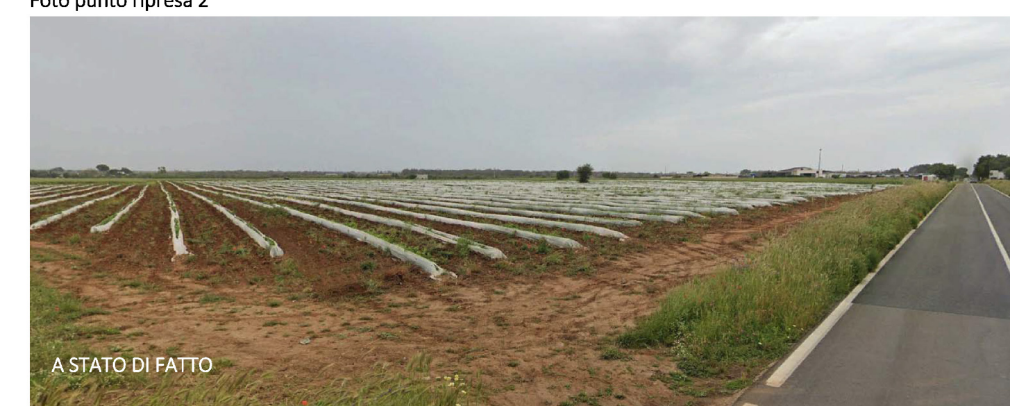
A STATO DI FATTO