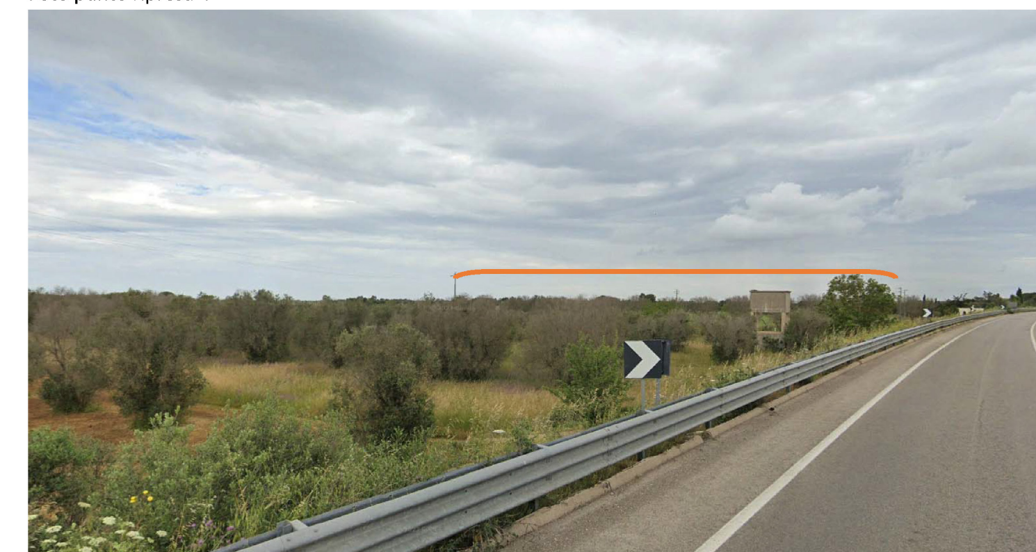
In arancio è riportata l'area d'ingombro (non visibile dal punto di ripresa) dei siti di impianto.