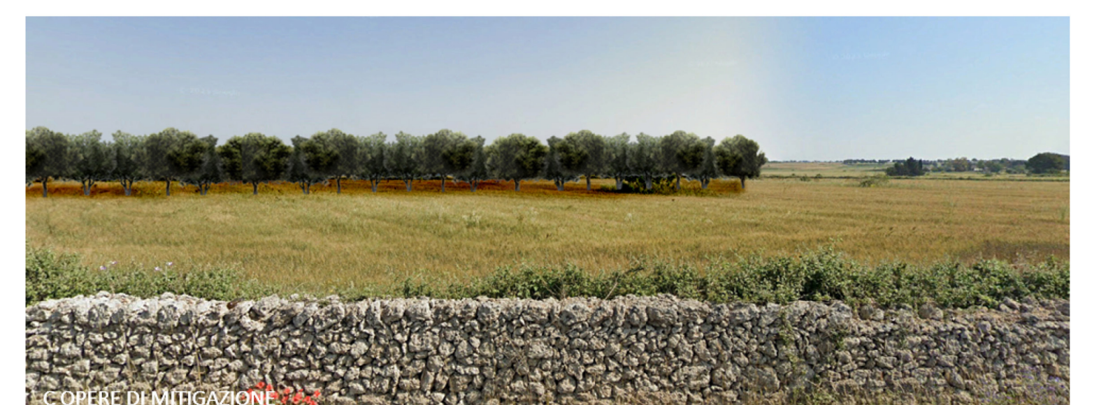
C OPERE DI MITIGAZIONE