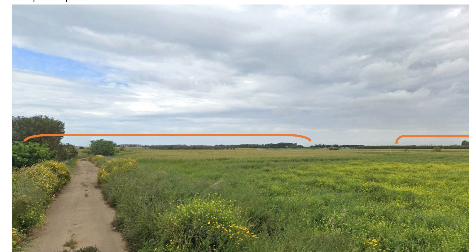
In arancio è riportata l'area d'ingombro (non visibile dal punto di ripresa) dei siti di impianto.