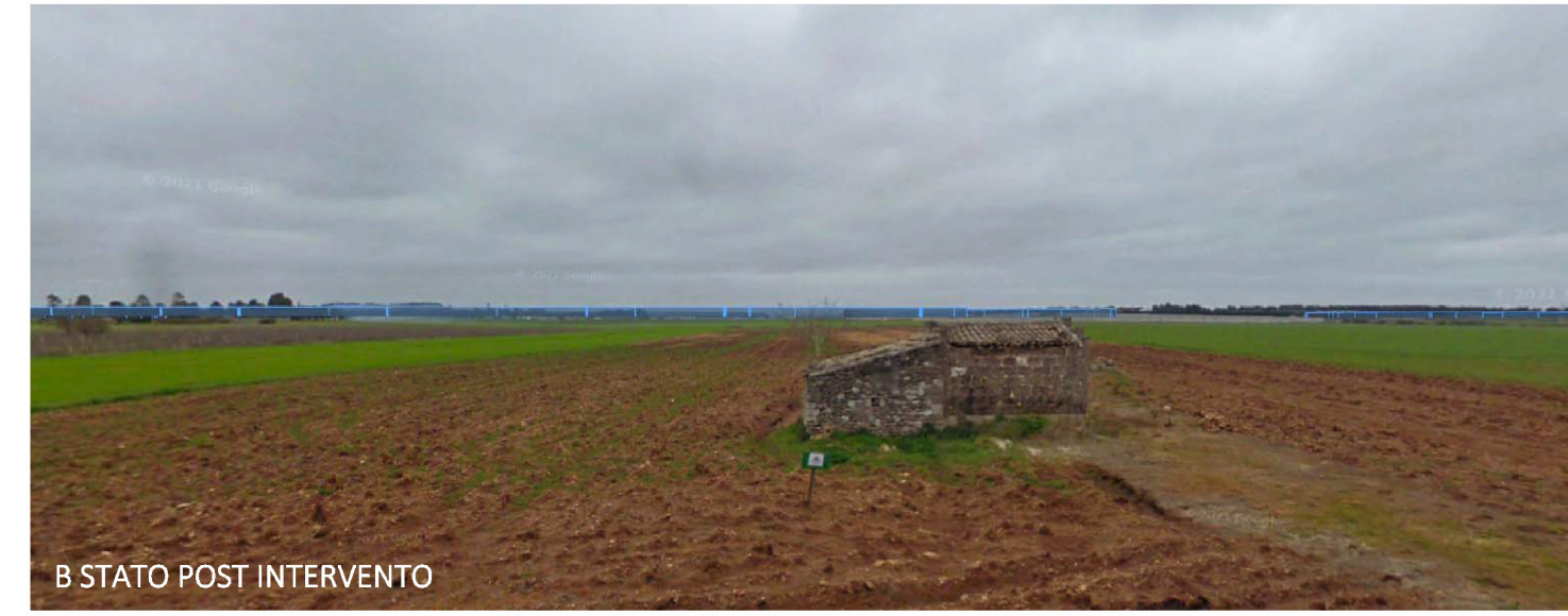
B STATO POST INTERVENTO