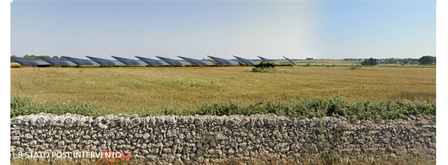
B STATO POST INTERVENTO