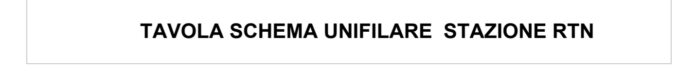
TAVOLA SCHEMA UNIFILARE STAZIONE RTN

SVILUPPATORE Fabreen s.r.l. Sede Legale: Via Benedetto XVI n. 11 FABRIANO (MC) CAP 06044 C.F.P. IVA 05027030877 Legale rappresentante: Avv. Fabrizio Romano