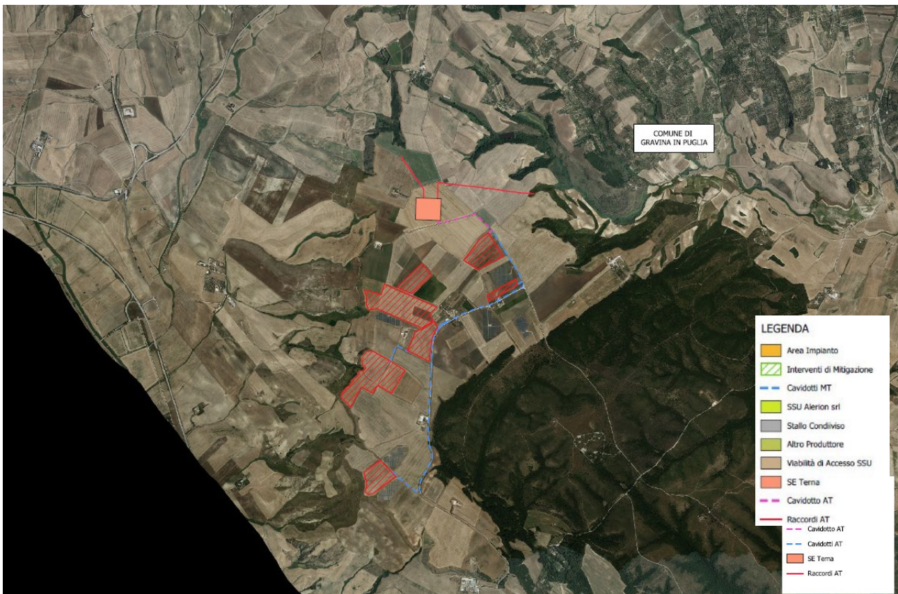
Figura 4-2: Tav ALL_00.2 Inquadramento delle opere in progetto su ortofoto

Progetto per la realizzazione di un impianto agrivoltaico della potenza massima installata pari a 53,48 MWp e potenza di immissione pari a 59,99 MW e relative opere di connessione alla RTN da realizzarsi in "Contrada Pezze di Panni" nel Comune di Gravina in Puglia (BA)