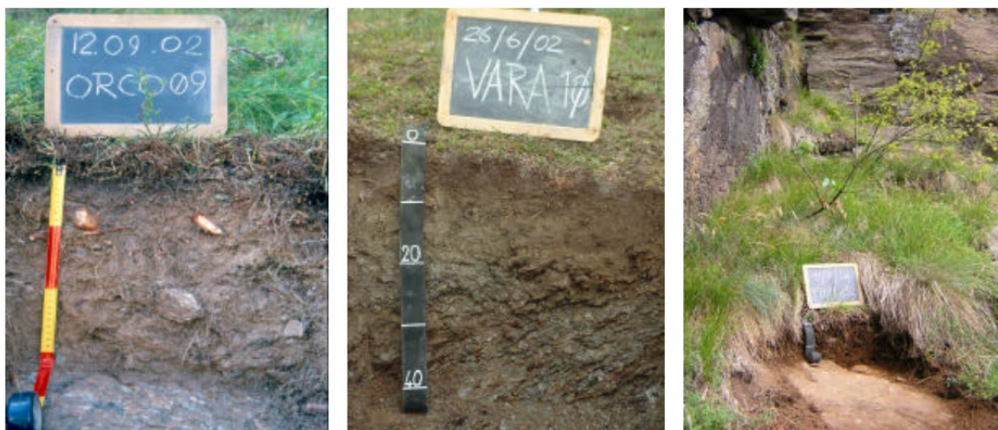
Figura 1: Esempi di scavi per rilevazione del profilo pedologico