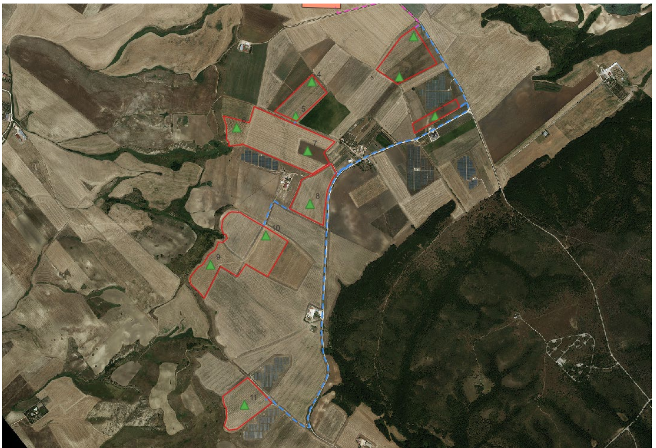
Figura 5: Punti di monitoraggio

I pozzi saranno sigillati nella loro parte superiore per impedire contaminazioni accidentali della falda. Ogni operazione di prelievo sarà preceduta da un corretto spurgo del piezometro per eliminare il volume d'acqua che staziona all'interno del piezometro.