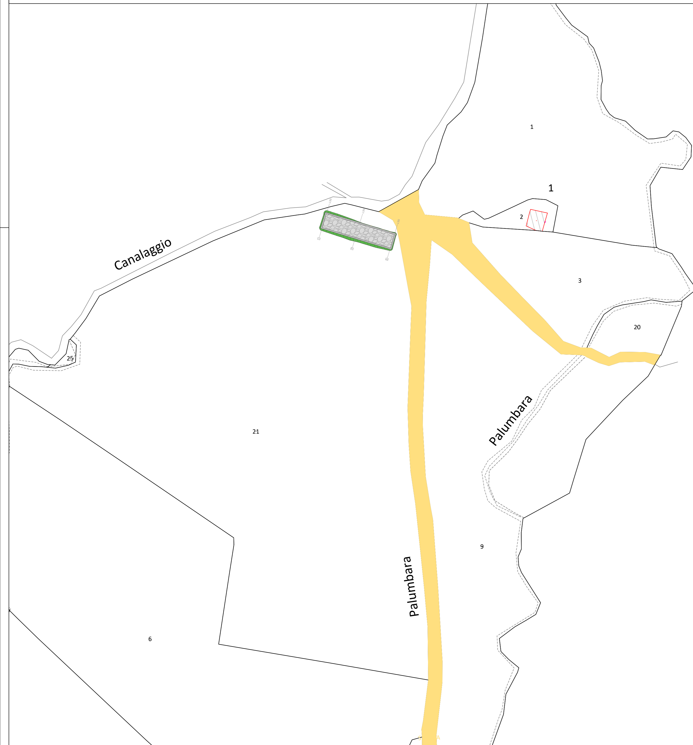
Planimetria particolareggiata su catastale - scala 1:1000