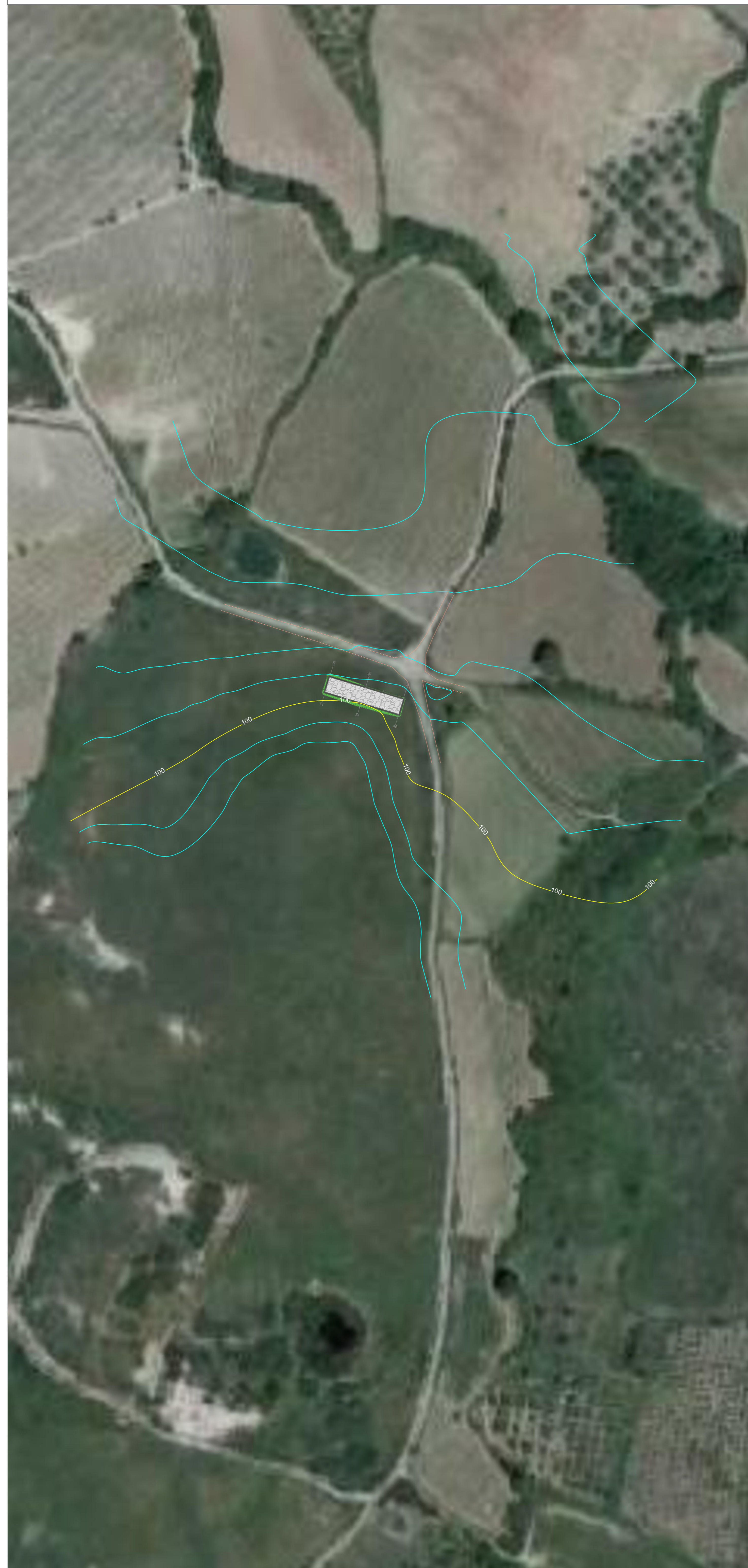
Planimetria particolareggiata su ortofoto - scala 1:1000