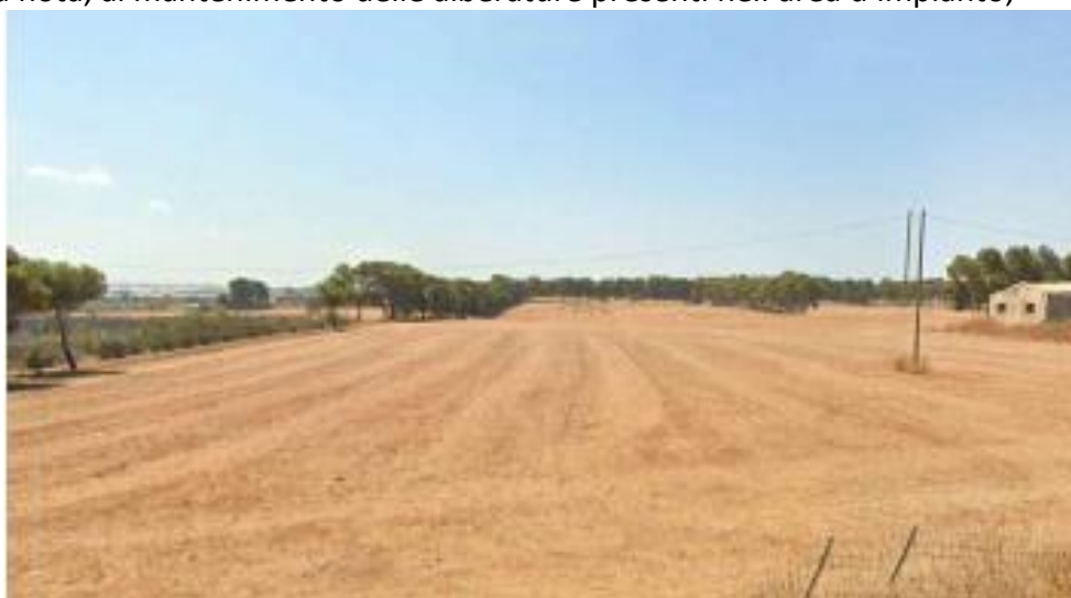
Figura 3 - Stralcio Elaborato RS06EPD0060A0_Area d’impianto dalla SPO1 ante operam

CONSIDERATE pertanto le valutazioni sopra riportate, formulate dalla Soprintendenza di Ragusa nella citata nota, al mantenimento delle alberature presenti nell’area d’impianto;