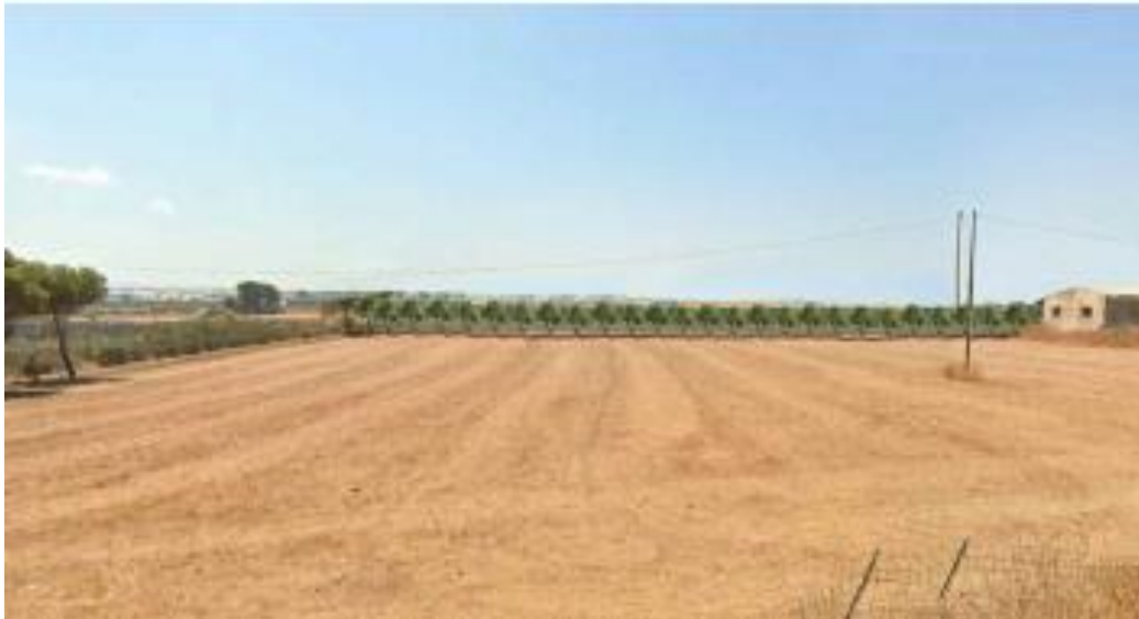
Figura 4 - Stralcio Elaborato RS06EPD0060AO_Area d'impianto dalla SP01 post operam

VISTO l'art. 18 "Viabilità storica" delle NTA del Piano Paesaggistico di Ragusa che, riconoscendone il valore culturale e ambientale, tutela l'infrastrutturazione storica del territorio "in quanto testimonianza delle trame di relazioni antropiche storiche ed elemento di connessione di contesti culturali e ambientali di interesse testimoniale, relazionale e turistico-culturale. La tutela si orienta in particolare sulla rete delle viabilità storica secondaria, che costituisce parte integrante della trama viaria storica, oltre che sui rami dismessi delle reti ferroviarie, a scartamento ridotto" .