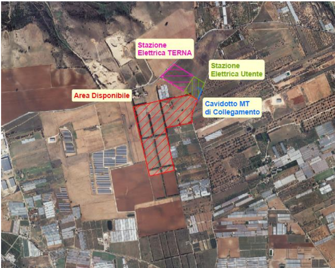
Figura 1 - Stralcio Elaborato RS06EPD0039A0_Tav.1 Inquadramento territoriale dell'impianto su orto-foto

CONSIDERATO che il paesaggio in cui si inserisce l'impianto è caratterizzato dai sabbiosi plateau collinari digradanti verso il litorale, con le valli dell'Ippari e dell'Acate che segnano profondamente il paesaggio definendo la vasta e fertile pianura di Vittoria. Il paesaggio agrario è ricco e vario per la presenza di ulivi e agrumeti ed estese aree di vigneto che si protendono sui versanti collinari dell'interno. Le città di nuova fondazione ( Vittoria, Acate ) e le città di antica fondazione (Comiso e Caltagirone) costituiscono una struttura urbana per poli isolati tipica della Sicilia interna. L'intensificazione delle colture ha portato ad un'estensione dell'insediamento sparso, testimoniato in passato dalle numerose masserie, oggi spesso abbandonate, nella zona di Acate e dei nuclei di Pedalino e Mazzarrone. L'area che sarà occupata dall'impianto si sviluppa alle estreme propaggini dell'ambito a poca distanza dai centri urbani di Acate e Vittoria in un'area a coltivazione agraria a campi definiti, con alberature perimetrali, lungo la SP1 Acate – Dirillo.