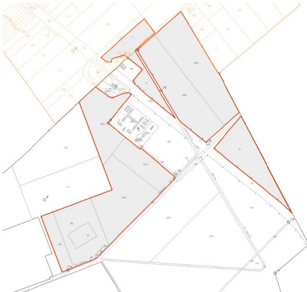
Figura 2.3 - Inquadramento catastale area S1-S2-S3-S4