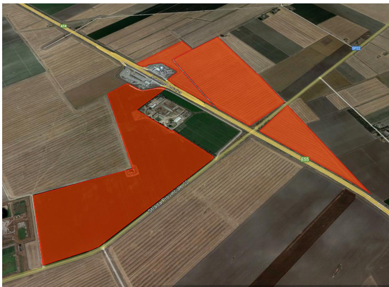
Figura 2.1: Localizzazione dell'area di intervento. In rosso il perimetro delle aree di progetto.

Il sito ubicato in posizione baricentrica sull'asse di collegamento ipotetico tra il Comune di Foggia e il Comune di San Severo il paesaggio è tipico del Paesaggio della campagna Pugliese con un andamento da pianeggiante a debolmente ondulato.