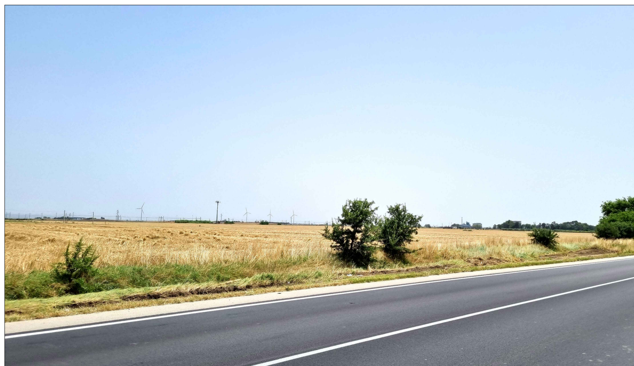
FOTOINSERIMENTO 2 - STATO DI FATTO