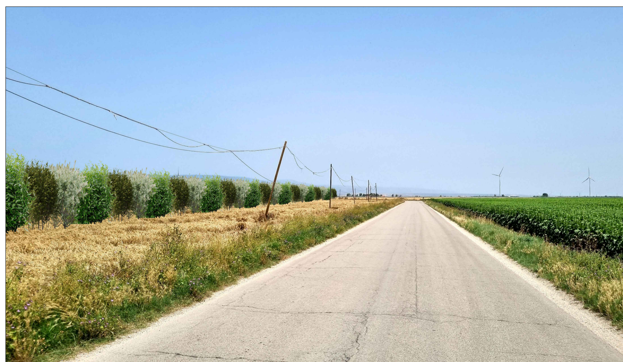
FOTOINSERIMENTO 3 - STATO DI PROGETTO