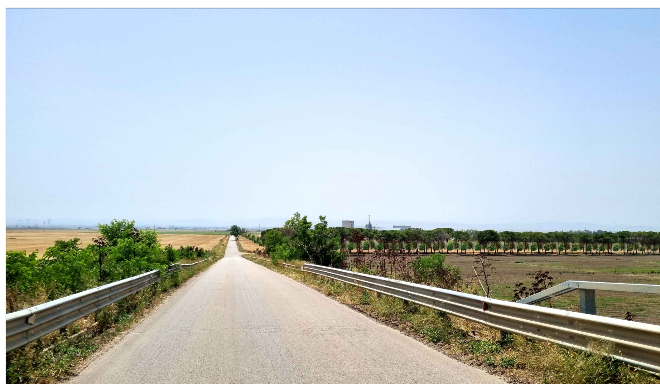
FOTOINSERIMENTO 4 - STATO DI PROGETTO