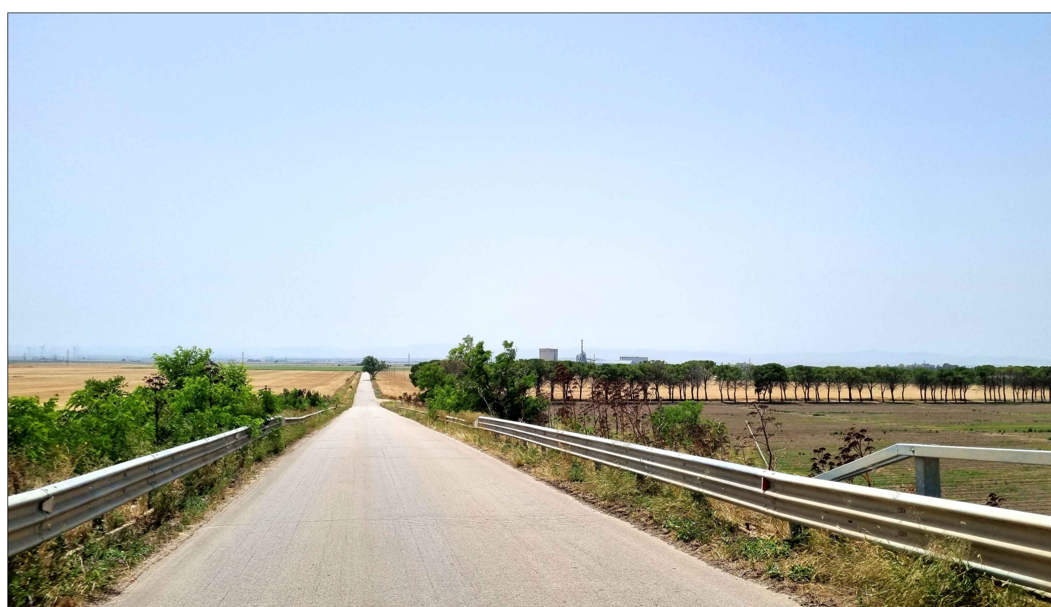
FOTOINSERIMENTO 4 - STATO DI FATTO