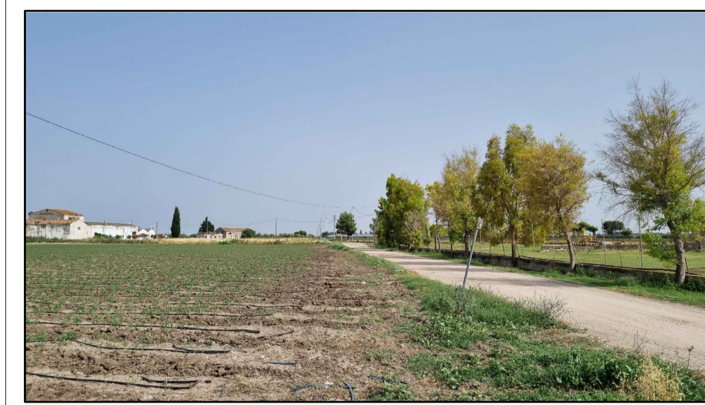
PUNTO DI PRESA FOTOGRAFICA 1