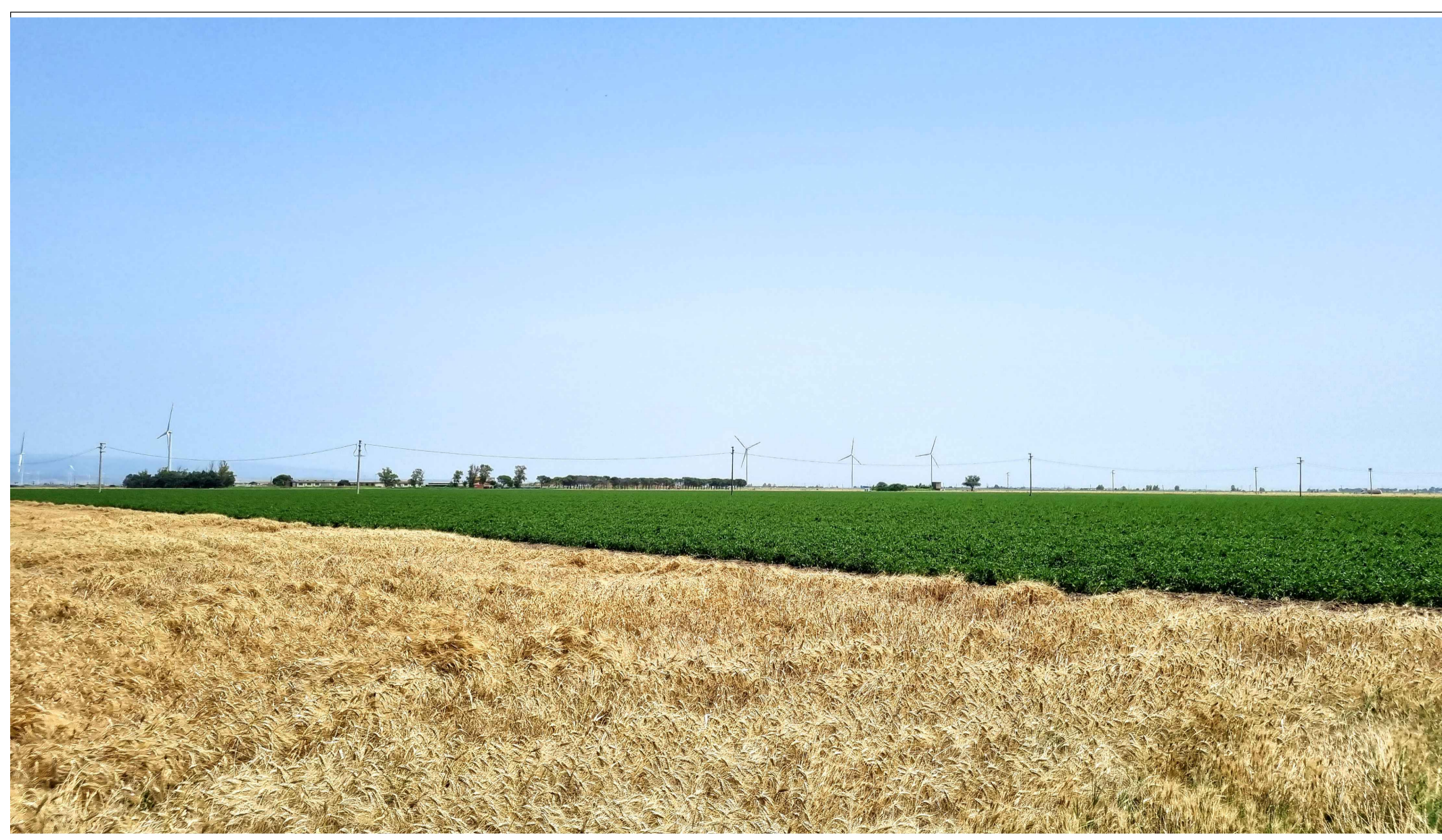
FOTOINSEERIMENTO 8 - STATO DI FATTO