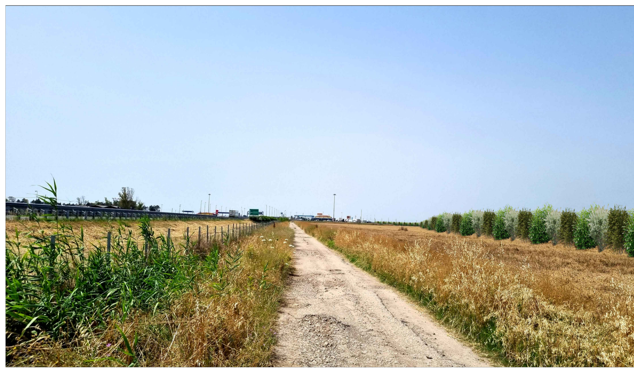
FOTOINSEERIMENTO 7 - STATO DI PROGETTO