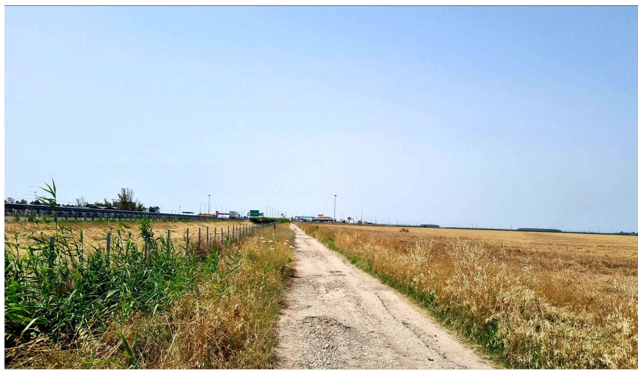
FOTOINSEERIMENTO 7 - STATO DI FATTO