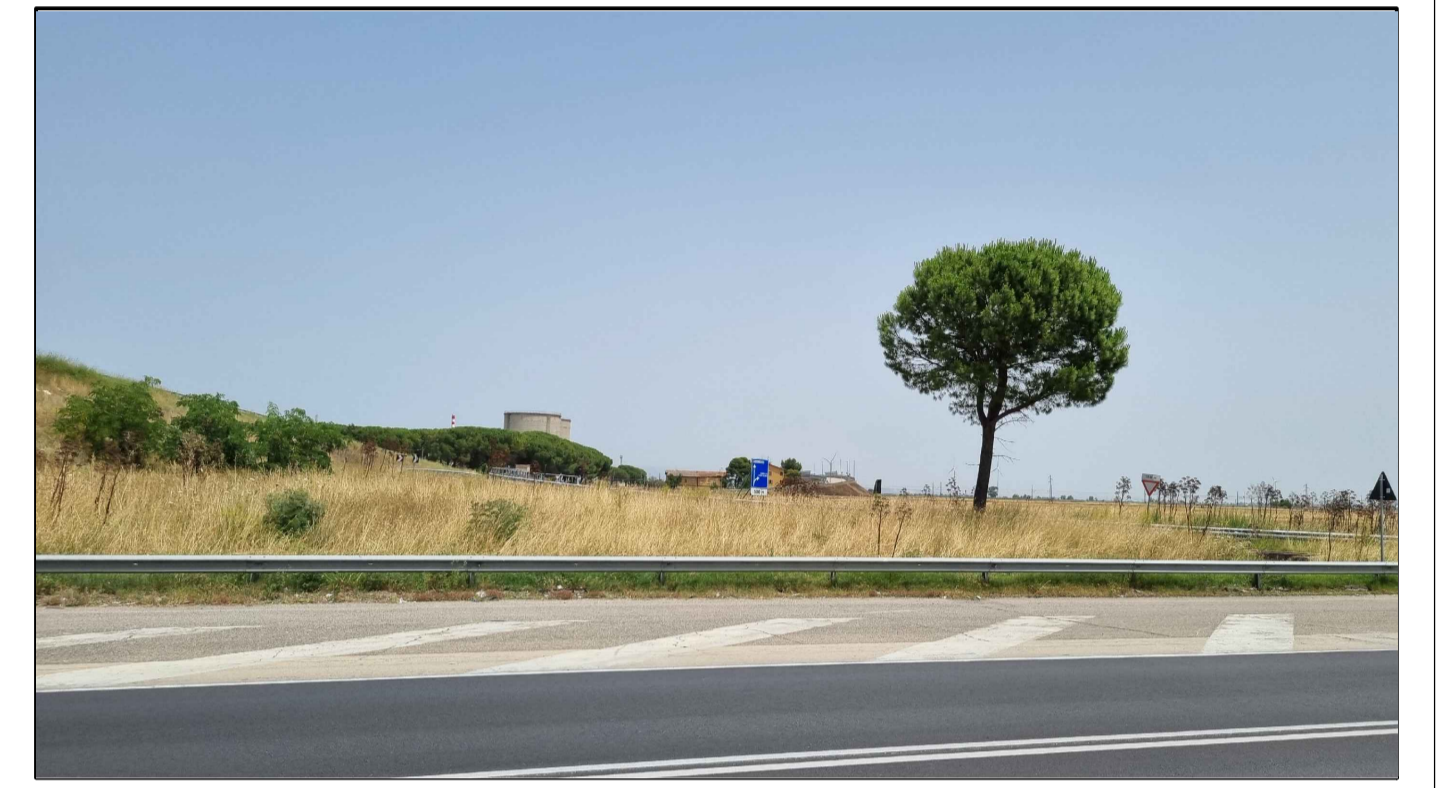
PUNTO DI PRESA FOTOGRAFICA 6