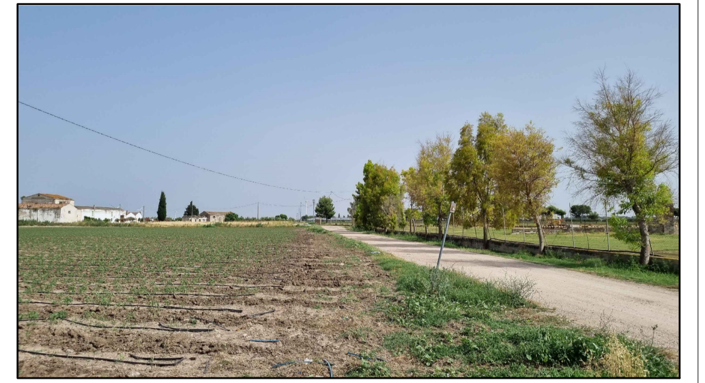
PUNTO DI PRESA FOTOGRAFICA 1