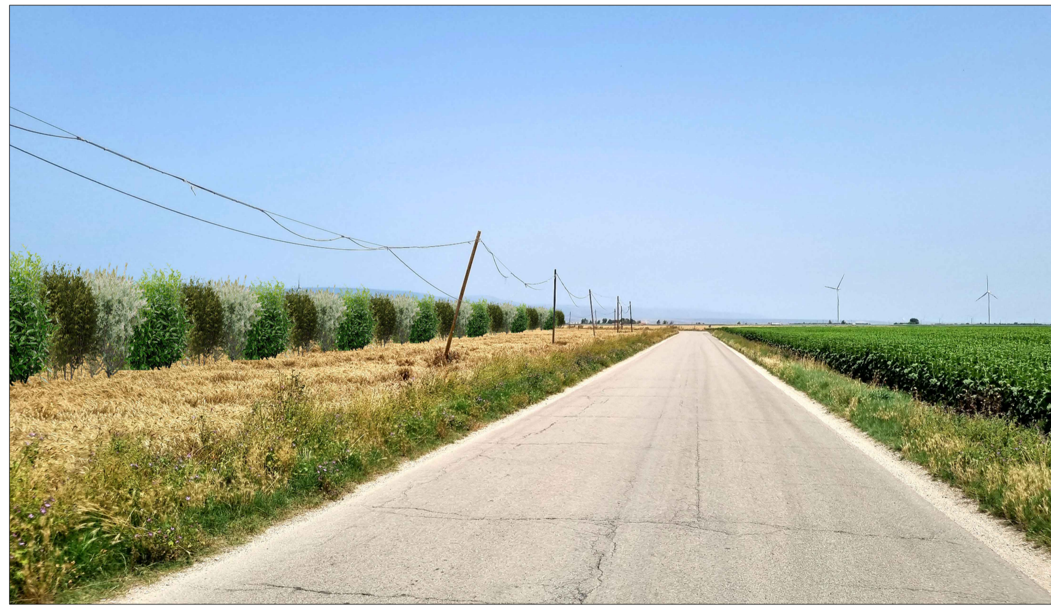
FOTOINSERIMENTO 3 - STATO DI PROGETTO