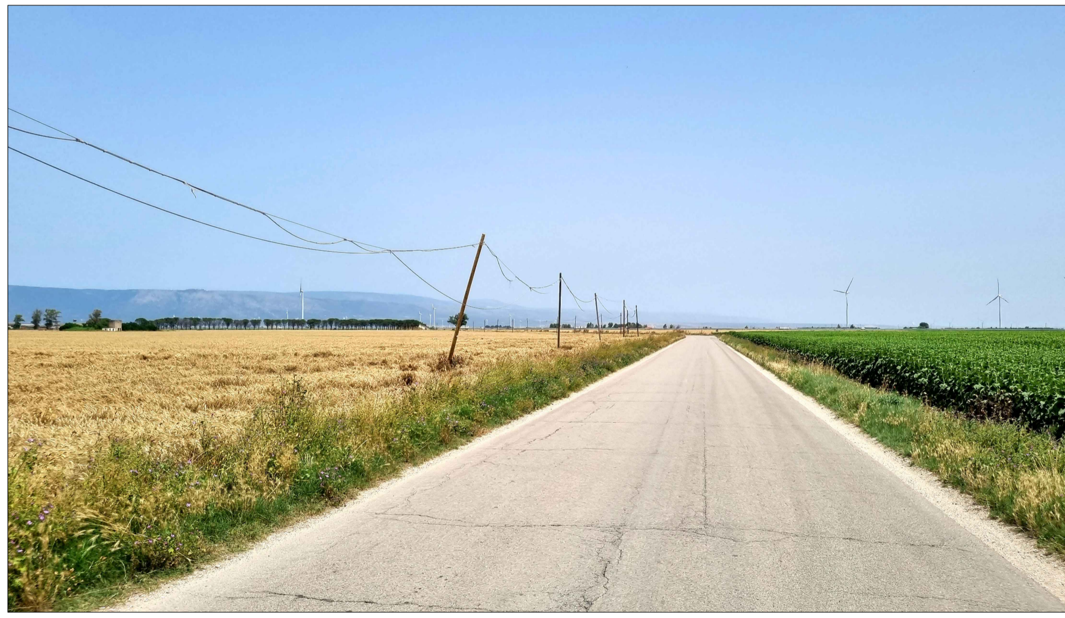
FOTOINSERIMENTO 3 - STATO DI FATTO