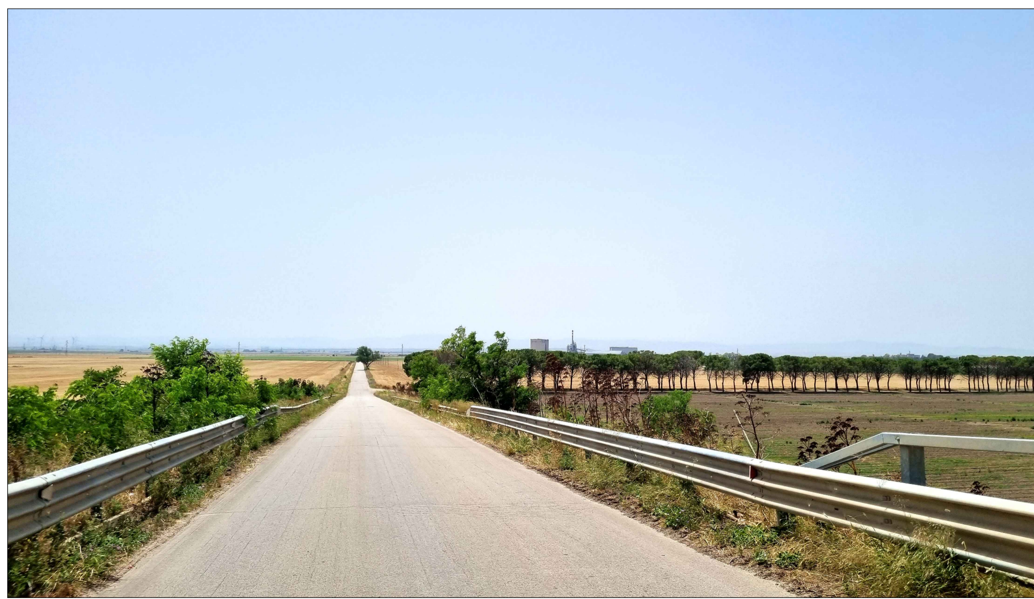
FOTOINSERIMENTO 4 - STATO DI FATTO