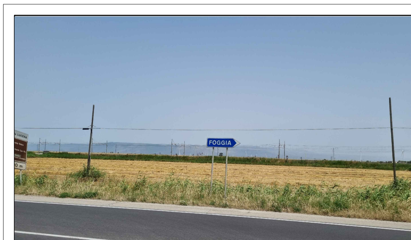
PUNTO DI PRESA FOTOGRAFICA 9