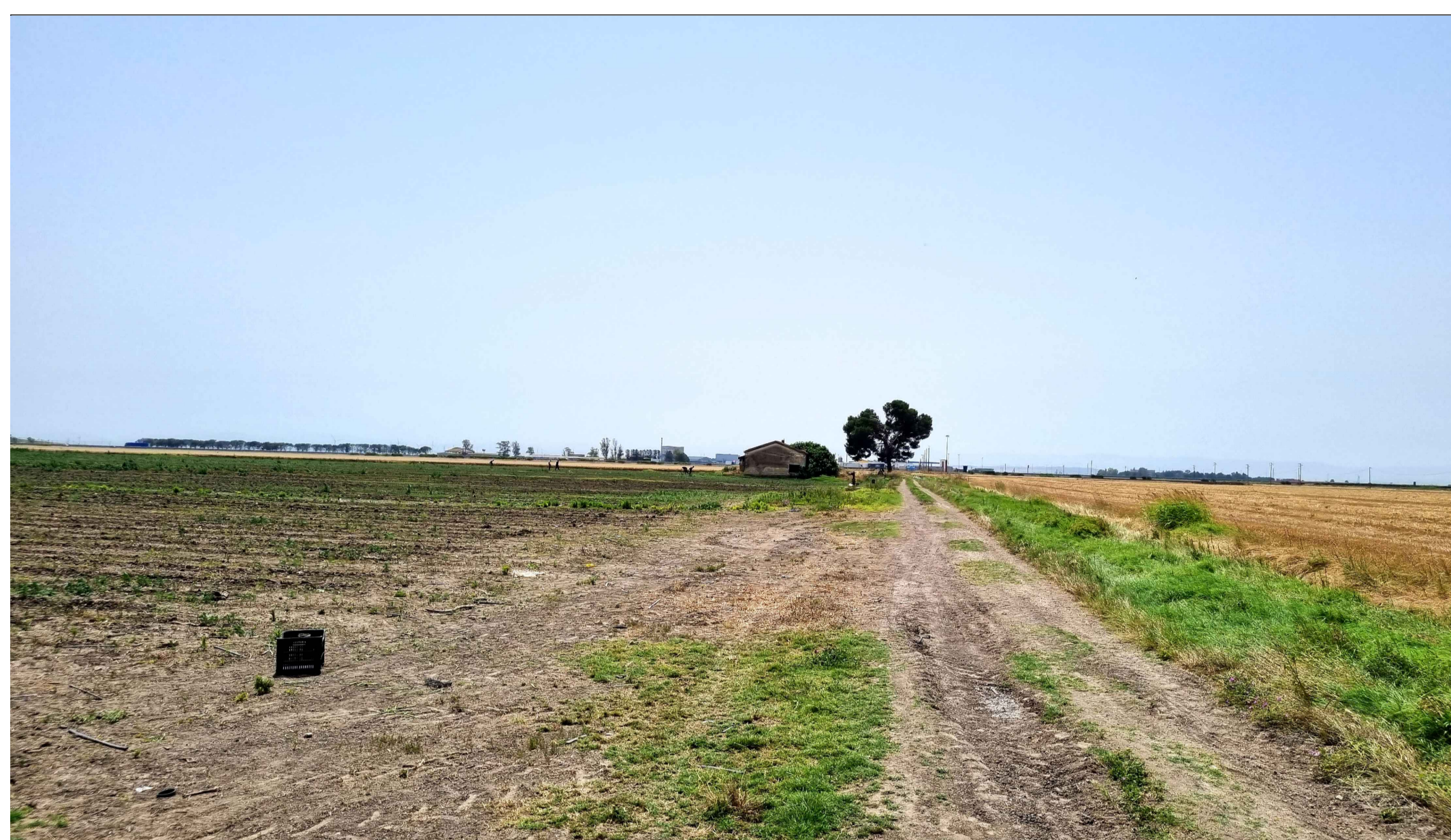
FOTOINSEERIMENTO 5 - STATO DI FATTO