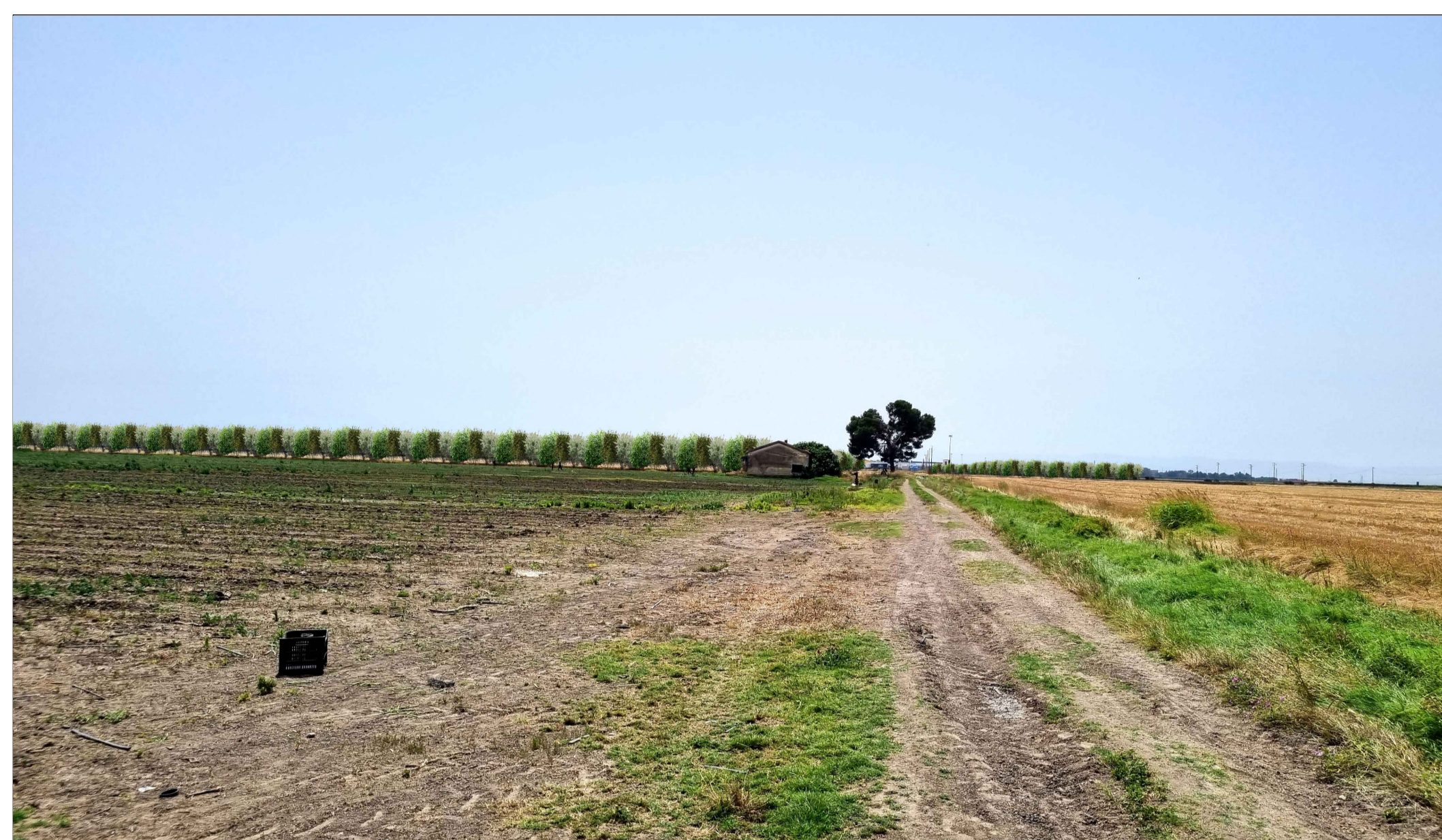
FOTOINSEERIMENTO 5 - STATO DI PROGETTO