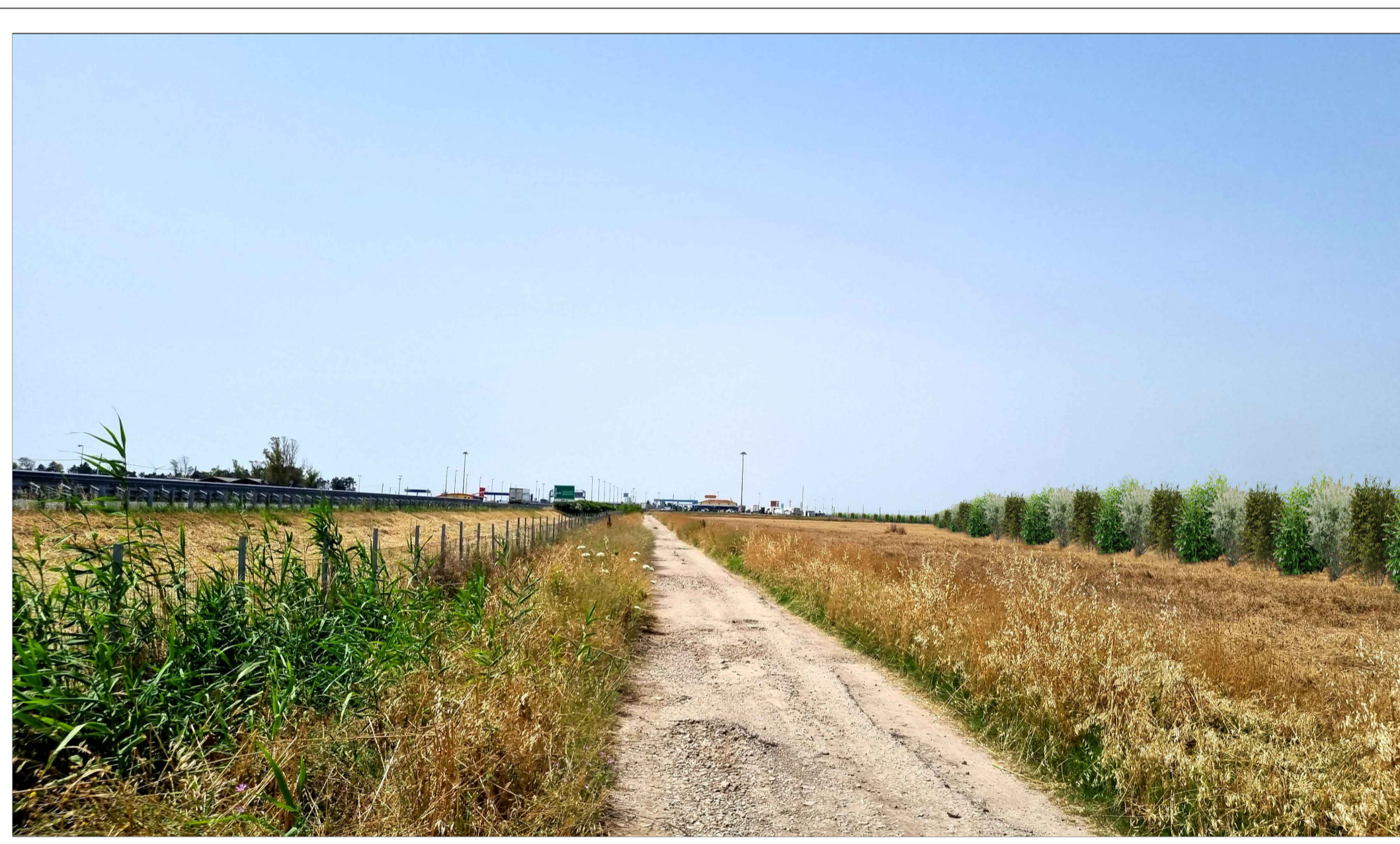
FOTOINSEERIMENTO 7 - STATO DI PROGETTO