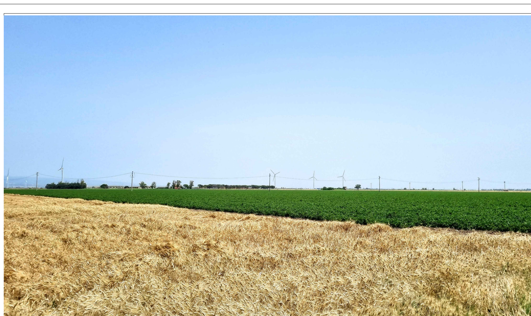
FOTOINSEERIMENTO 8 - STATO DI FATTO