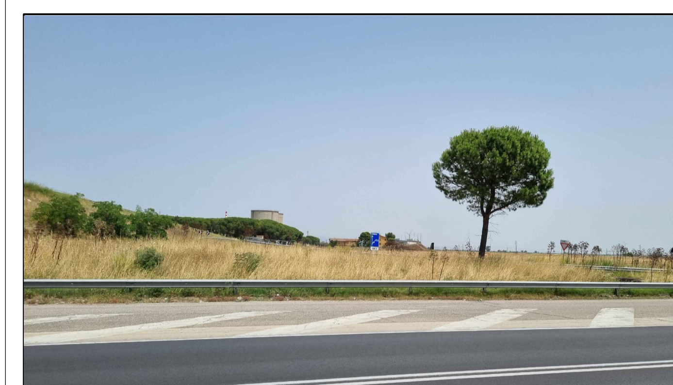
PUNTO DI PRESA FOTOGRAFICA 6