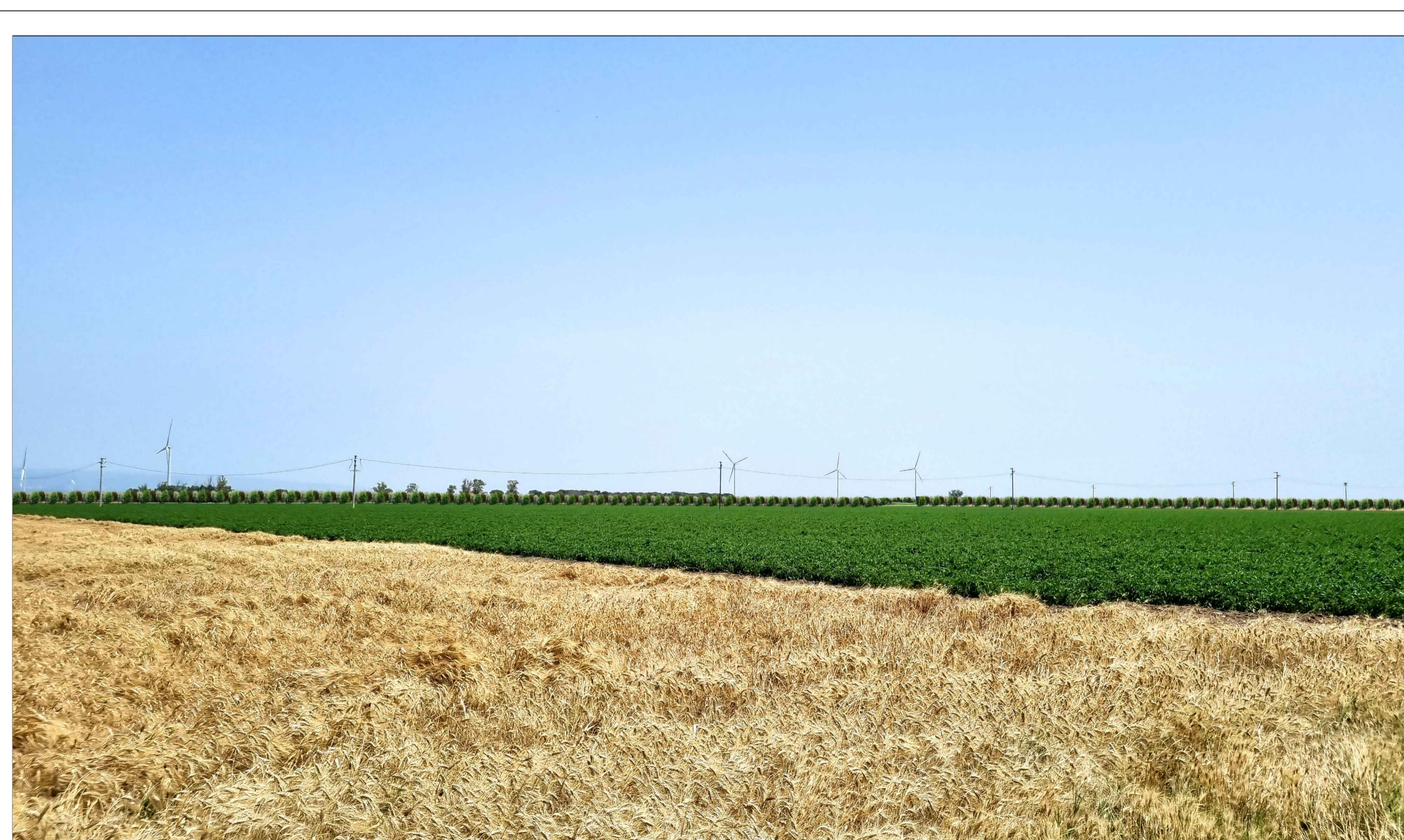
FOTOINSEERIMENTO 8 - STATO DI PROGETTO