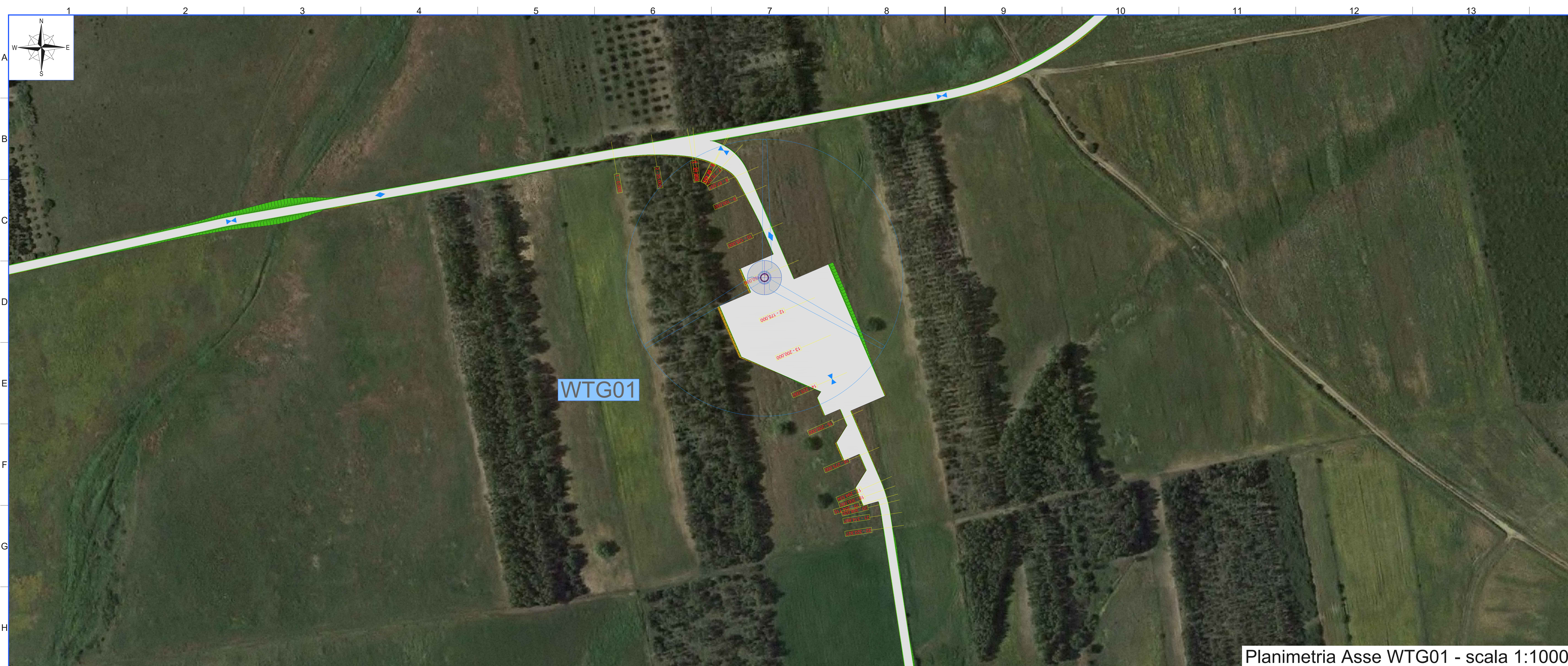
Planimetria Asse WTG01 - scala 1:1000