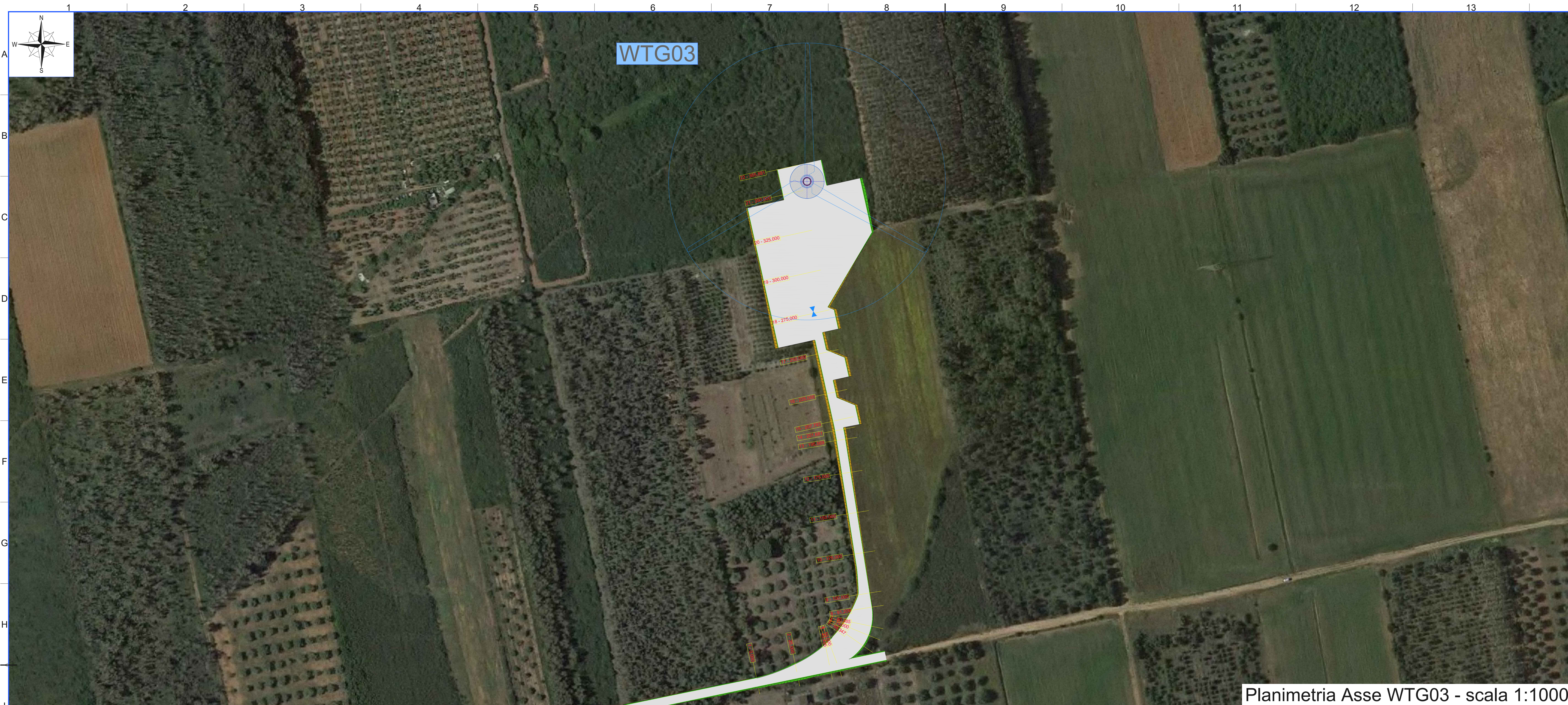
Planimetria Asse WTG03 - scala 1:1000