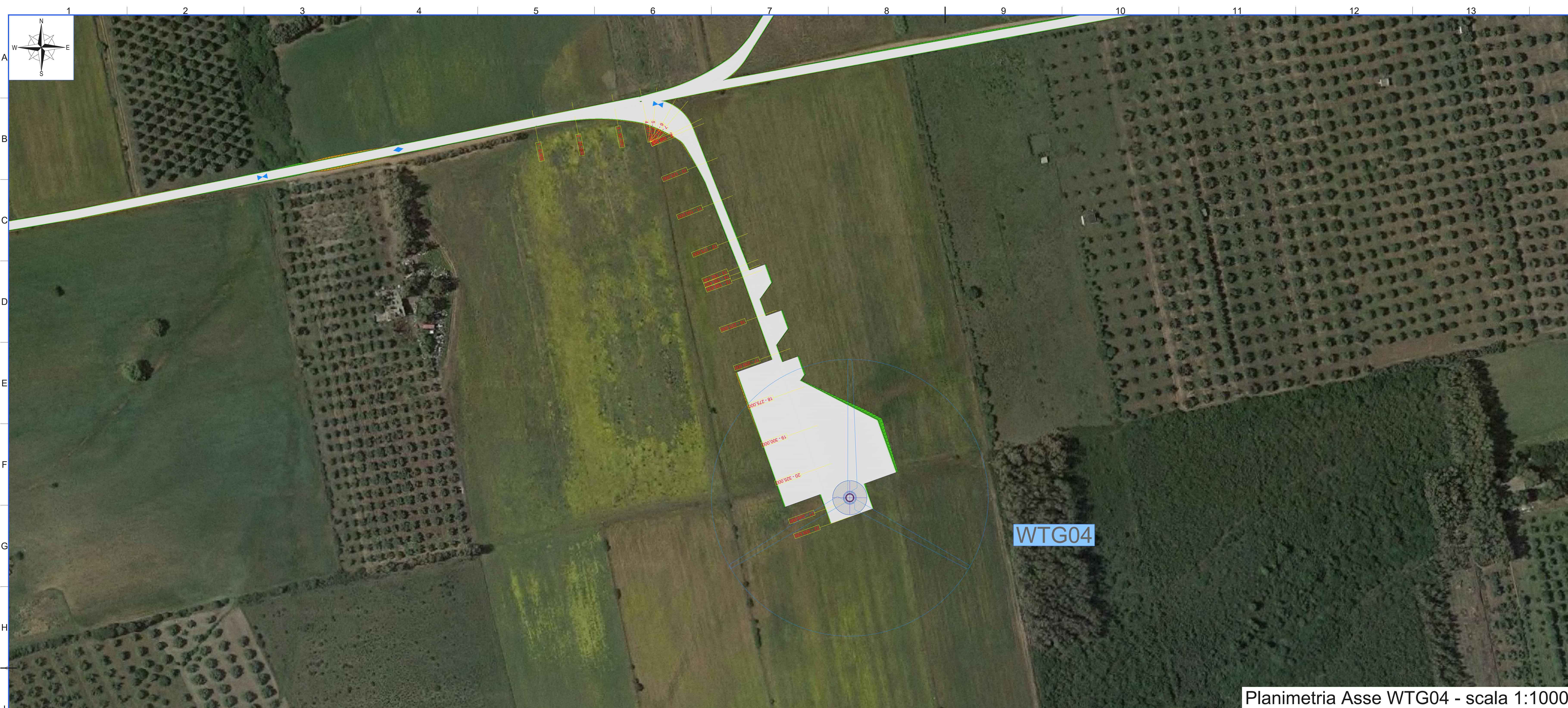
Planimetria Asse WTG04 - scala 1:1000