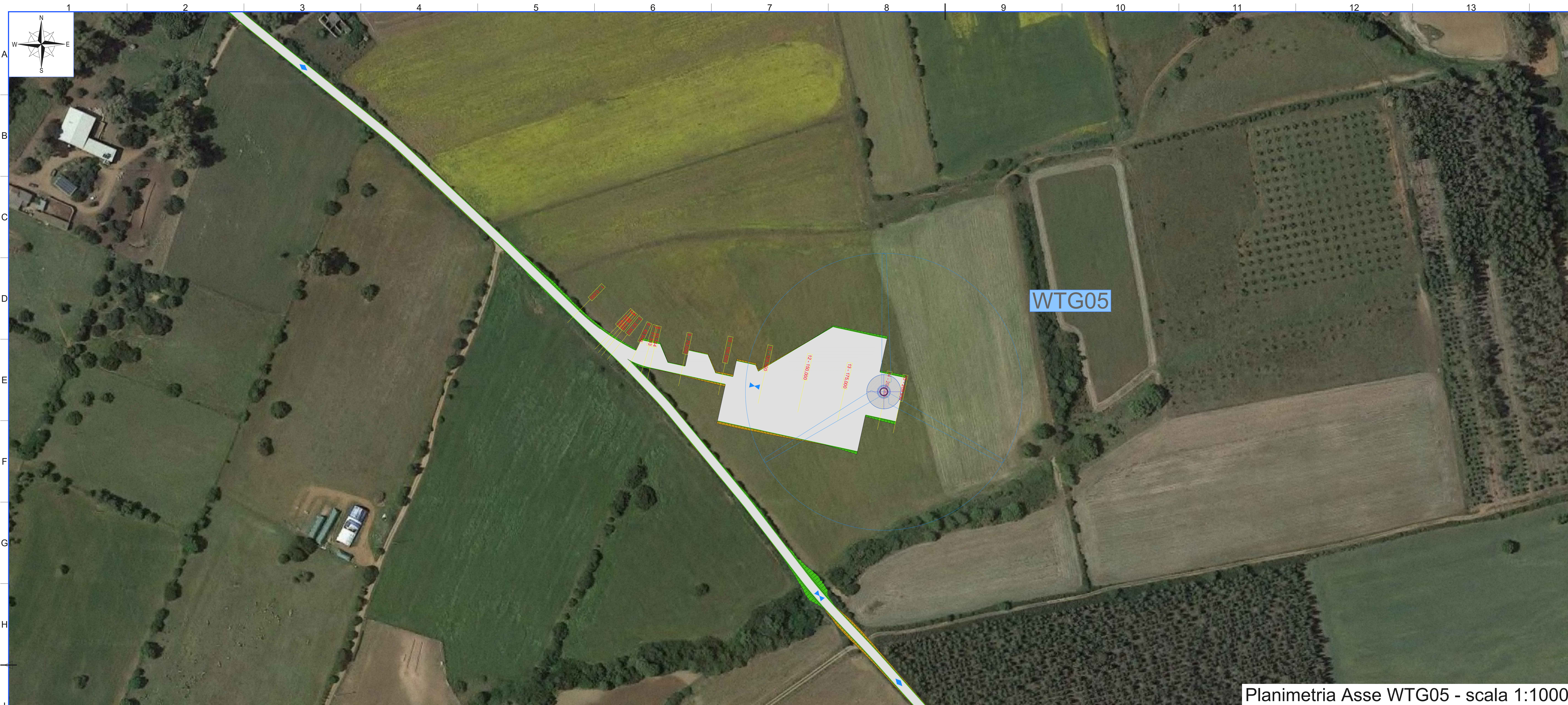
Planimetria Asse WTG05 - scala 1:1000