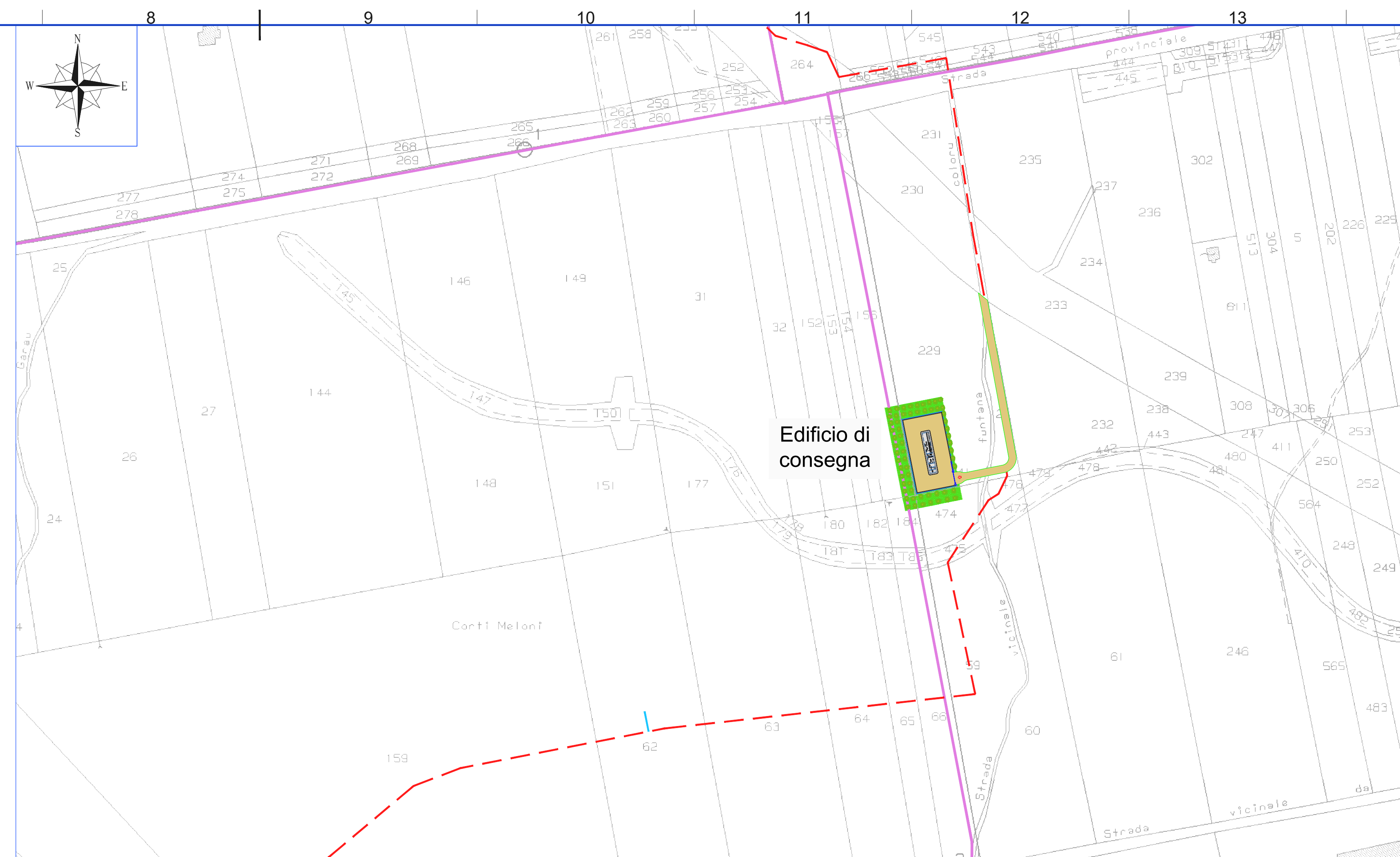
STRALCIO CATASTALE SCALA 1:2.000