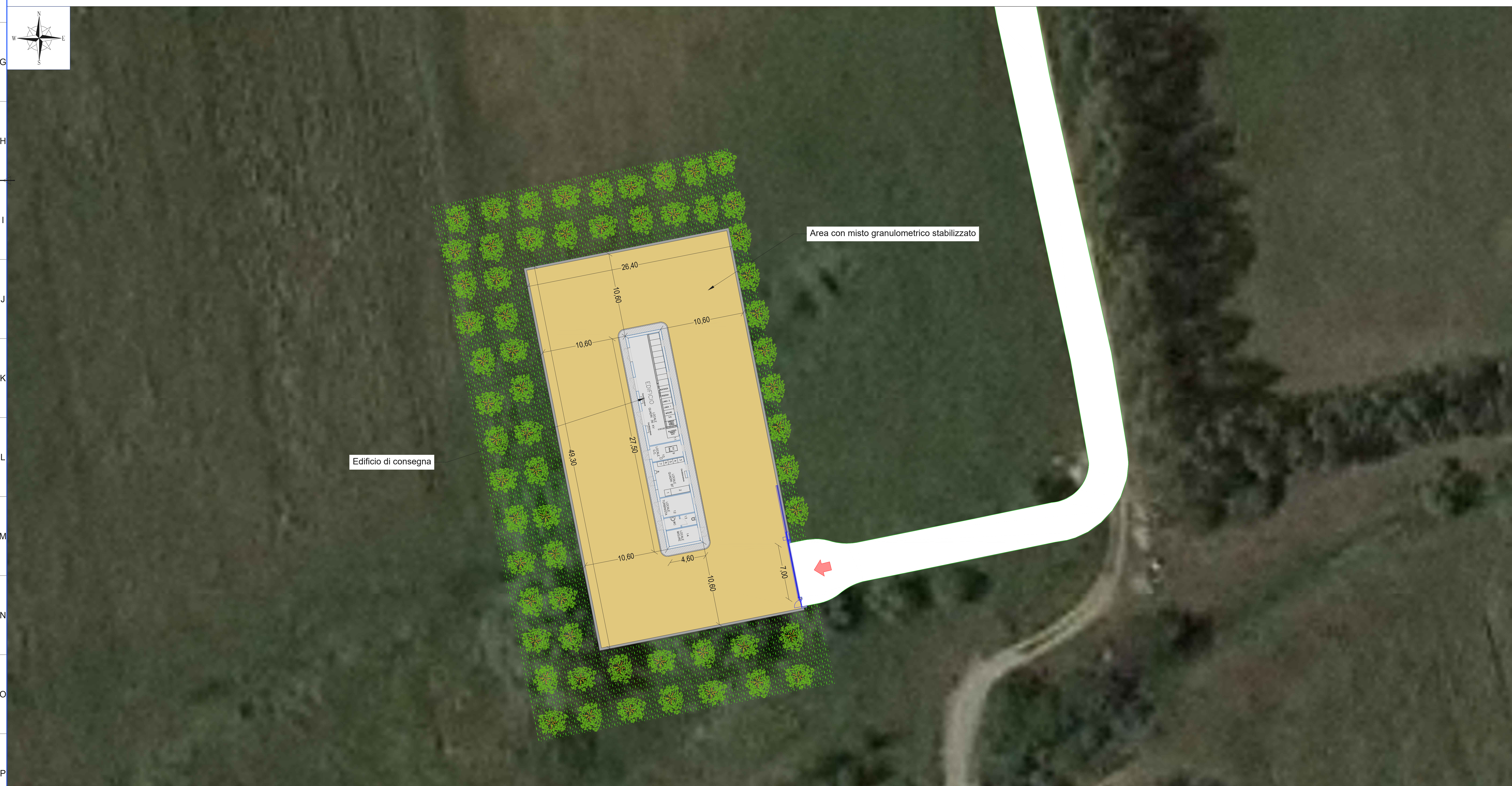
PLANIMETRIA DI PROGETTO SU ORTOFOTO SCALA 1:200

Fonte cartografia di base CTR10k,Catastale2k,Ortofoto0.2k: https://www.sardegnaoportale.it/