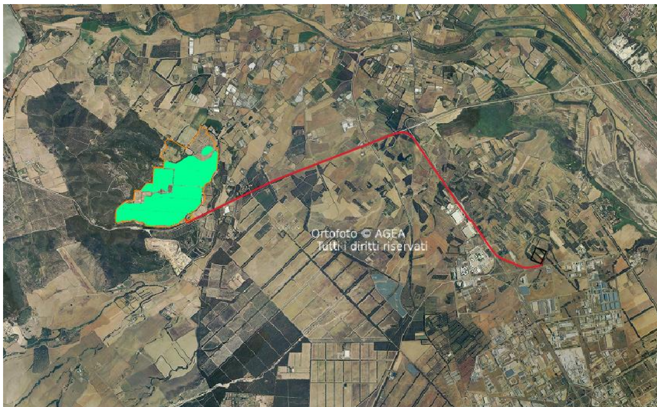
Planimetria Generale di Progetto.

I sostegni che verranno utilizzati saranno pali in profili ad U. La rete metallica per recinzione sarà di tipo "a maglia romboidale" 50 x 50 mm plastificata di colore verde, in filo di ferro zincato, diametro 2 mm, di altezza circa 2 m ancorata a pali di sostegno in profilato metallico con sezione U (o eventualmente a T) in acciaio zincato di dimensioni 80x60 mm. I pali, alti 2,1 m, verranno conficcati nel terreno per una profondità pari 0,8 m e controventati con paletti in ferro zincato della stessa sezione, posti ad interasse non superiore a 3 m. Questi presenteranno giunti di fissaggio laterale della rete sul palo e giunti in metallo per il fissaggio di angoli retti e ottusi. La recinzione lungo il confine con i lotti adiacenti verrà inoltre posizionata ad un'altezza da terra di circa 10 cm, al fine di permettere alla piccola fauna presente nella zona di utilizzare l'area di impianto, mentre lungo i fronti stradali saranno previsti dei ponti ecologici consistenti in cunicoli delle dimensioni di 100x20 cm sotto la rete metallica. I cancelli (pedonali e carrabili) saranno realizzati in tubolari di acciaio e rete elettrosaldata, agganciati a profili tubolari quadrati in acciaio di dimensioni 10x10 cm ancorati al suolo tramite blocchi di fondazione in cls di dimensioni 50x50x50 cm su magrone di sottofondazione di spessore 10 cm, saranno completi di guida di scorrimento fissa e serratura.