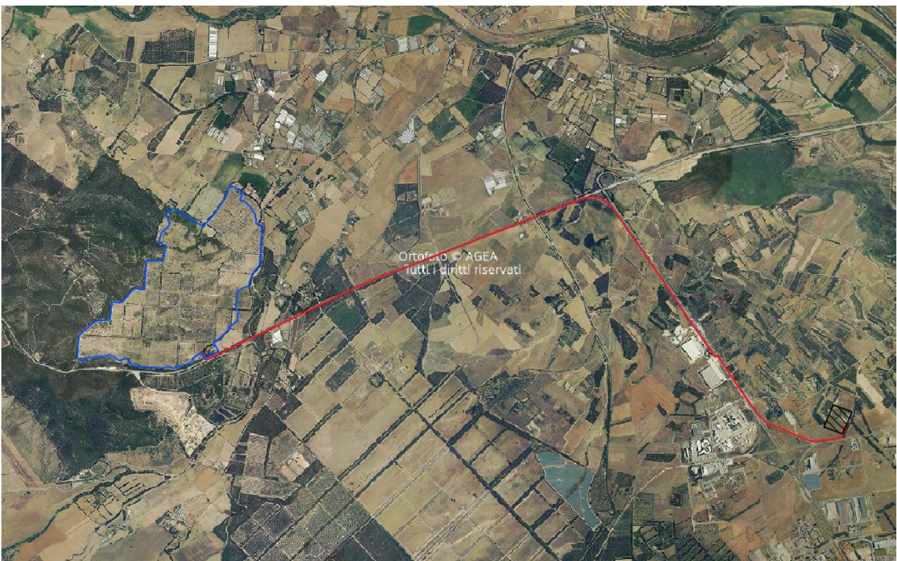
Inquadramento delle aree di progetto su OFC.

I lotti in cui verrà realizzato l'impianto sono individuati dal Piano Urbanistico Comunale di Uta come zona F-turistico-collinare