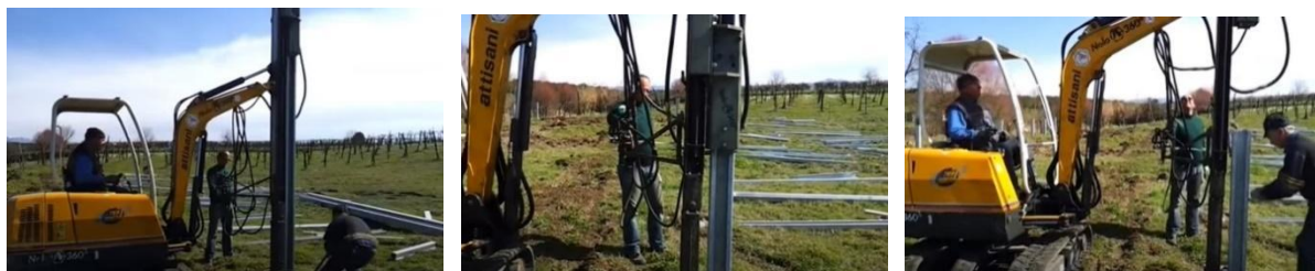
Sequenza fotografica che mostra l'infissione eseguita con battipalo di pali in acciaio ad omega per pannelli fotovoltaici.

Si riporta in maniera esemplificativa una sequenza di poche immagini che mostrano quanto descritto.