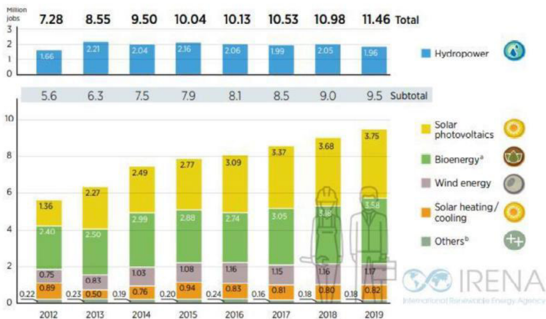
Figura1: Dati occupazionali nel settore rinnovabile negli ultimi anni