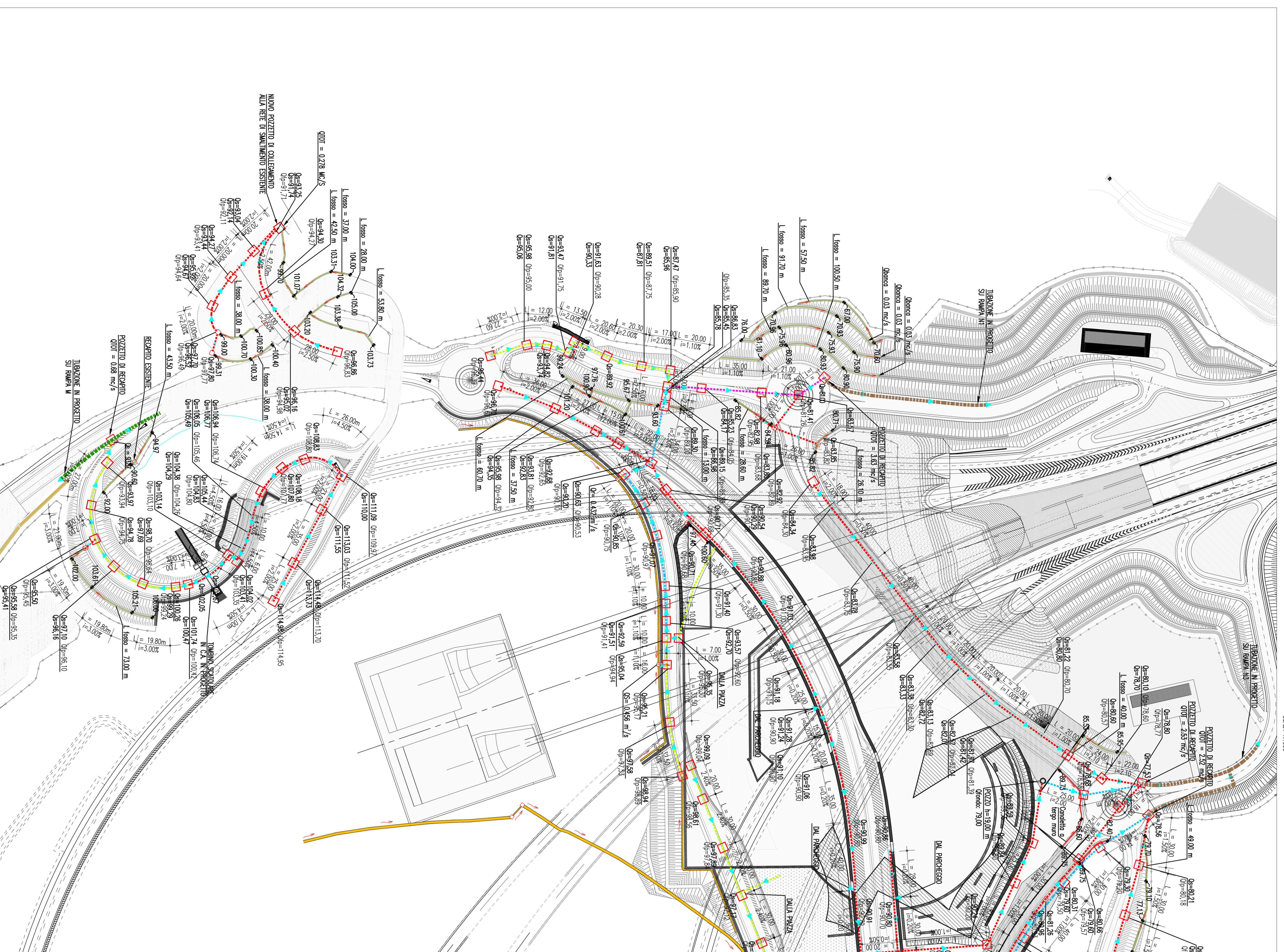
PLANNIMETRA GENERALE DI REALIZZAZIONE