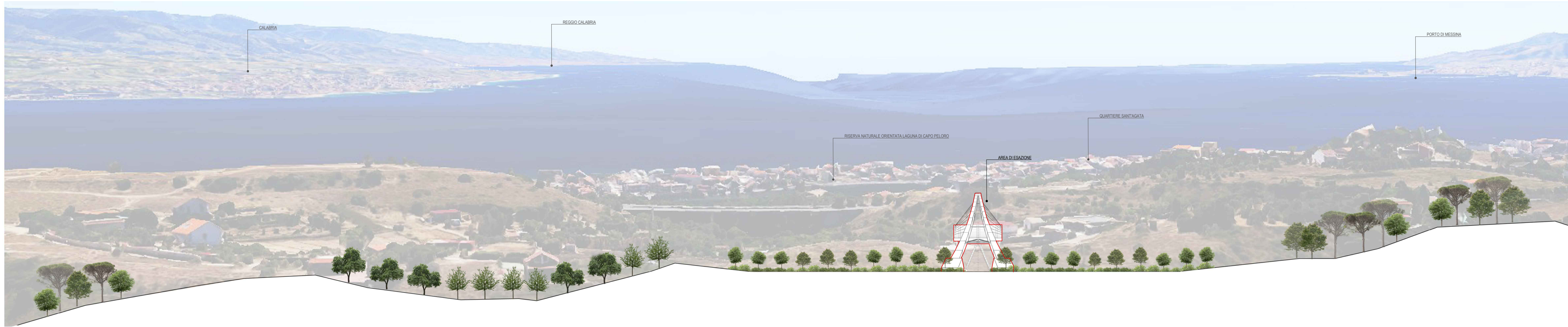
01 SEZIONE CC 1:500