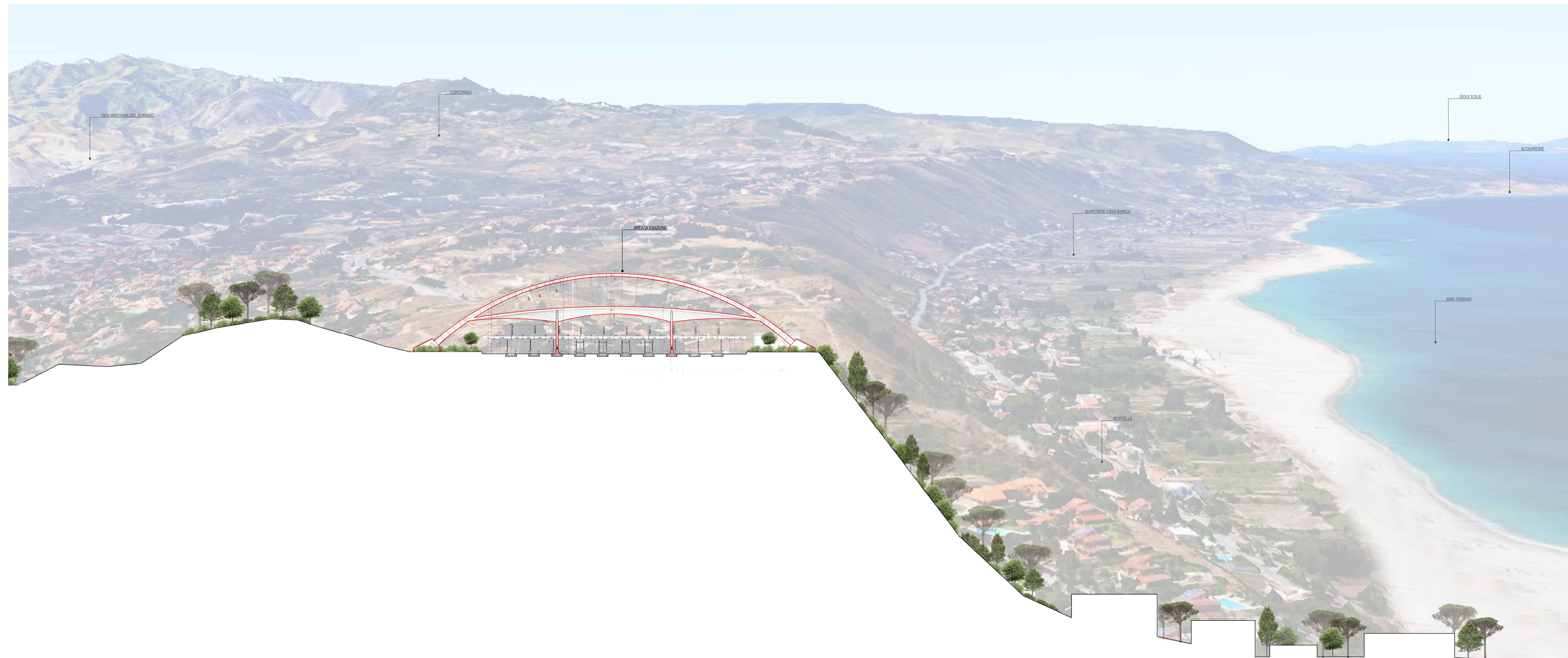
02 SEZIONE DD 1:500