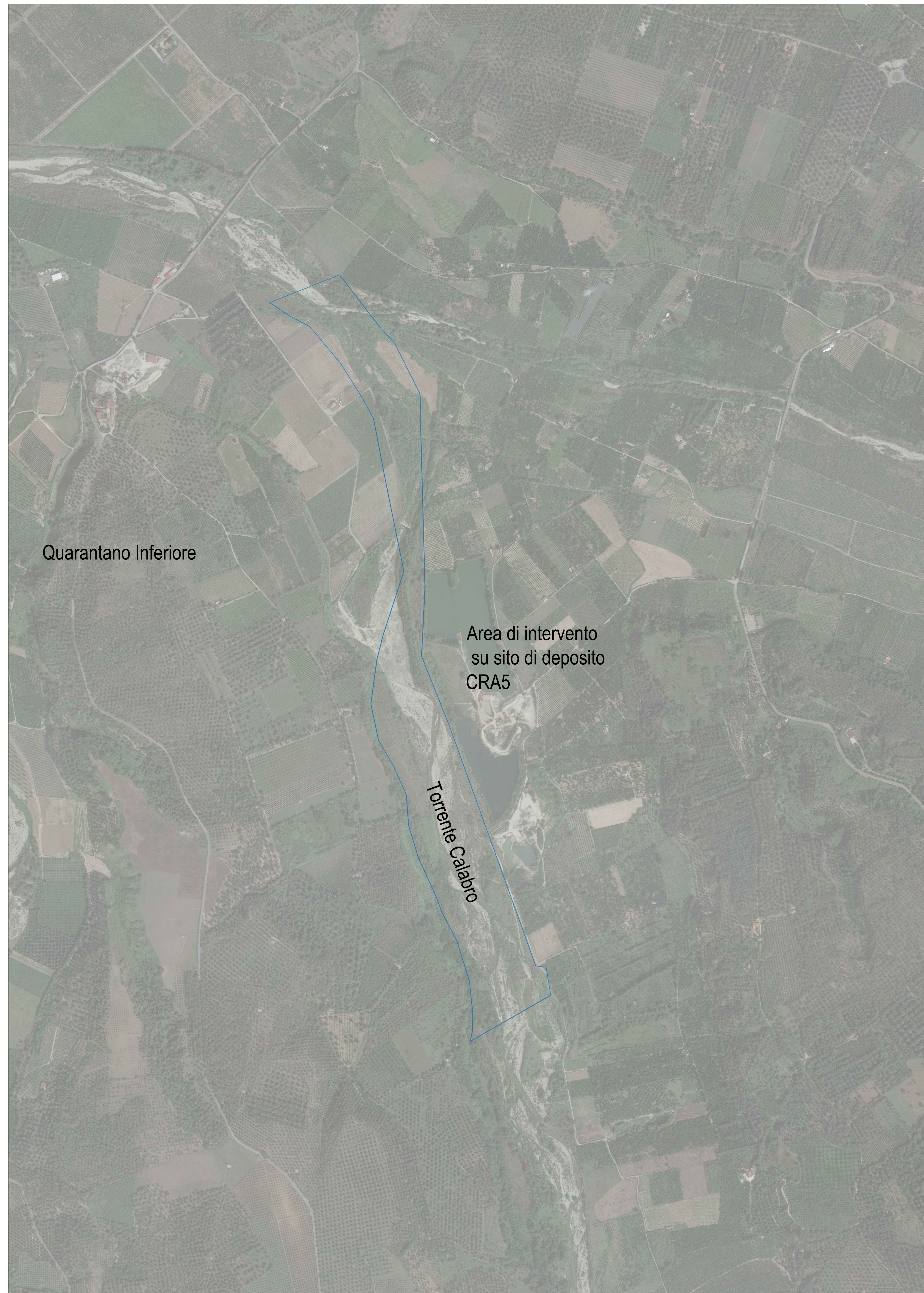
CGI2 - Area di gestione del rischio idrogeologico