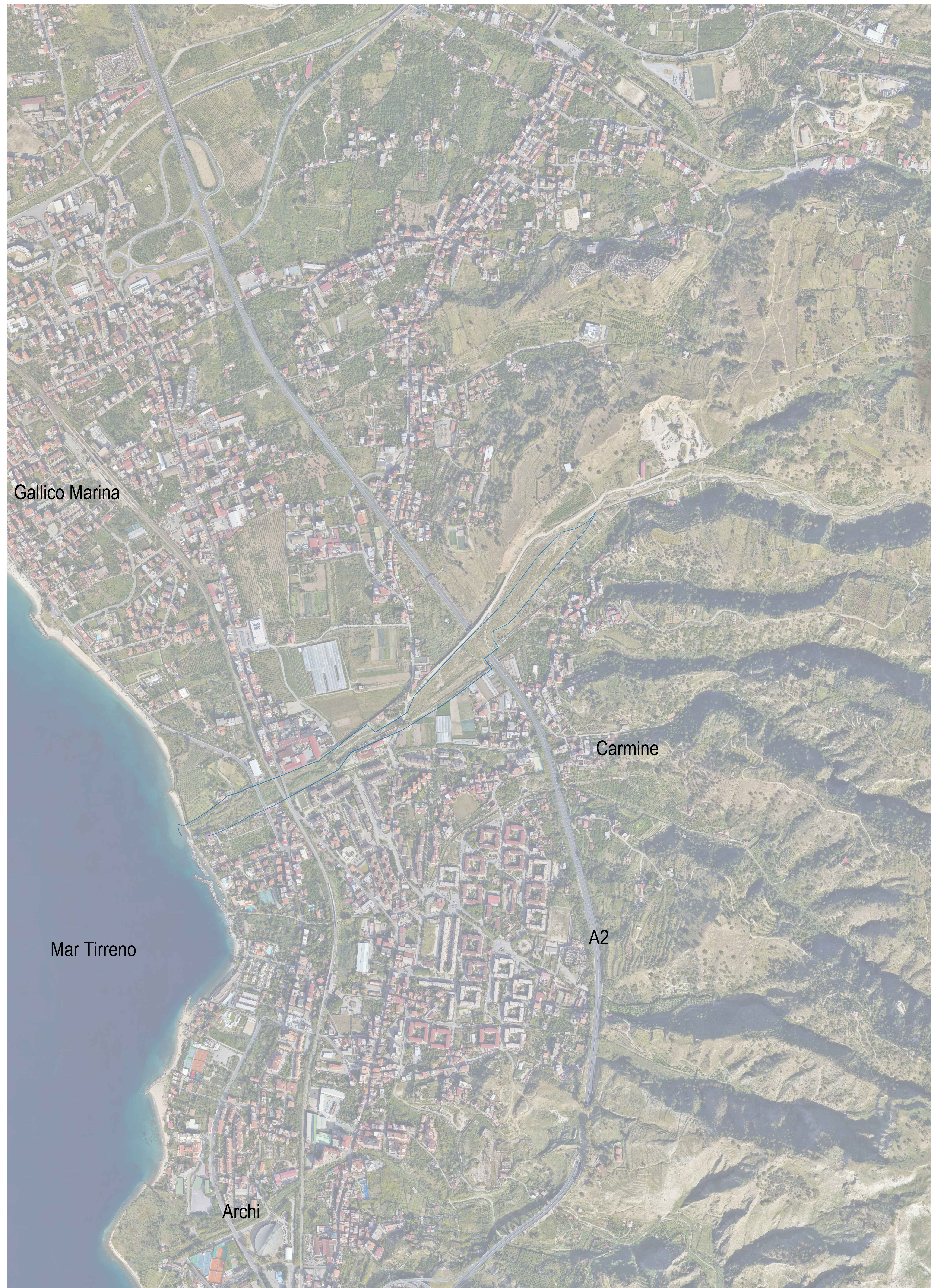
CGI1 - Area di gestione del rischio idrogeologico