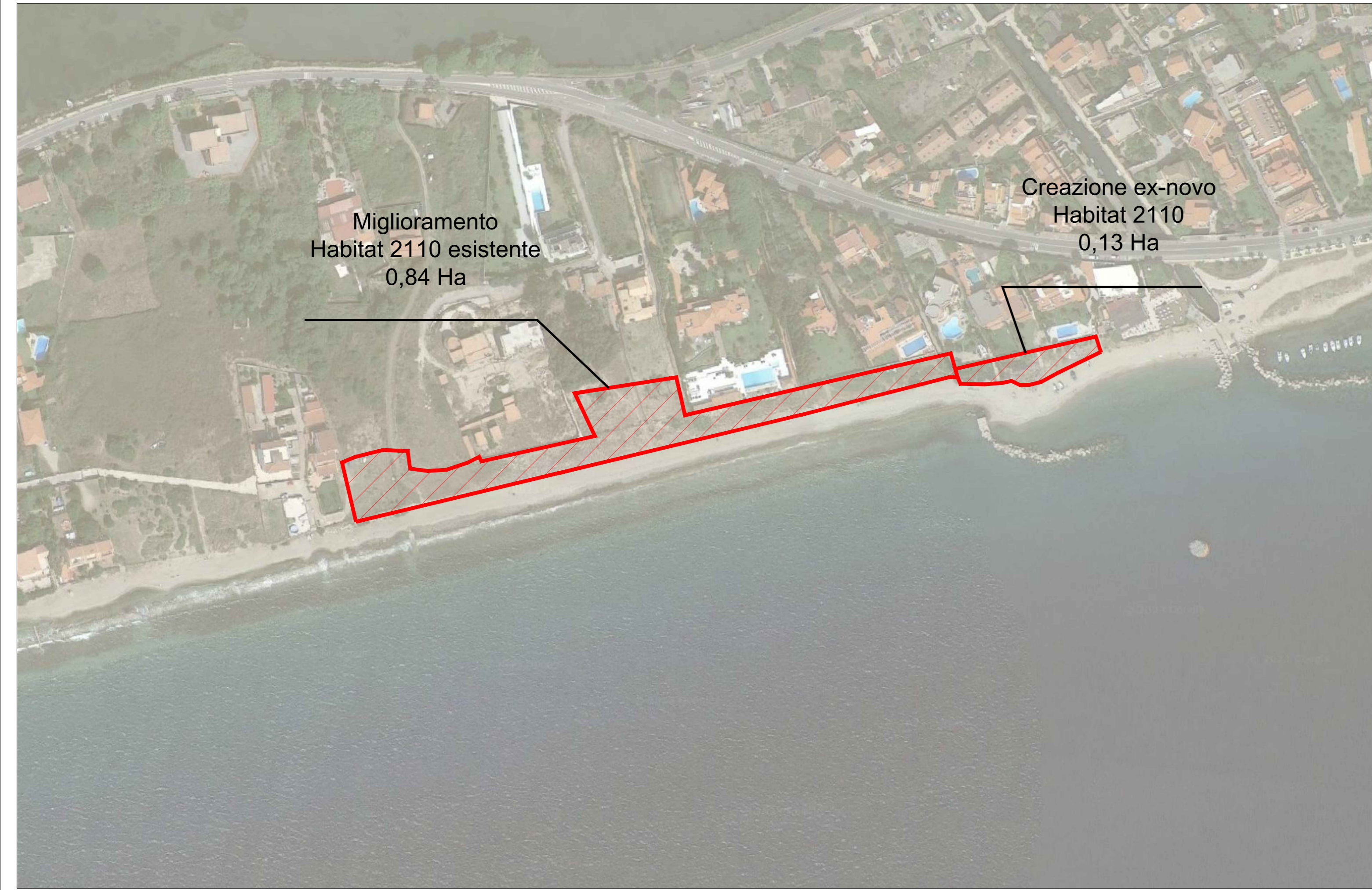
HAB01 - Interventi di compensazione ambientale per perdita di Habitat 2110