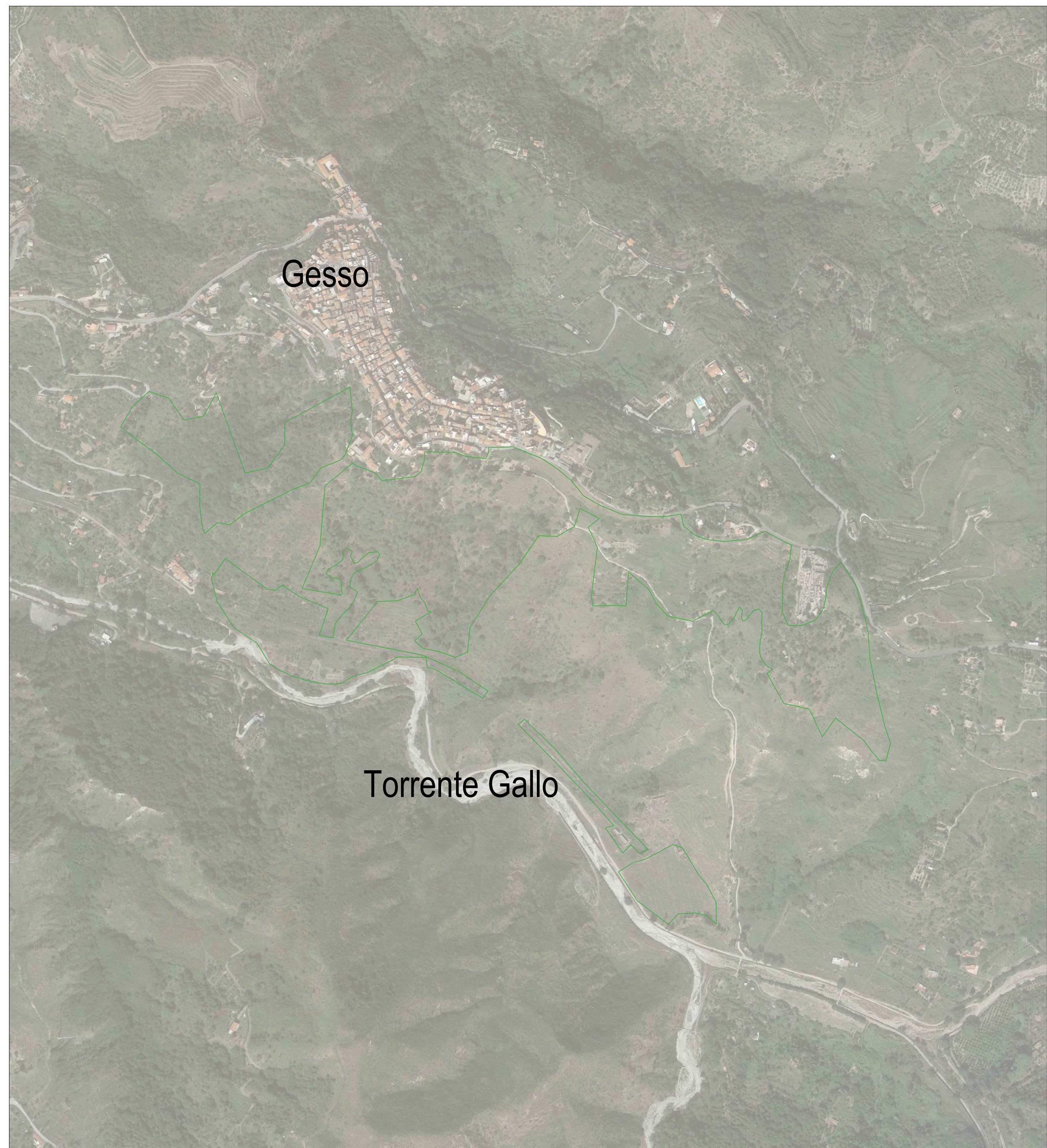
SF15 - Area di riforestazione su zona segnata da incendi