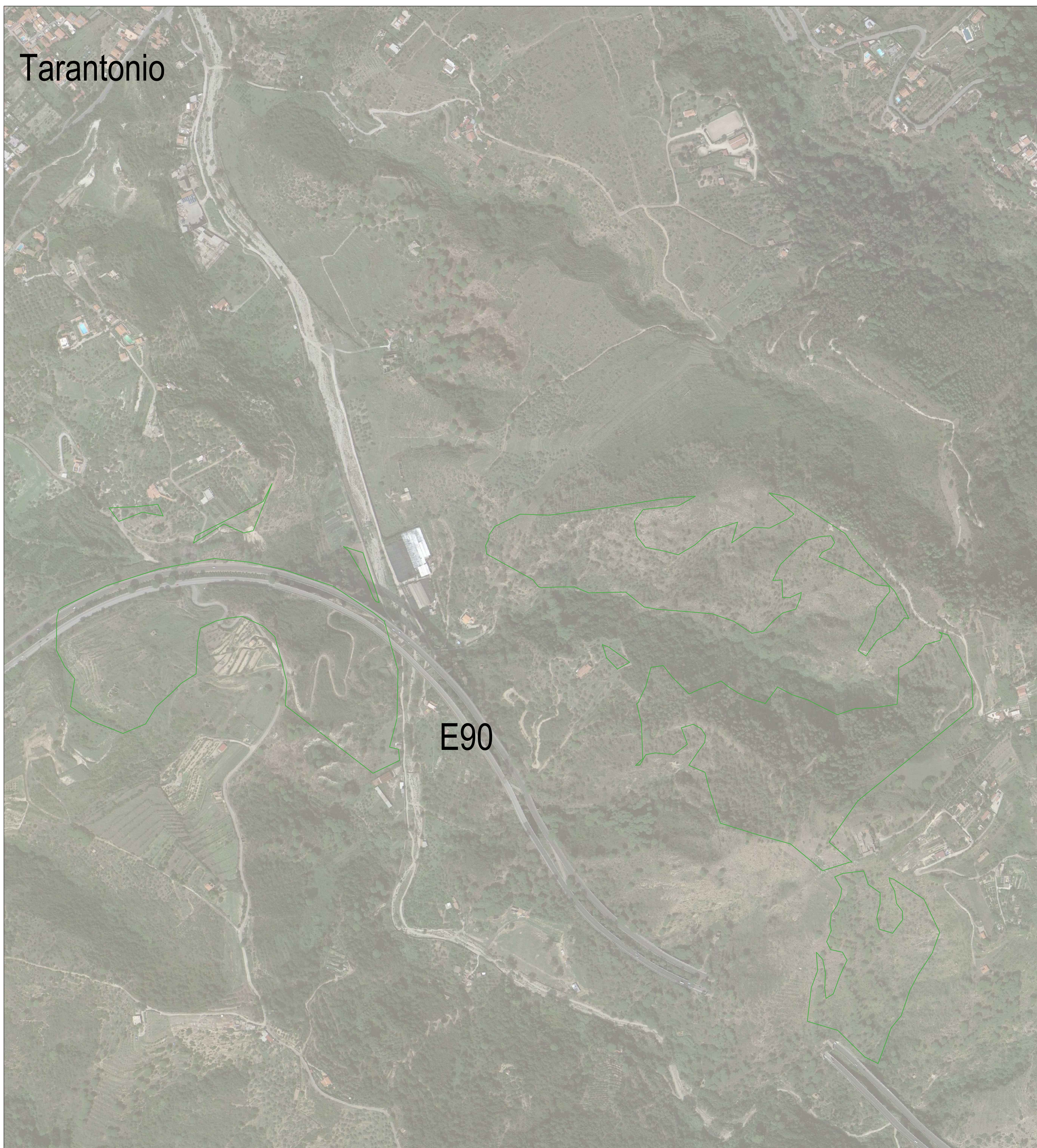
SF14 - Area di riforestazione su zona segnata da incendi