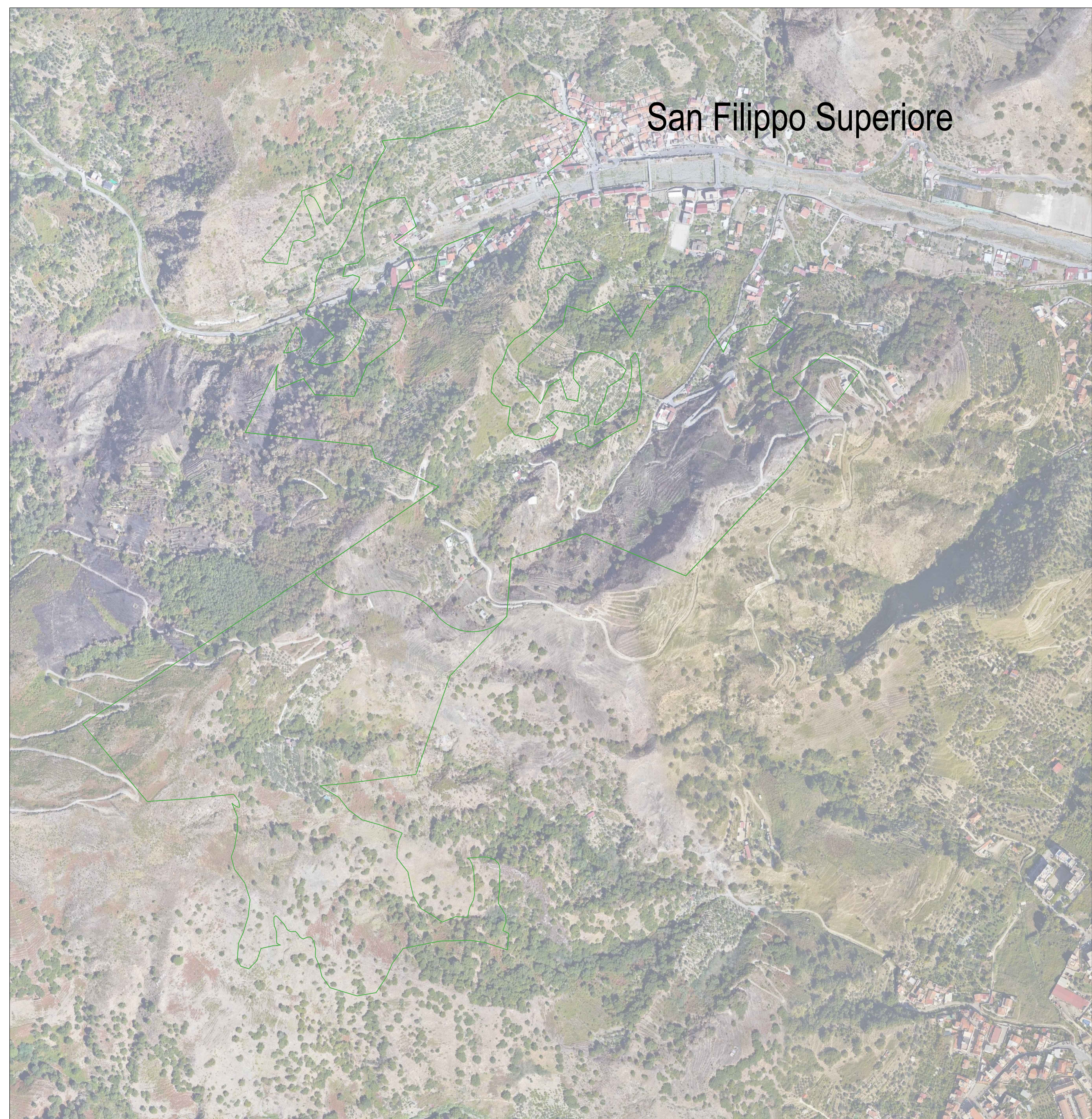
SF12 - Area di riforestazione su zona segnata da incendi