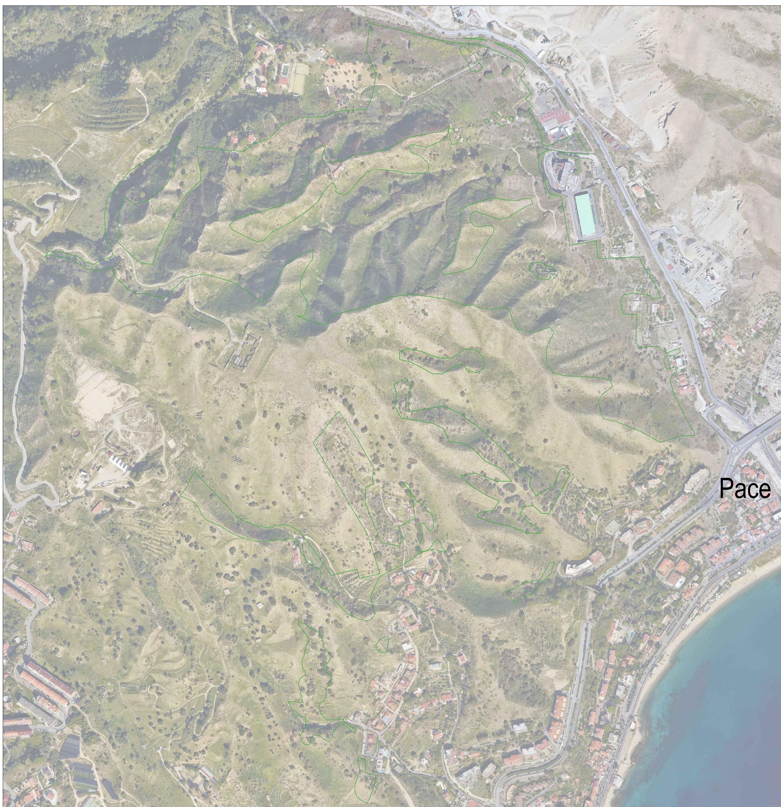
SF11 - Area di riforestazione su zona segnata da incendi