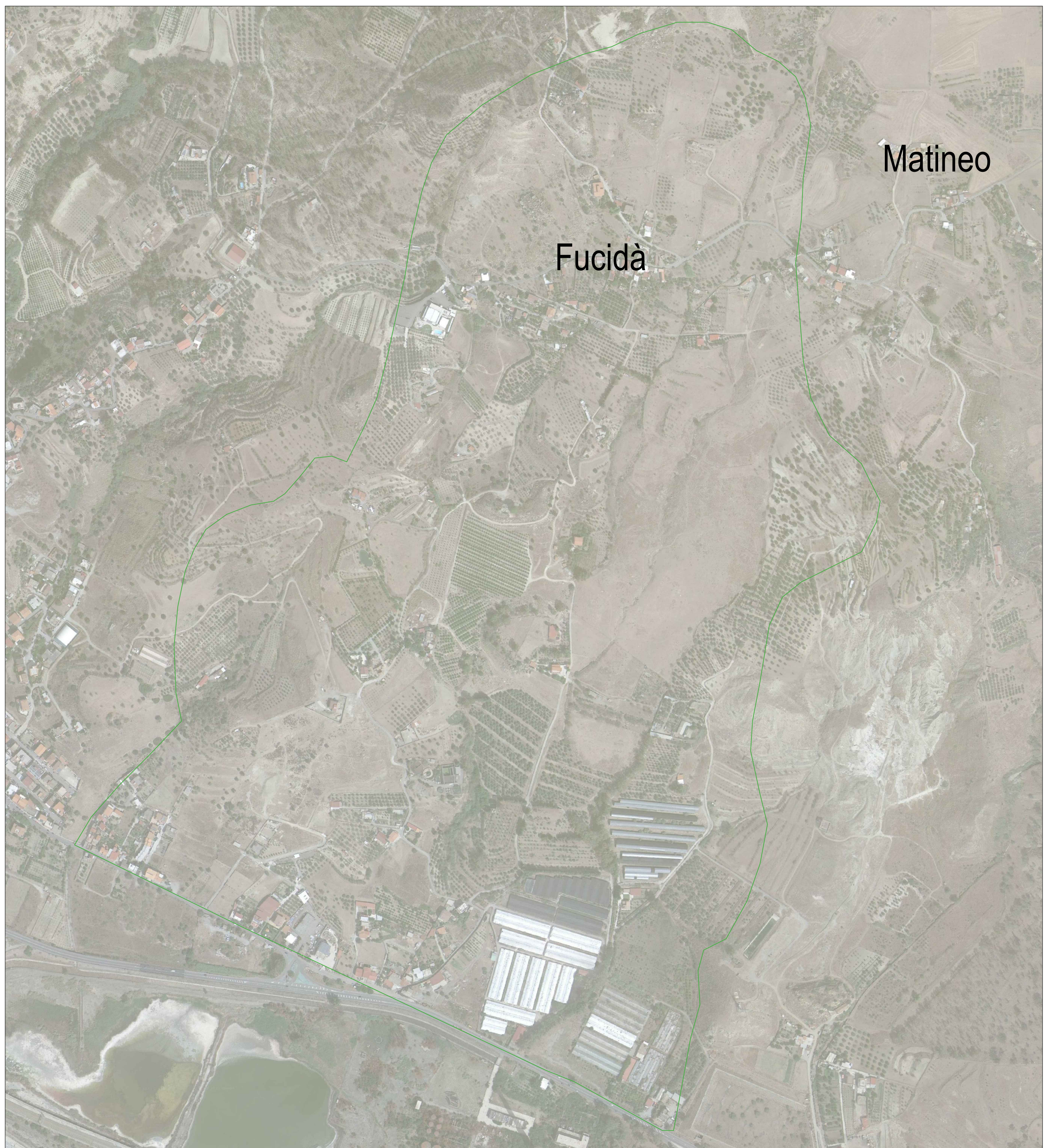
CF11 - Area di riforestazione su zona segnata da incendi