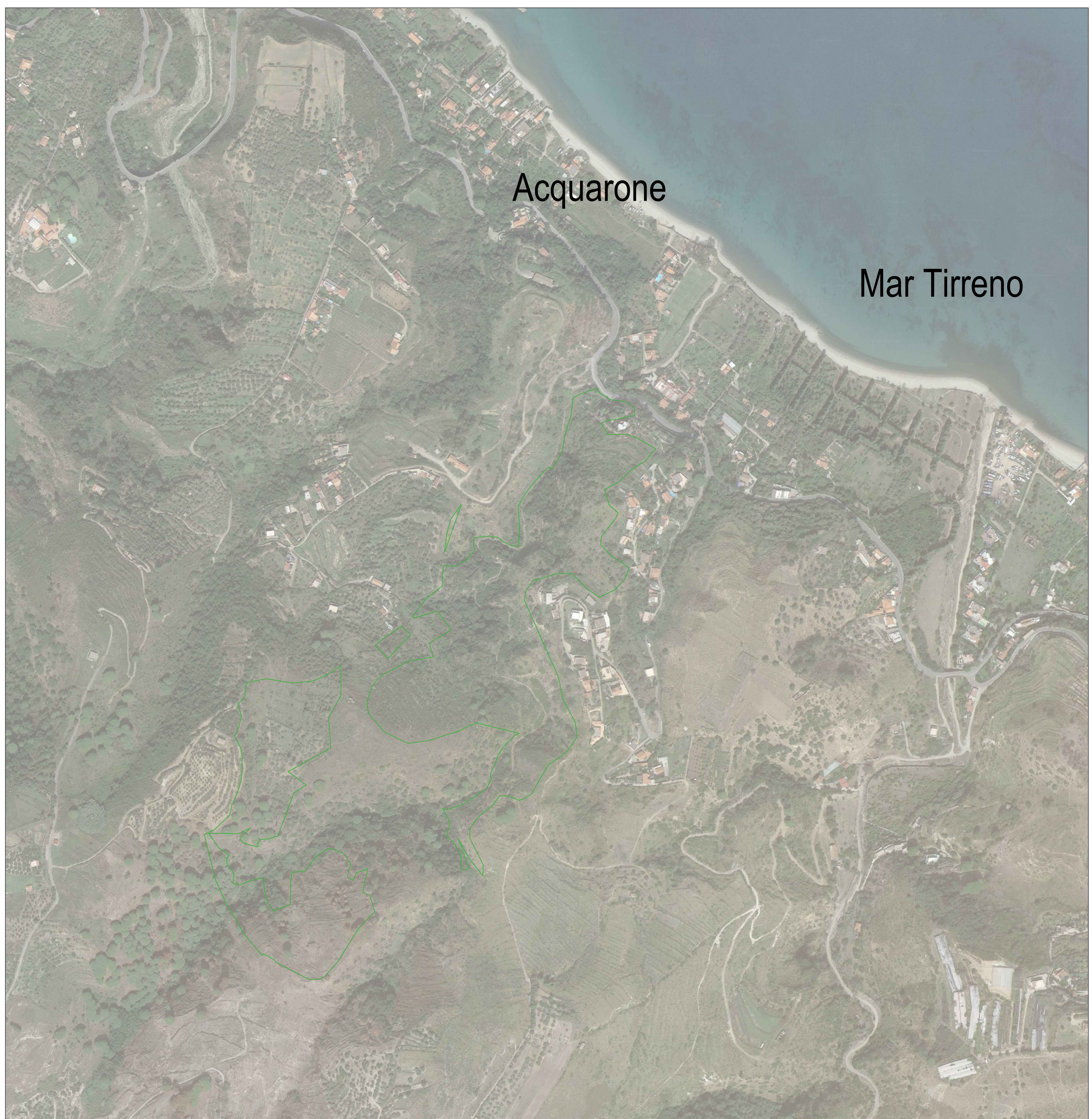
SF13 - Area di riforestazione su zona segnata da incendi