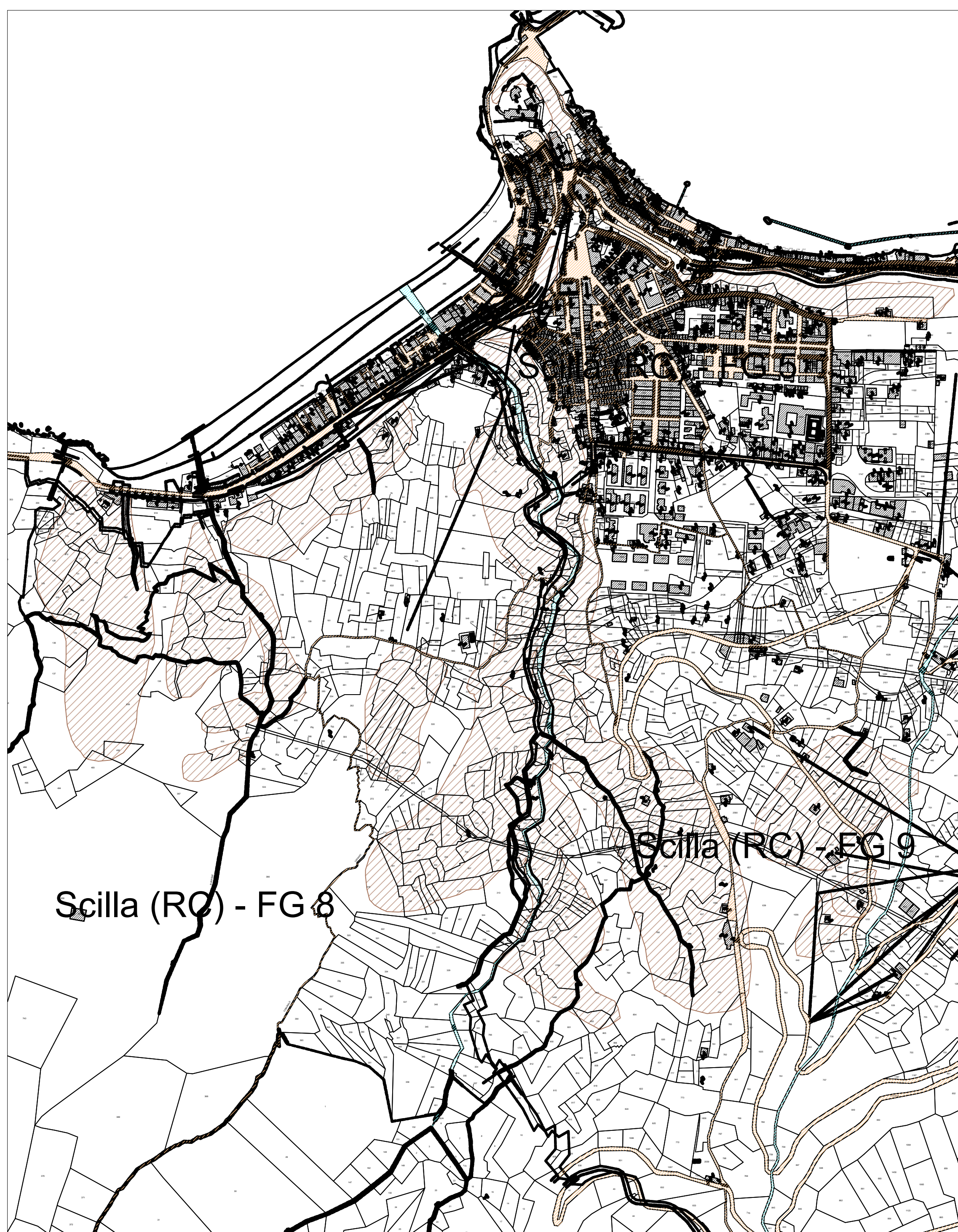
CFF1 - Area di riforestazione su zona a rischio frana