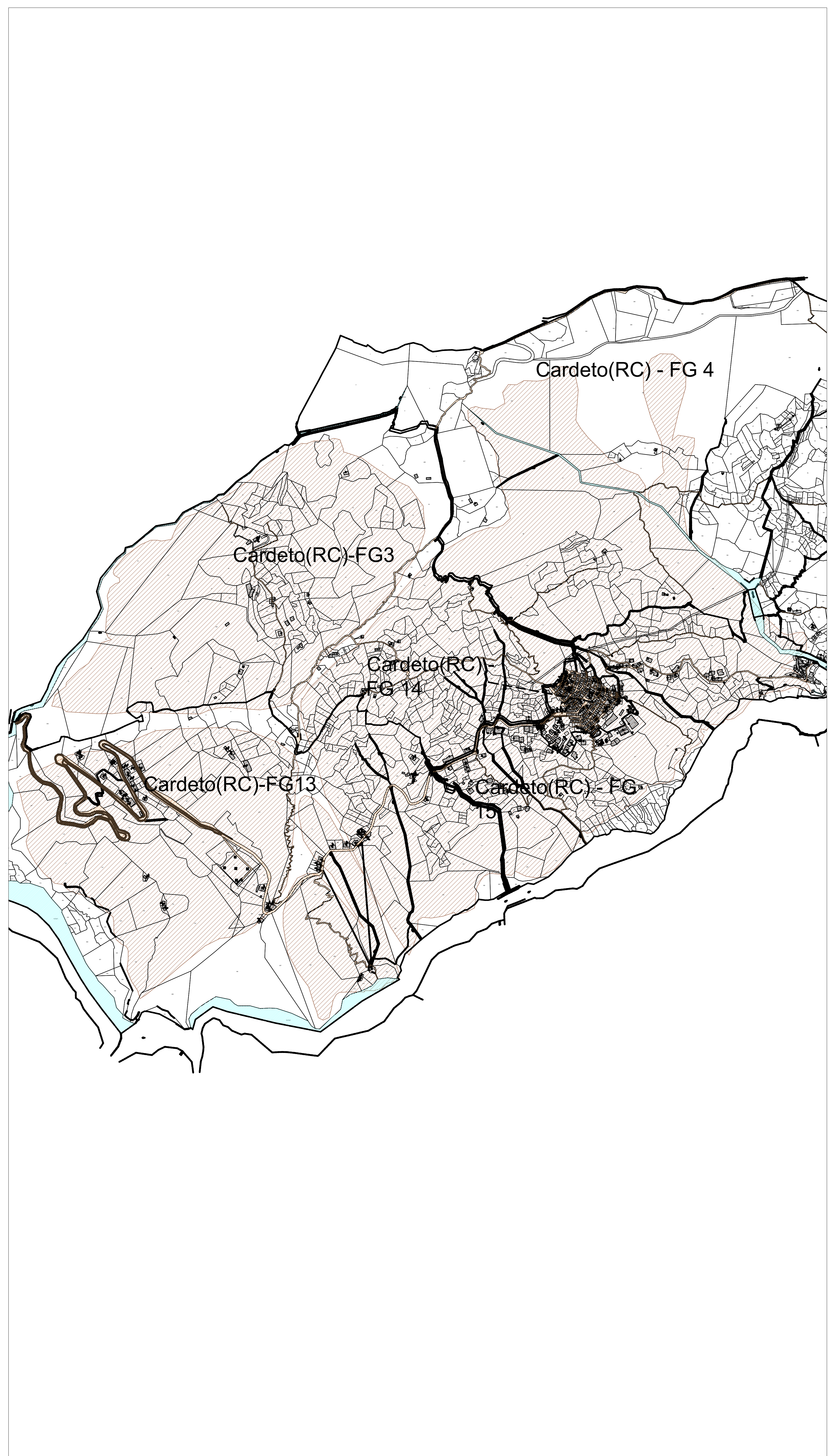
CFF3 - Area di riforestazione su zona a rischio frana