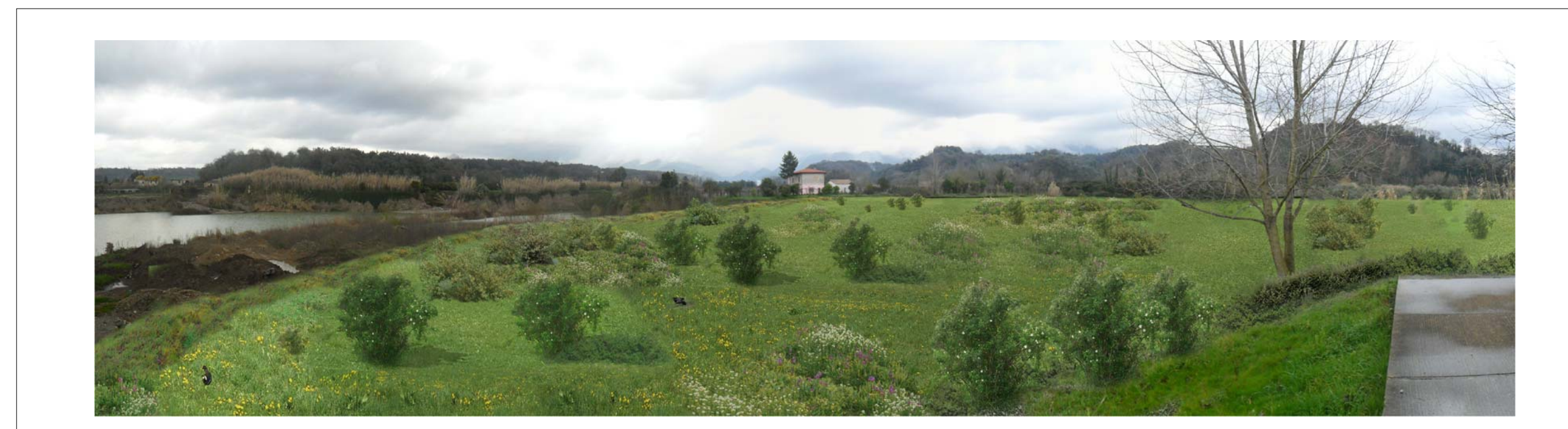
PANORAMICA DEPOSITO CRA 4-B: SITUAZIONE POST OPERAM – DEPOSITO DEFINITIVO