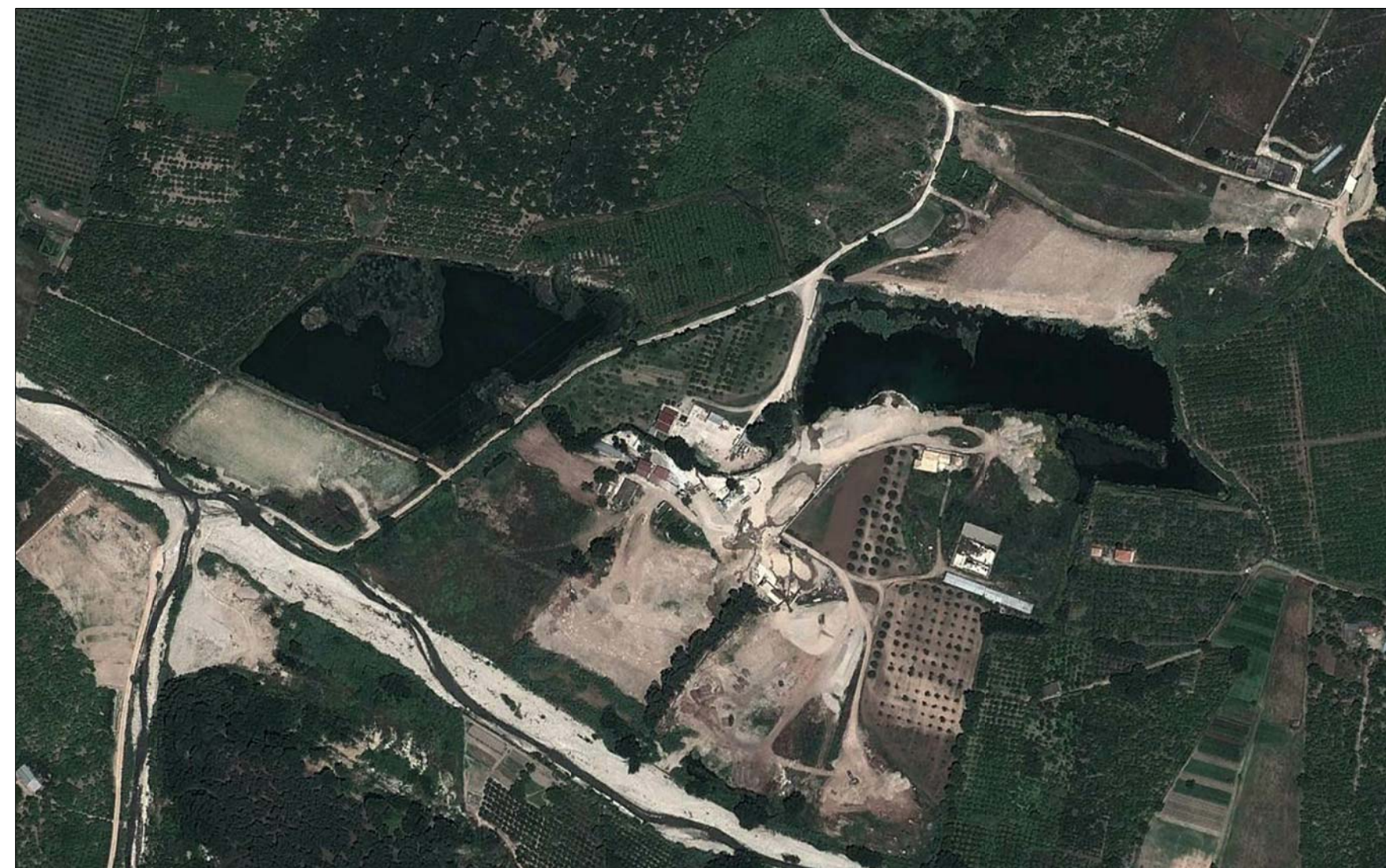
ORTOFOTO: SITUAZIONE ANTE OPERAM