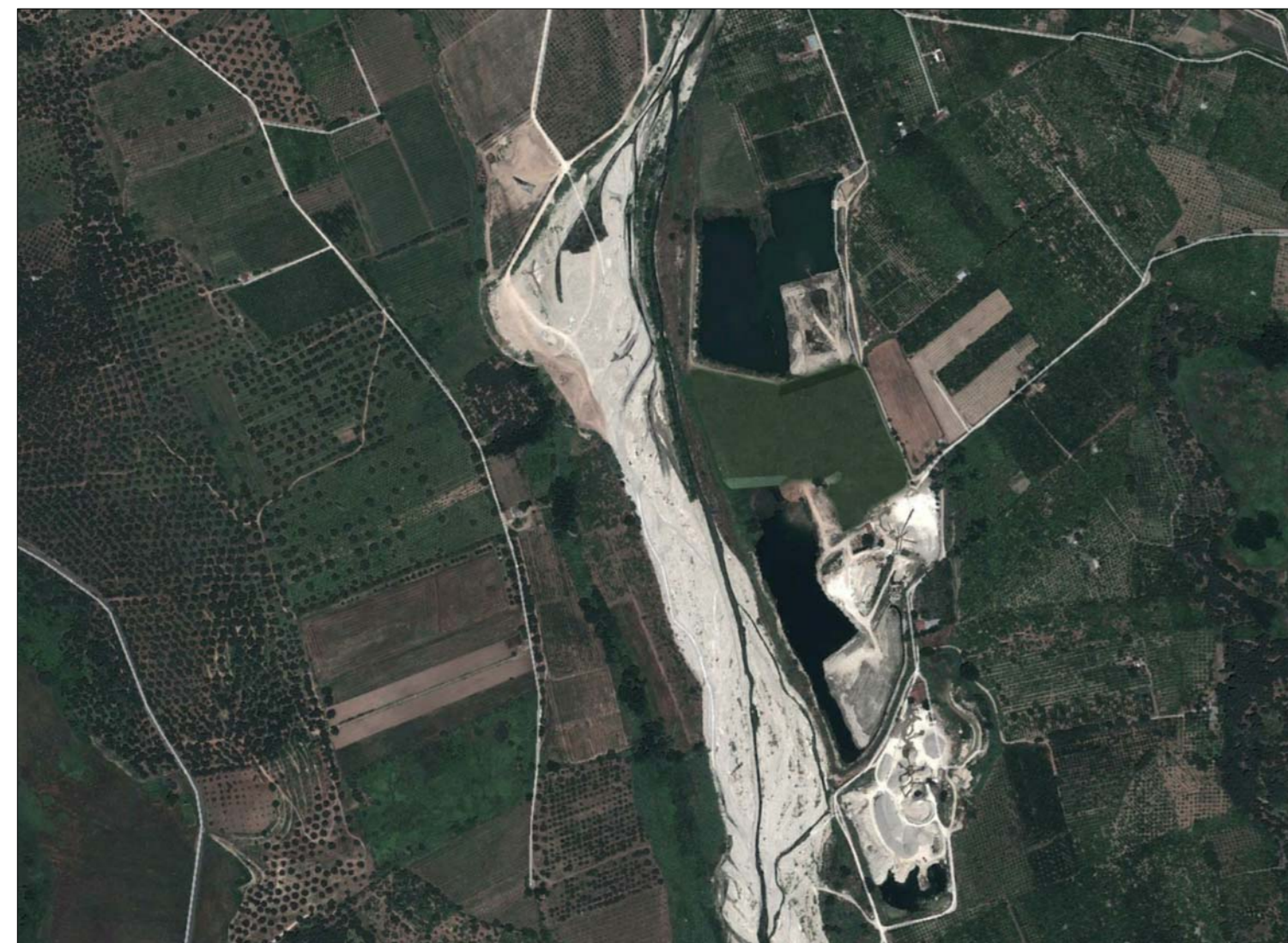
ORTOFOTO: SITUAZIONE POST OPERAM DEPOSITO DEFINITIVO