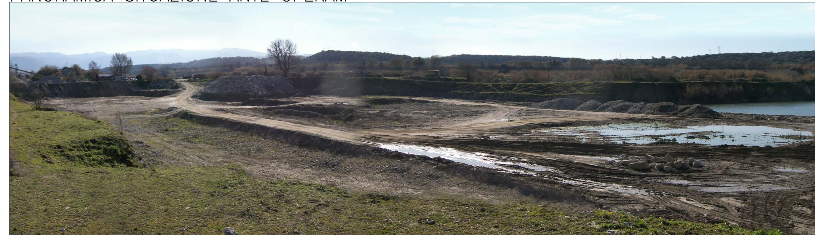
PANORAMICA SITUAZIONE ANTE OPERAM