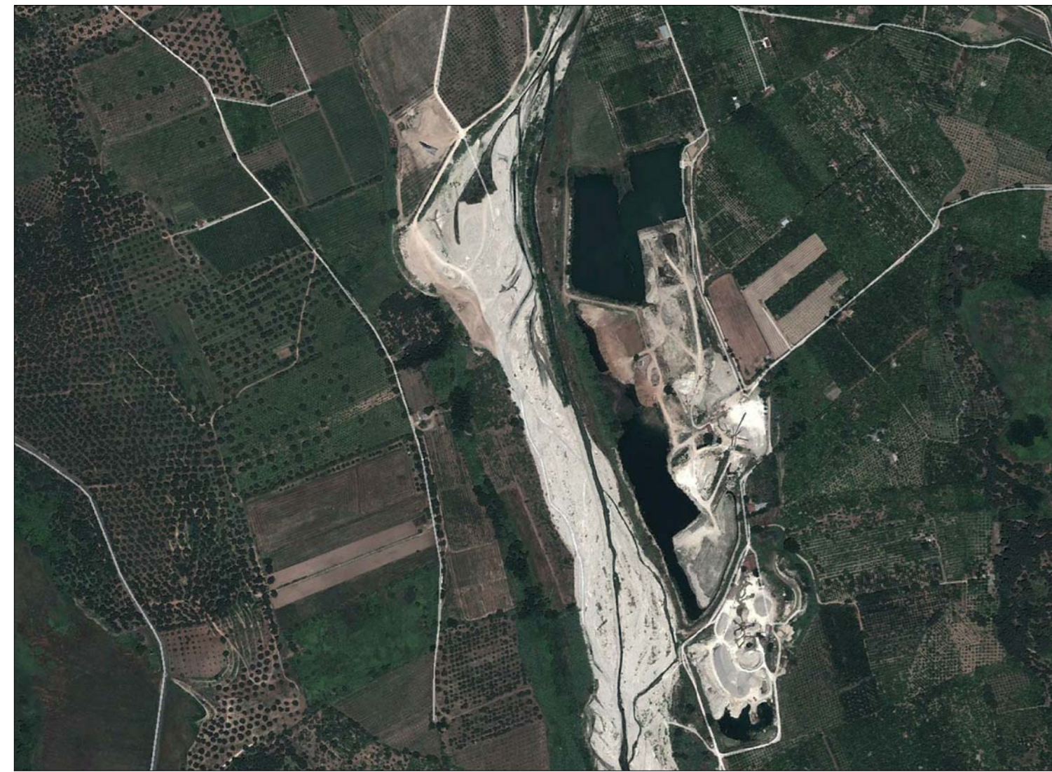
ORTOFOTO: SITUAZIONE ANTE OPERAM