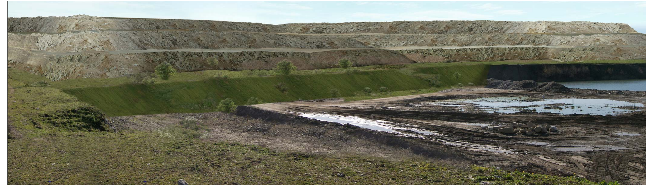
PANORAMICA SITUAZIONE POST OPERAM – DEPOSITO TEMPORANEO