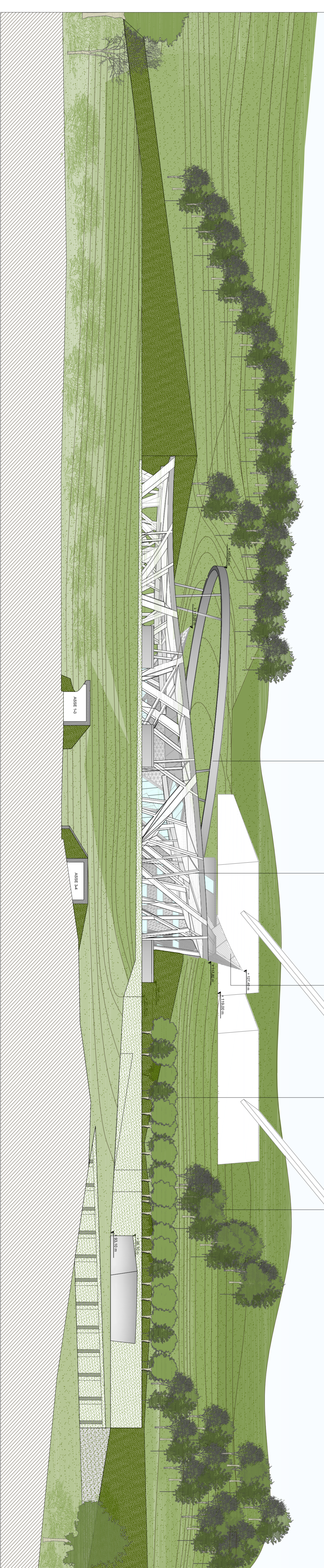
01 PROSPETTO NORD 1:500

NATI NATI UFFICI INGRESSO SOTTOPORTA FALDI INGRESSO AEREO