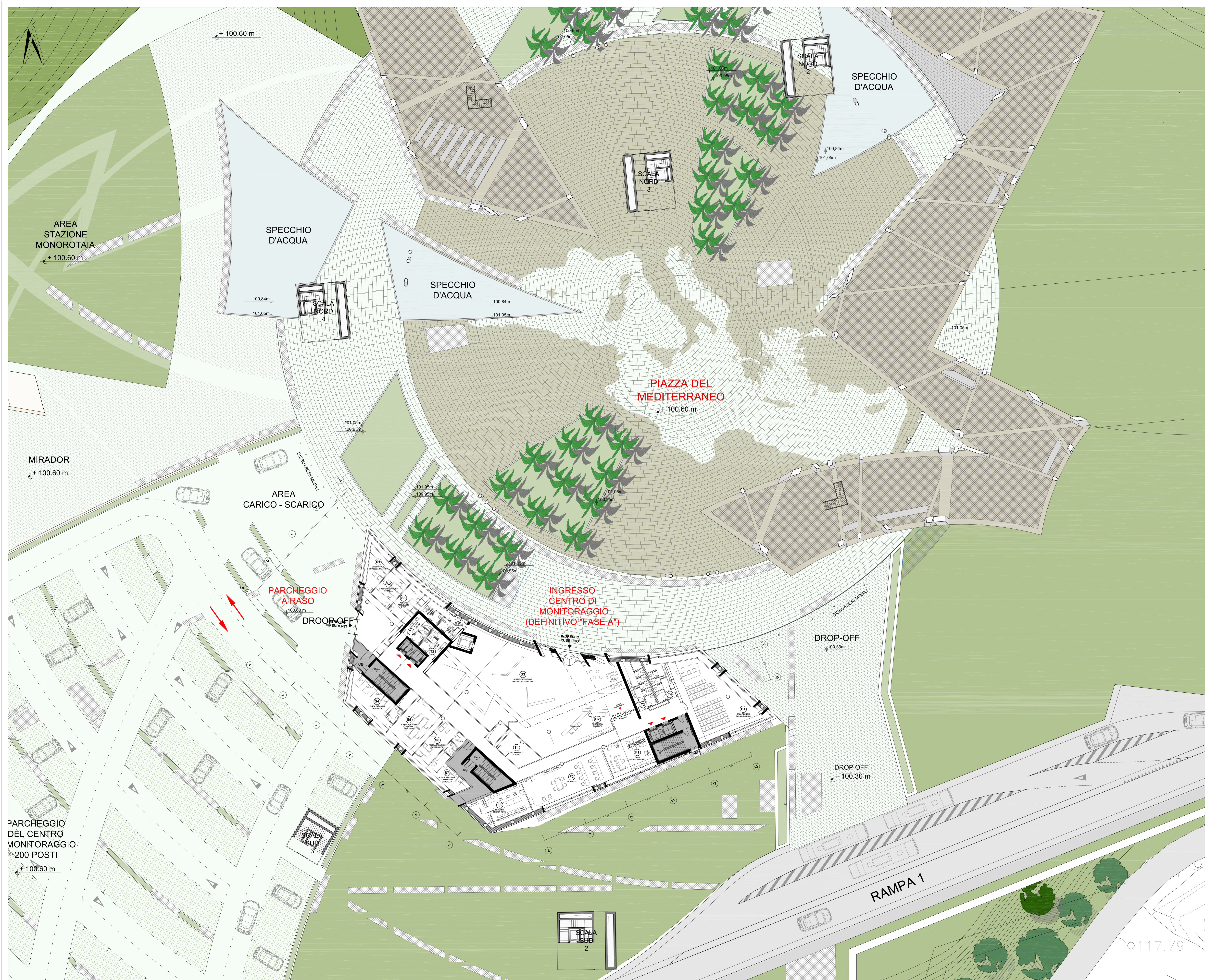
01 PLANIMETRIA GENERALE