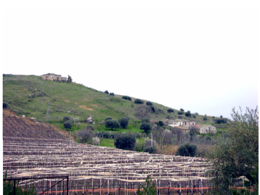
5- Robba Salomone (foto 2)