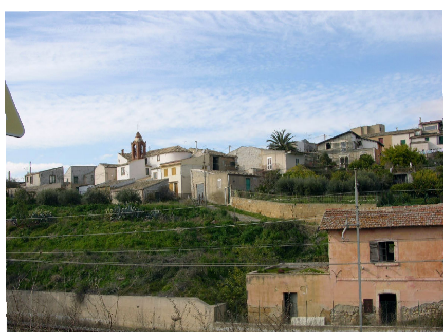
4 - Borgo Favarella (foto 2)