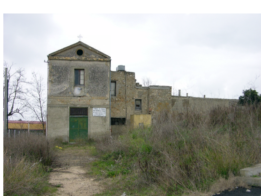
7- Chiesa S. Teresa