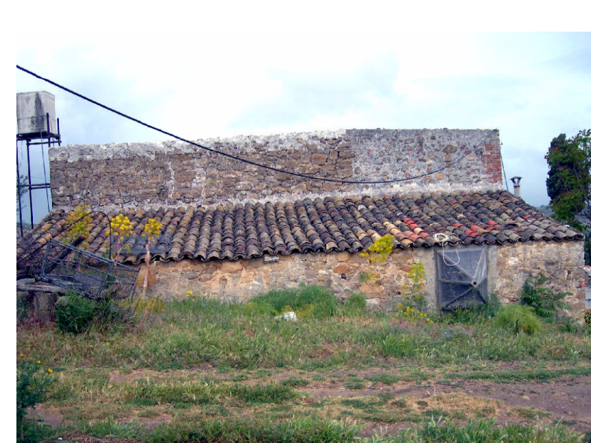
8- Robba Bigini (foto 1)