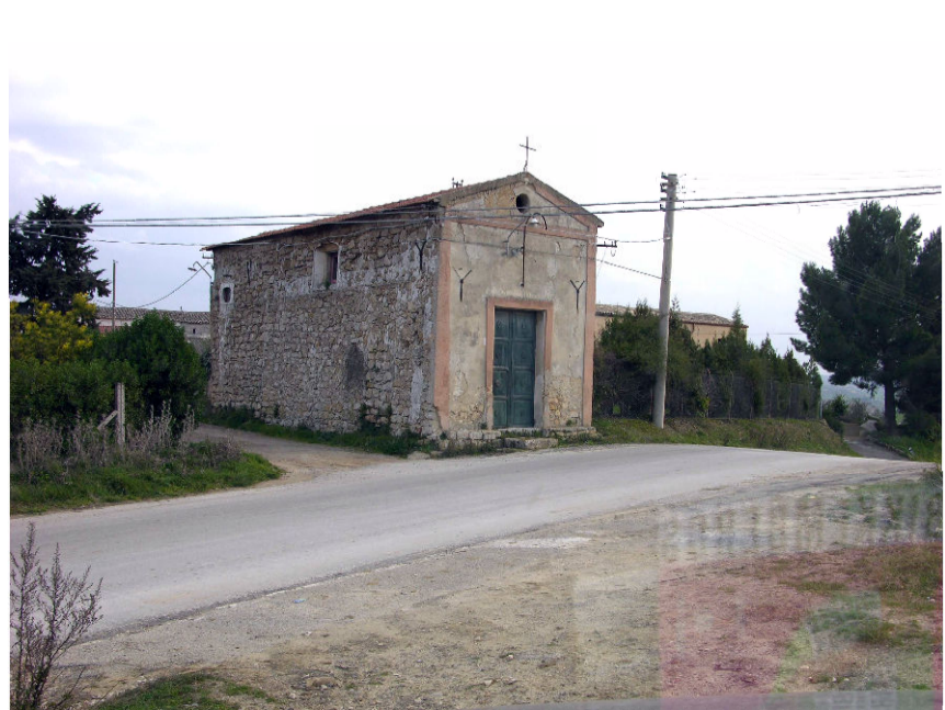
6- Chiesa S. Michele