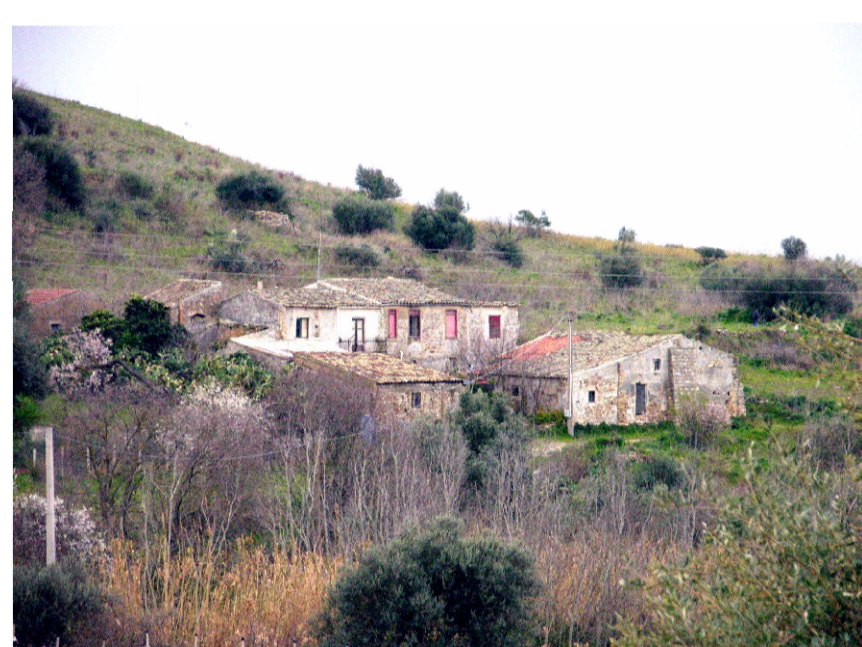
5- Robba Salomone (foto 1)