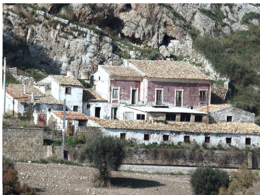
3 - Masseria Urso