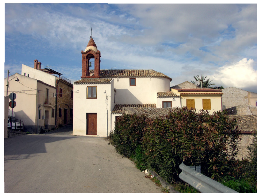
4 - Borgo Favarella (foto 1)