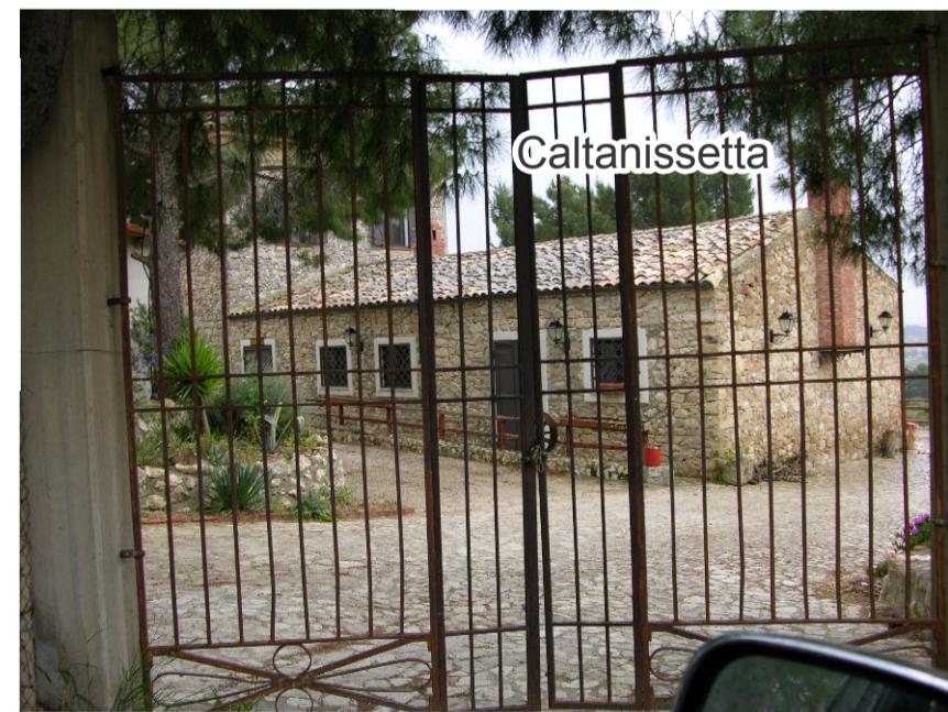
9- Massena Bigini