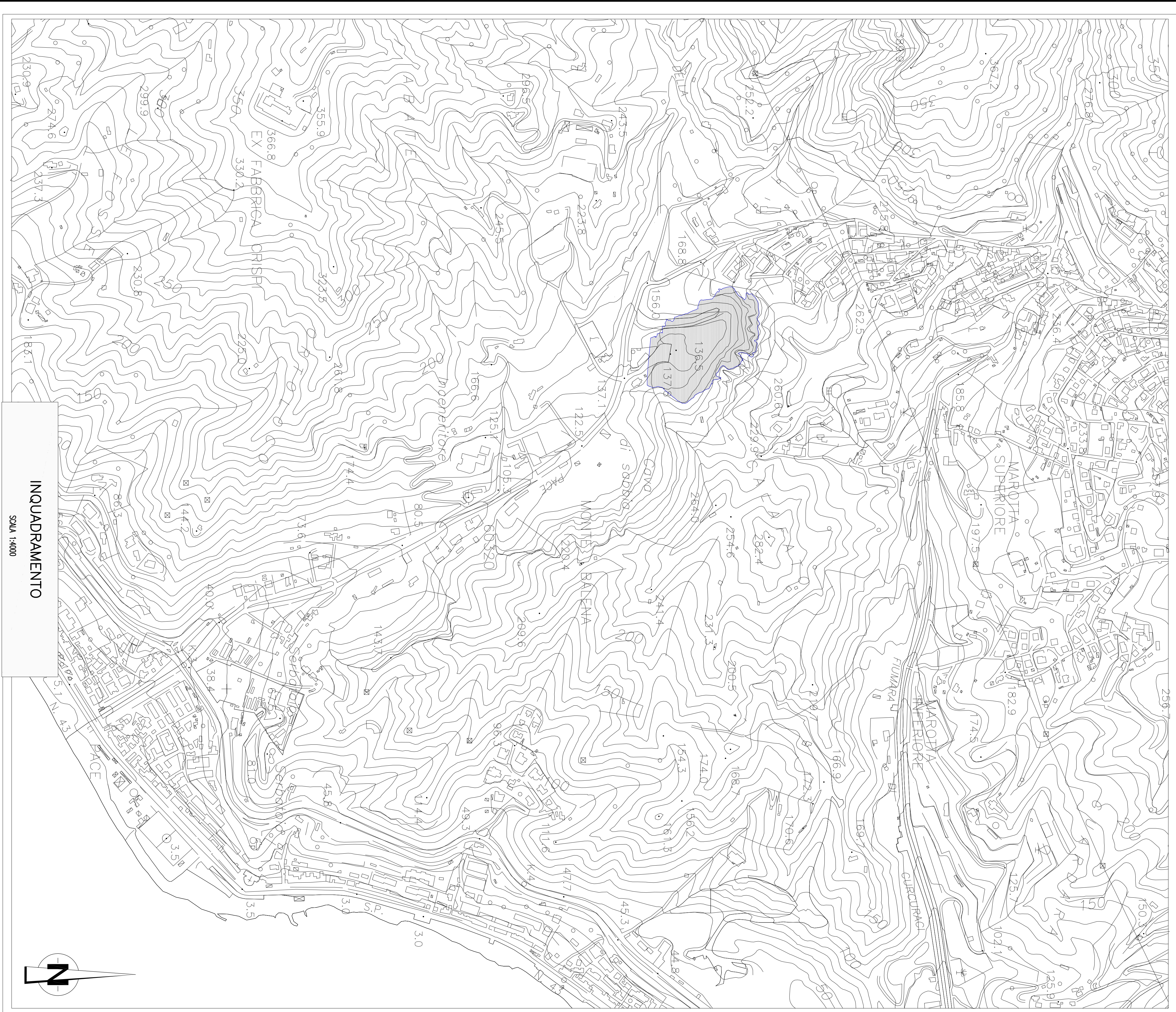
INQUADRAMENTO Scala 1:4000