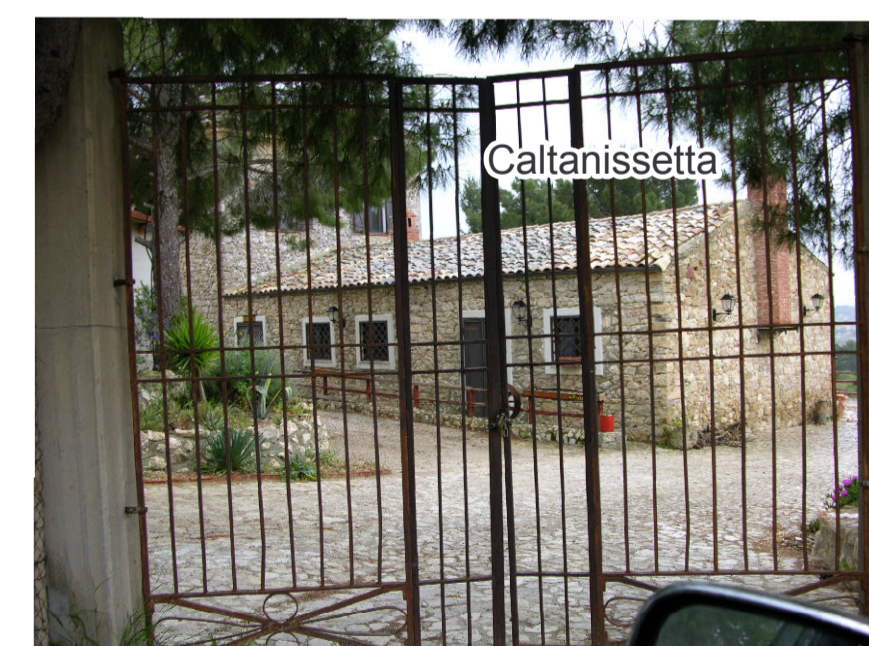
9- Masseria Bigini