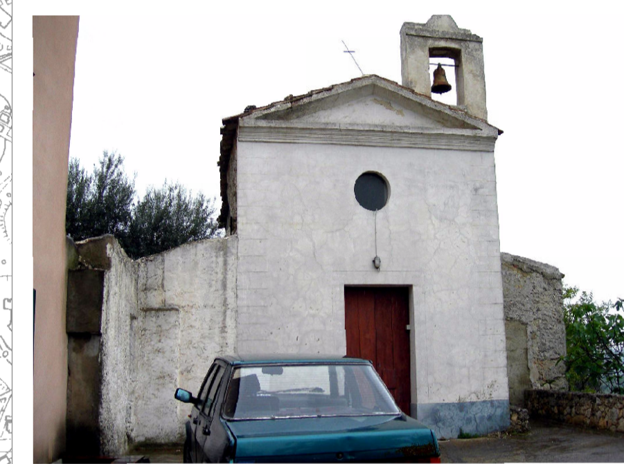
10 - Chiesa S. Filippo Neri (foto 1)