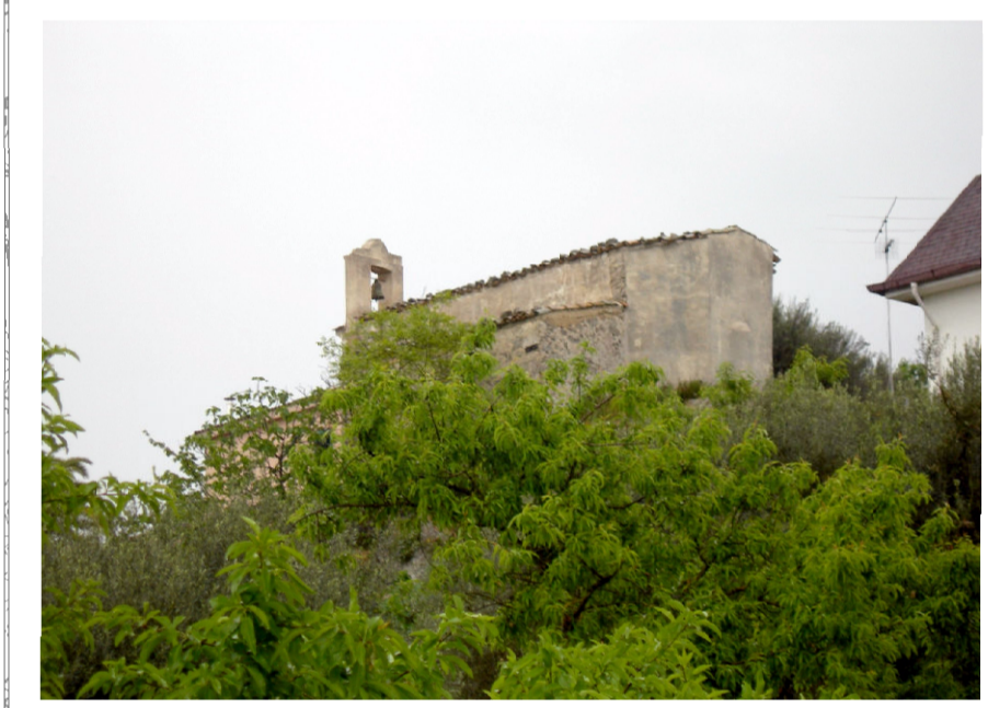
10 - Chiesa S. Filippo Neri (foto 2)