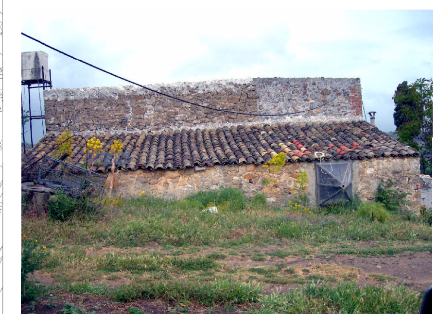
8- Robba Bigini (foto 1)