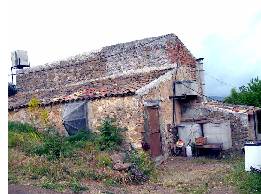
8- Robba Bigini (foto 2)