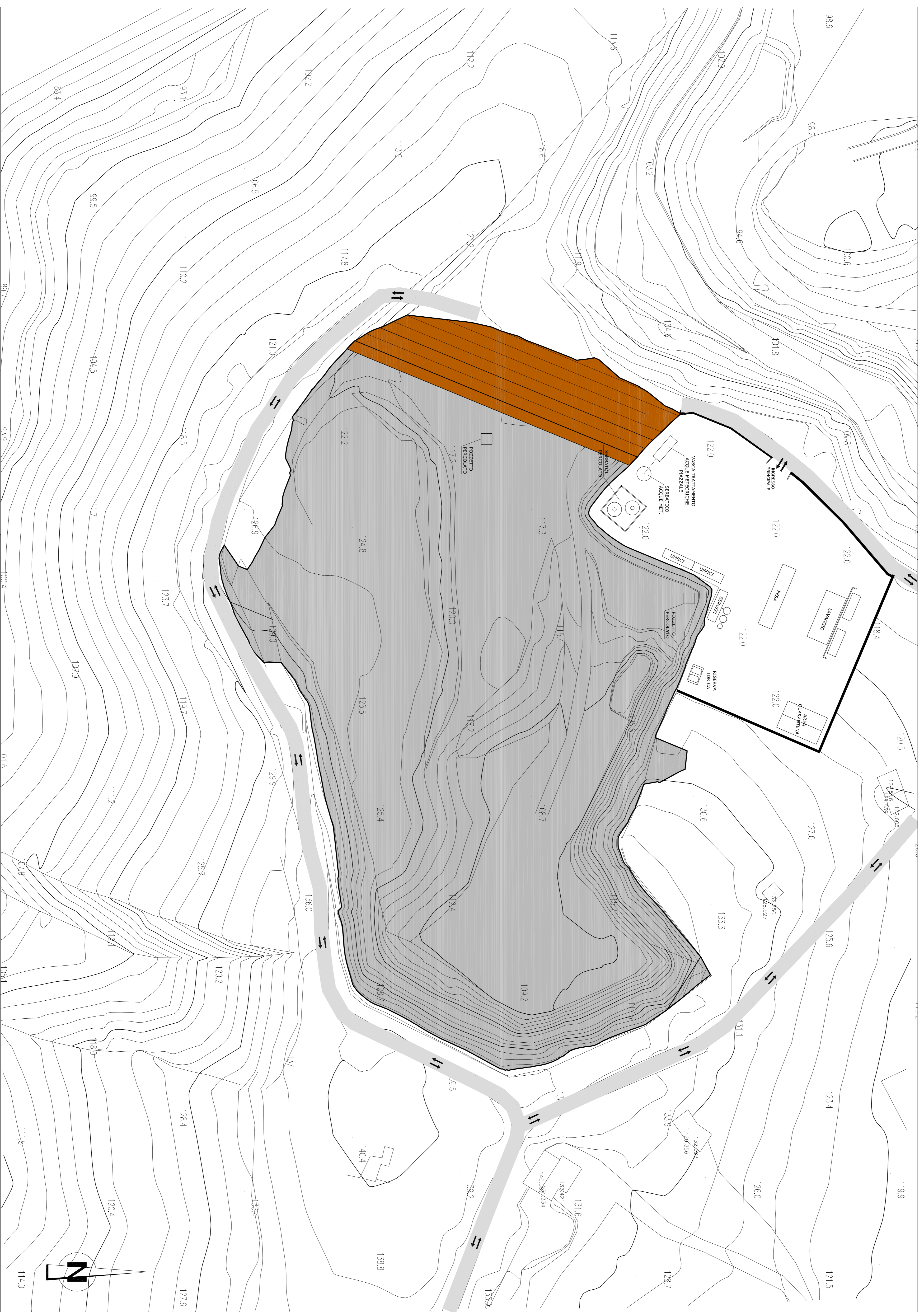
PLANIMETRIA DI PROGETTO E VIABILITA' SCALA 1:500