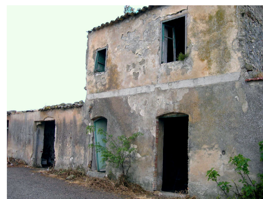
13- Masseria Appennati (foto 1)