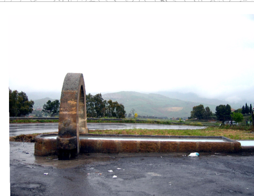
12- Abbeveratoio Rovetto (foto 1)