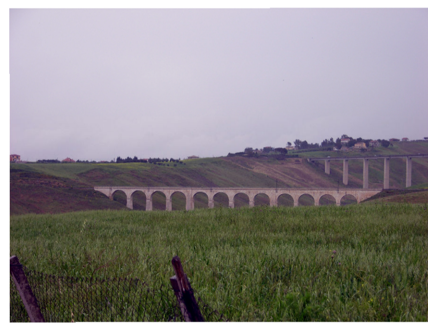
11 - Viadotto ferroviario Busiti