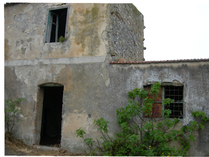
13- Masseria Appennati (foto 2)