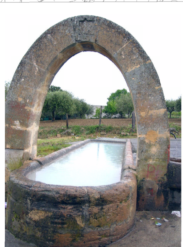
12- Abb. Rovetto (foto 2)