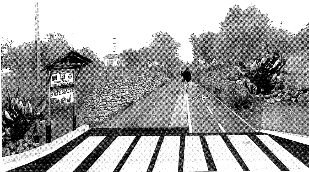
Strada di ingresso al Forte Siacci, stato di progetto

La pista sarà provvista della specifica segnaletica verticale all'inizio ed alla fine del percorso, dopo ogni interruzione ed intersezione, e di scritte orizzontali che ne identificheranno la destinazione. La pista ciclabile sarà dotata di barriere di protezione sui lati dove il dislivello eccessivo crea situazioni di pericolo.