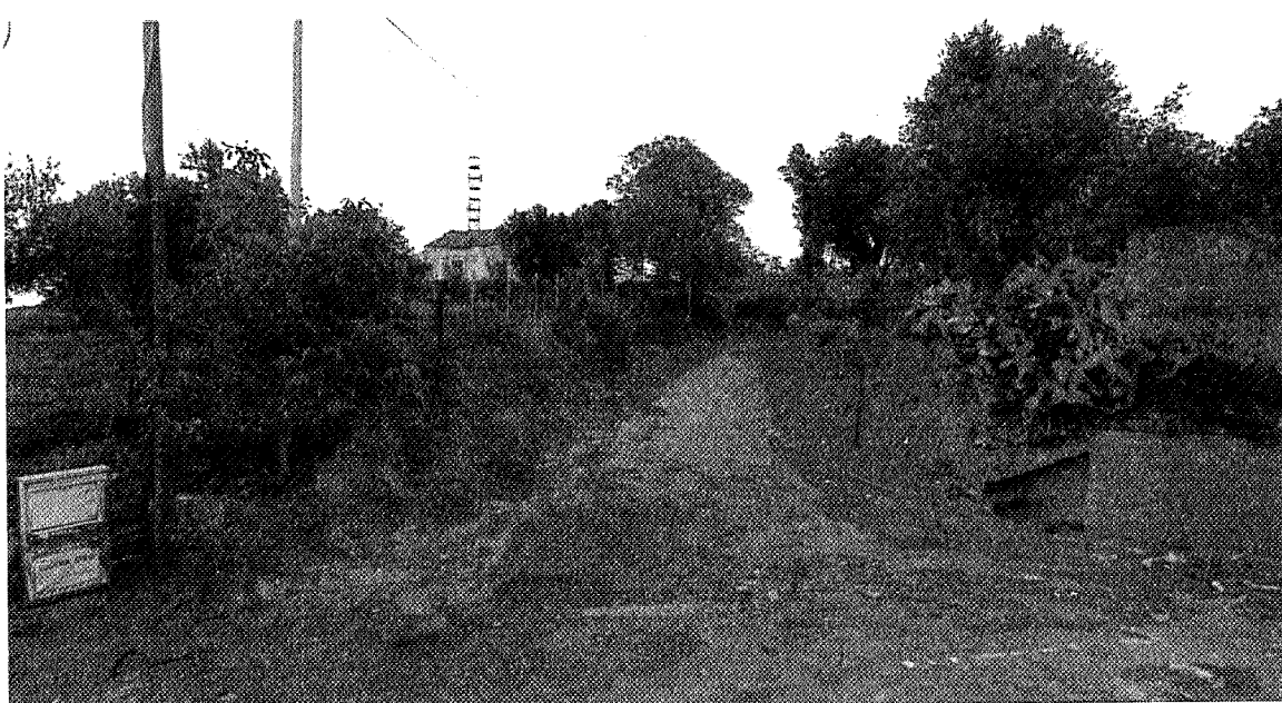
Strada di ingresso al Forte Siacci, stato di fatto

La realizzazione dei percorsi consisterà nella ripavimentazione dei tracciati.