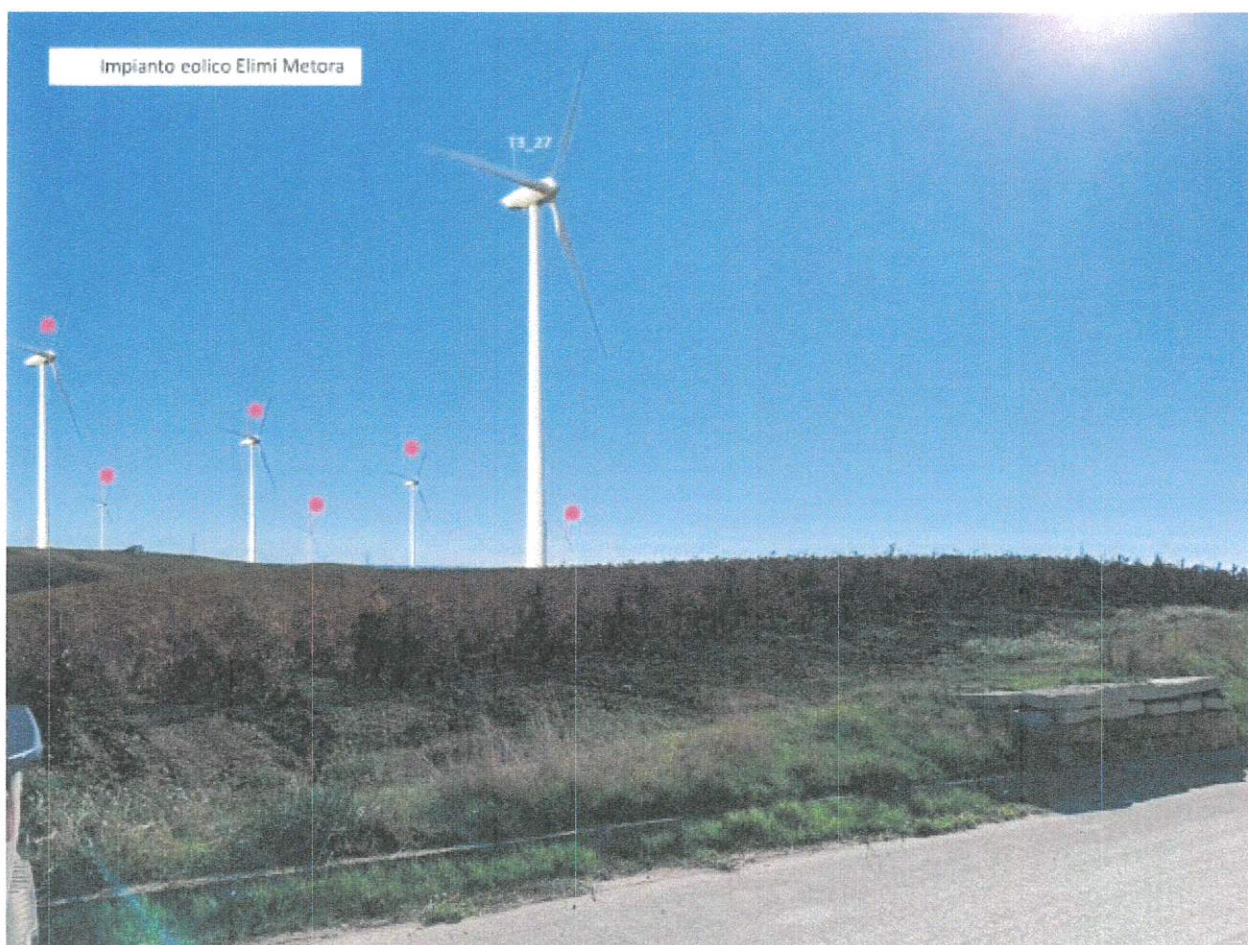
Figura 3 – Elaborato di progetto "GRE_EEC_D_26_IT_W_14703_00_135_00"-layout d'impianto ed impianti eolici esistenti autorizzati ed in autorizzazione- stralcio fotosimulazione turbina T3 27.